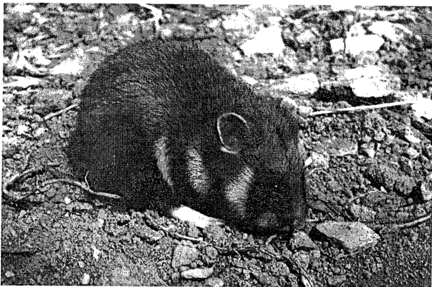
OBRÁZEK 1: Křeček polní ( Cricetus cricetus). 31.8.1994, Tři Bubny.

FIGURE 1: Hamster ( Cricetus cricetus). 31.8.1994, Tři Bubny.