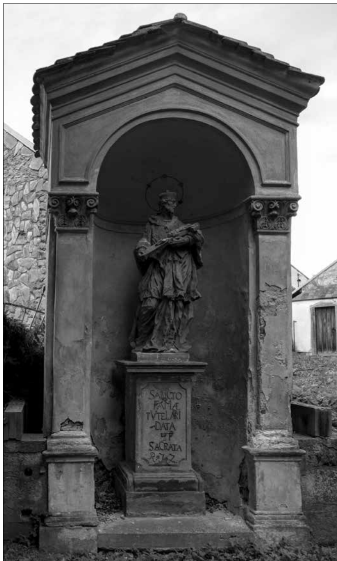
Obr. 10: Výklenková kaple sv. Jana Nepomuckého v Cholticích z roku 1756 (foto autor, 2015).