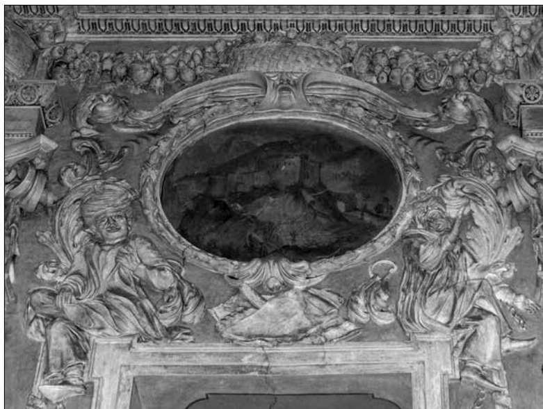
Obr. 5: Dvojice heretiků – Nestorius a Mání – sedící na okrajích dveřní šambrány, kaple sv. Romedia v Cholticích.

Podobně pokřivené výrazy a zdeformované tělesné proporce, ovšem ze zcela jiného důvodu, nesou další postavy, které tvoří součást štukové výzdoby interiéru kaple sv. Romedia, z ikonografického hlediska zřejmě tu nejzajímavější. Těmito postavami je osmero světových kacířů (srov. obr. 5), sedící po dvojicích na profilovaných okenních a dveřních rámech (Árius, Šimon Kouzelník, Jan Hus, Jeroným Pražský, Nestorius, Mání, Martin Luther, Jan Kalvín). Každé z těchto postav navíc přísluší jeden hanlivý emblém charakterizující její osobu za pomoci situovaného zvířecího motivu (např. Jan Kalvín – prase). Zcela neobvyklé zakomponování heretiků do výtvarného pojetí interiéru římskokatolické církevní stavby