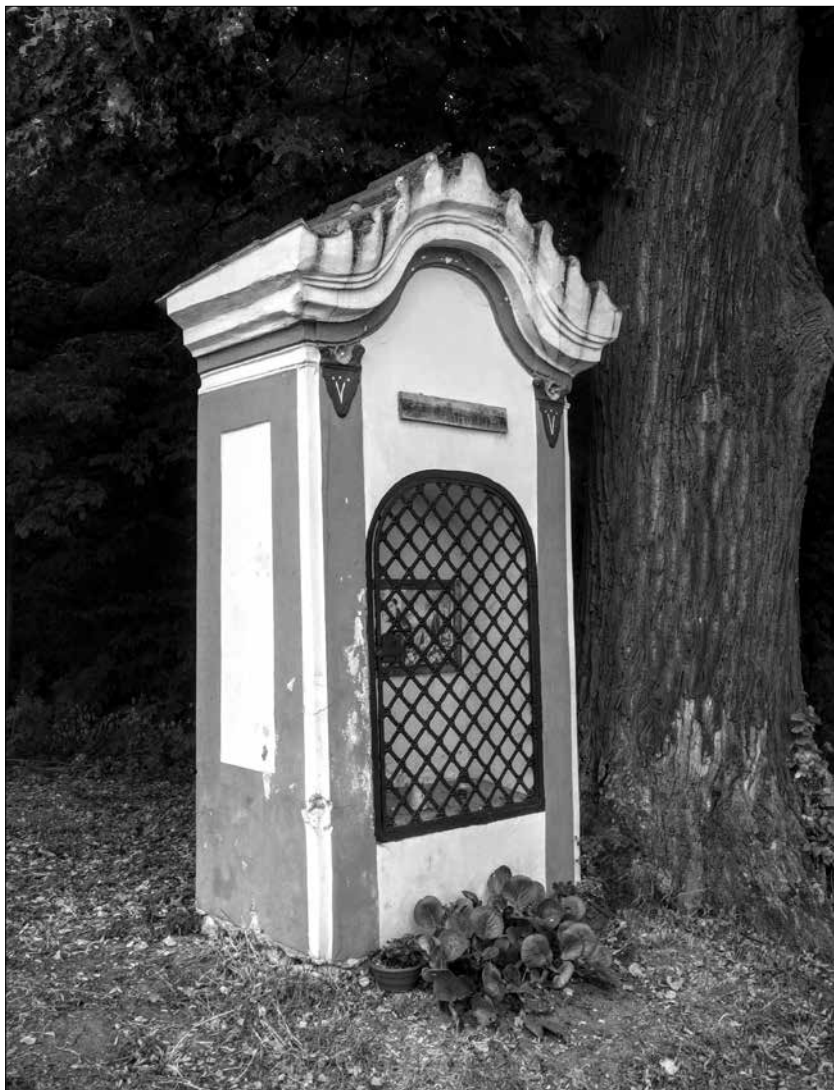
Obr. 9: Kaplička sv. Antonína z počátku 30. let 18. století stojící na okraji choltické zámecké obory (foto autor, 2015).