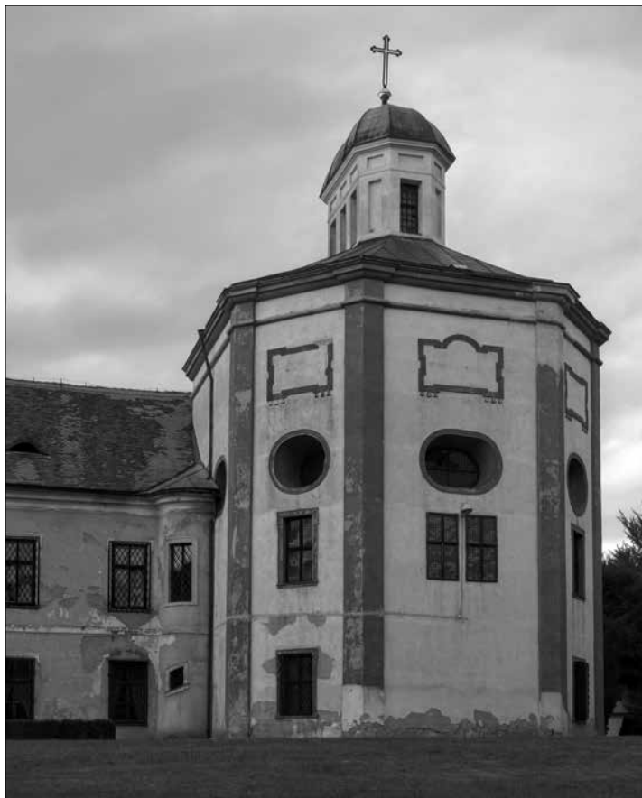
Obr. 1: Kaple sv. Romedía v Cholticích od jihu (foto autor, 2015).

navíc postupem času získal značnou oblibu jak mezi poddanými, tak mezi aristokraty, navázané prostřednictvím sociálních sítí na choltickou větev Thunů, minimálně v prostoru tehdejšího Chrudimského kraje. 18)