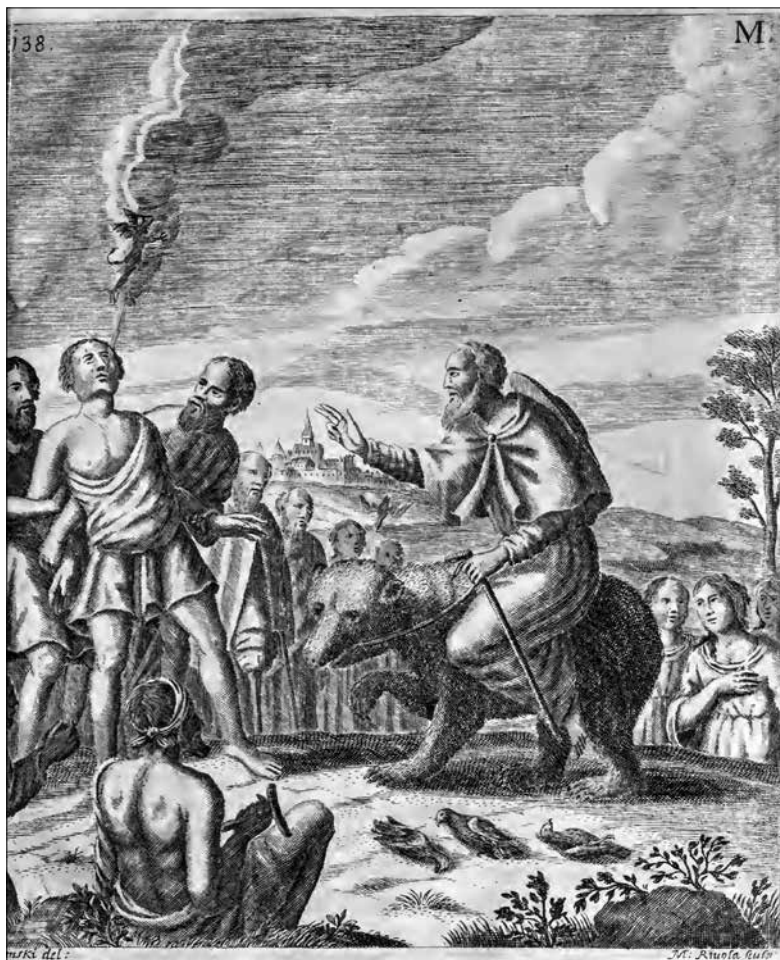
Obr. 4: Rytina nástěnné malby ze zámecké kaple v Cholticích zobrazující scénu, ve které sv. Romedius léčí mladíka posedlého d'áblem. Rytina pochází z dobového tisku Amanda Friedenfelse Gloriosus Sanctus Romedius ...

z Thaur “). Za vznikem tohoto akronymu ovšem nestála pouhá náhodná volba některé z biblických postav s odpovídajícím jménem, nýbrž snaha o souznění zobrazených výjevů se ctnostmi sv. Romedía, emblematicky ztvárněnými na stropě lucerny a rozpracovanými v rámci deseti rozměrných fresek ze života světce ve spodní části kopule (srov. obr. 4).