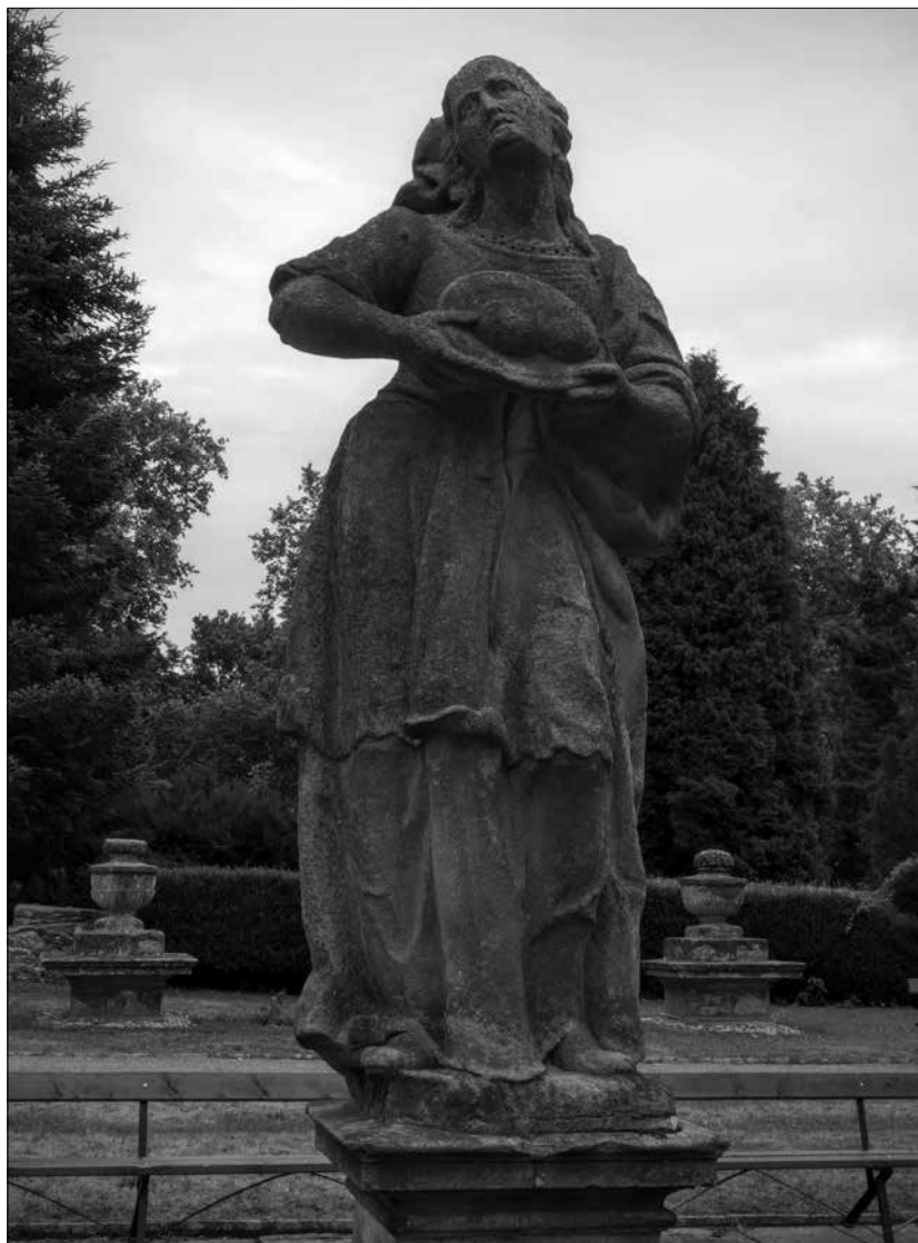
Obr. 8: Detail sochy sv. Agáty z nádvoří choltického zámku (foto autor, 2015).