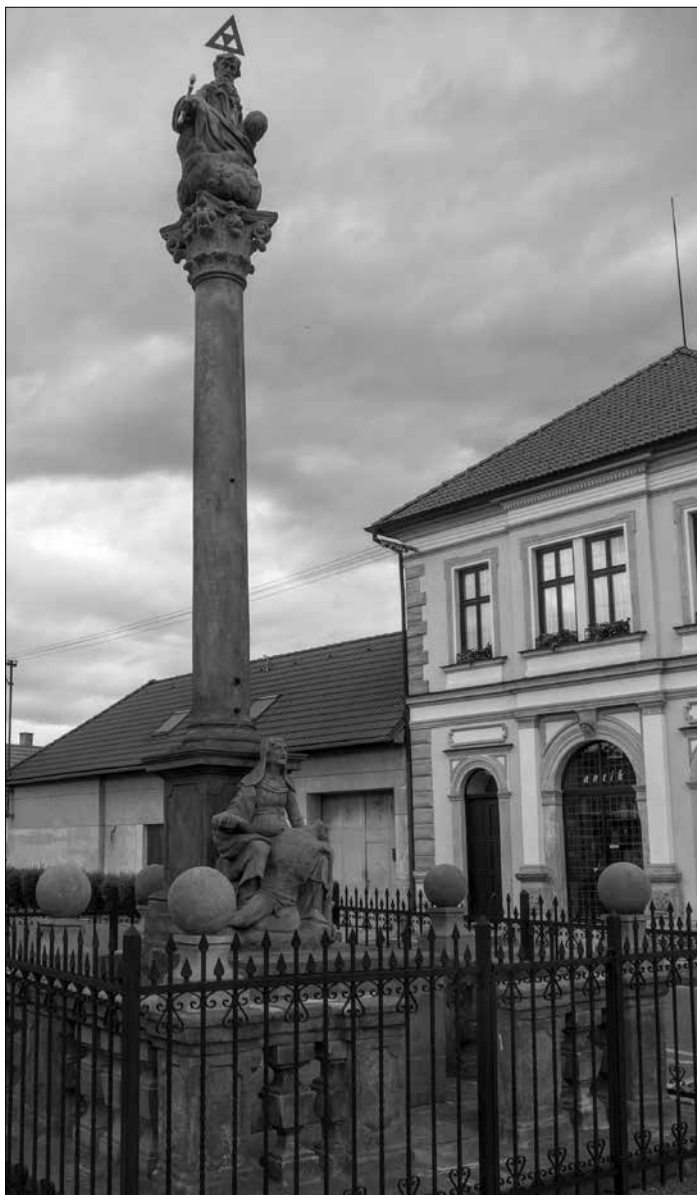
Obr. 6: Trojiční morový sloup z konce 17. století, Choltice (foto autor, 2015).