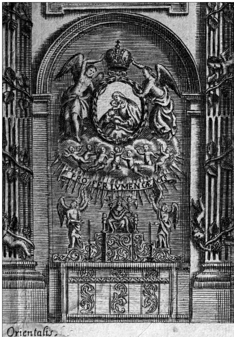
Obr. 2: Rytina oltáře Panny Marie Pomocné v kapli sv. Romedia v Cholticích z tisku Amada Firedenfelse z roku 1699 ( Ectypon Sumptuosae... ).