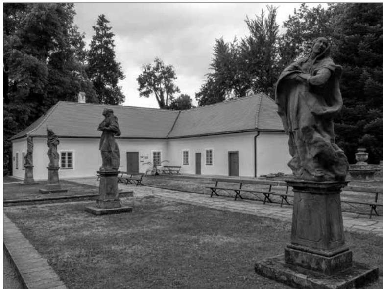
Obr. 7: Barokní sochy světců na nádvoří choltického zámku, v popředí socha sv. Markéty (?).

(srov. obr. 9) 28 nacházející se na okraji zámecké obory či s výklenkovou kapličkou sv. Jana Nepomuckého (srov. obr. 10) se sochou světce stojící před vstupem do zámeckého areálu (pochází ovšem až z roku 1756). Volba zmíněných světců, s výjimkou neobvyklého sv. Romedie, jenž byl však vybrán ze zcela specifického důvodu rodové identifikace Thunů s touto postavou, nebyla pro venkovský prostor nijak výjimečná, jelikož tito svatí představovali buď patrony řemesel pěstovaných na daném dominiu (resp. patrony zemské), případně byli vzýváni jako ochránci před nejrůznějšími pohromami nebo nemocemi, pro raný novověk zcela běžnými a často bohužel i silně ničujícími (požáry, bouřky, povodně, sucho, mor, nemoci hospodářských zvířat apod.).