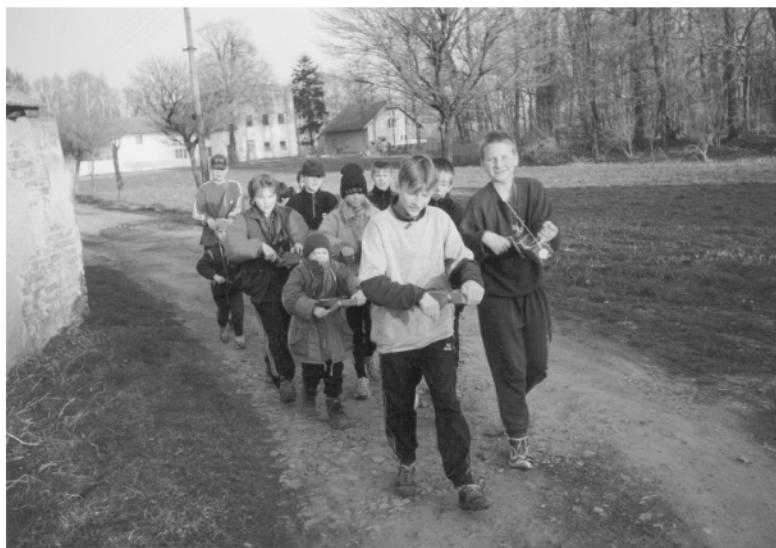
Trojovice (okr. Chrudim), obchůzka na Zelený čtvrtek, 2002.