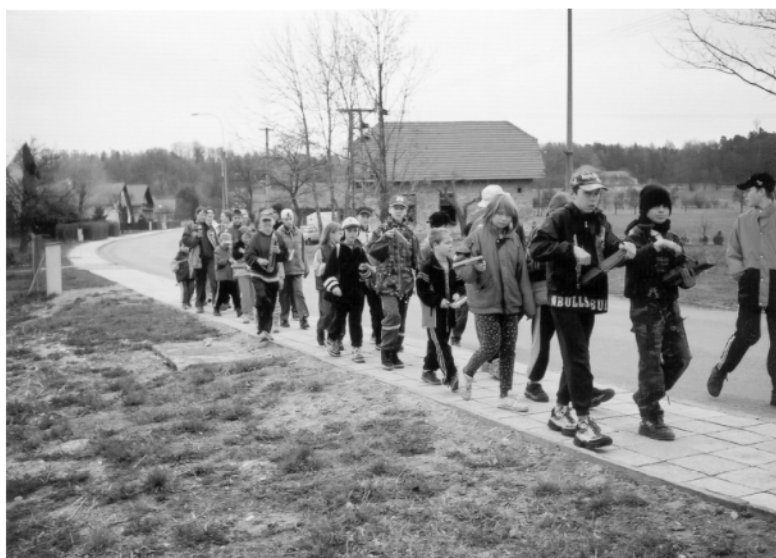
Jaroslav (okr. Pardubice), obchůzka na Velký pátek, 2003.