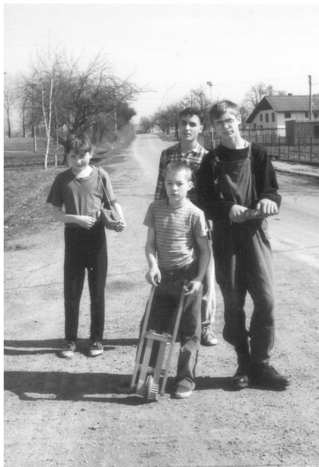
Mentour (okr. Chrudim), zahájení obchůzky na Zelený čtvrtek, 1994.