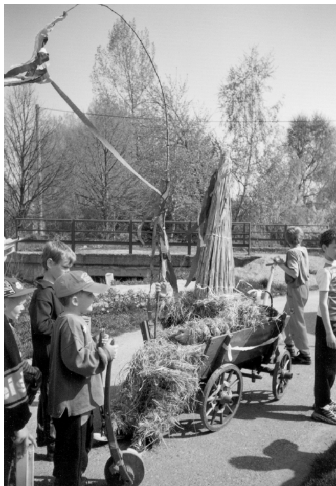
Stradouň (okr. Chrudim), obchůzka s Jidášem na Bílou sobotu, 2000.