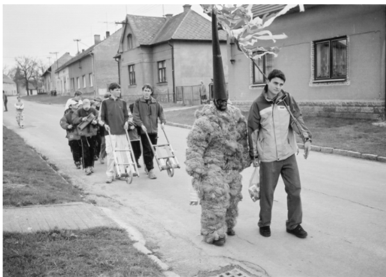
Vraclav (okr. Ústí n/O.), obchůzka s Jidášem na Bílou sobotu, 2003.