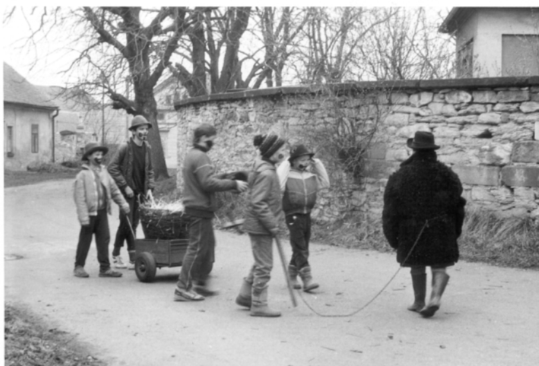
Uhersko (okr. Pardubice), obchůzka s Jidášem na Bílou sobotu, 1991.