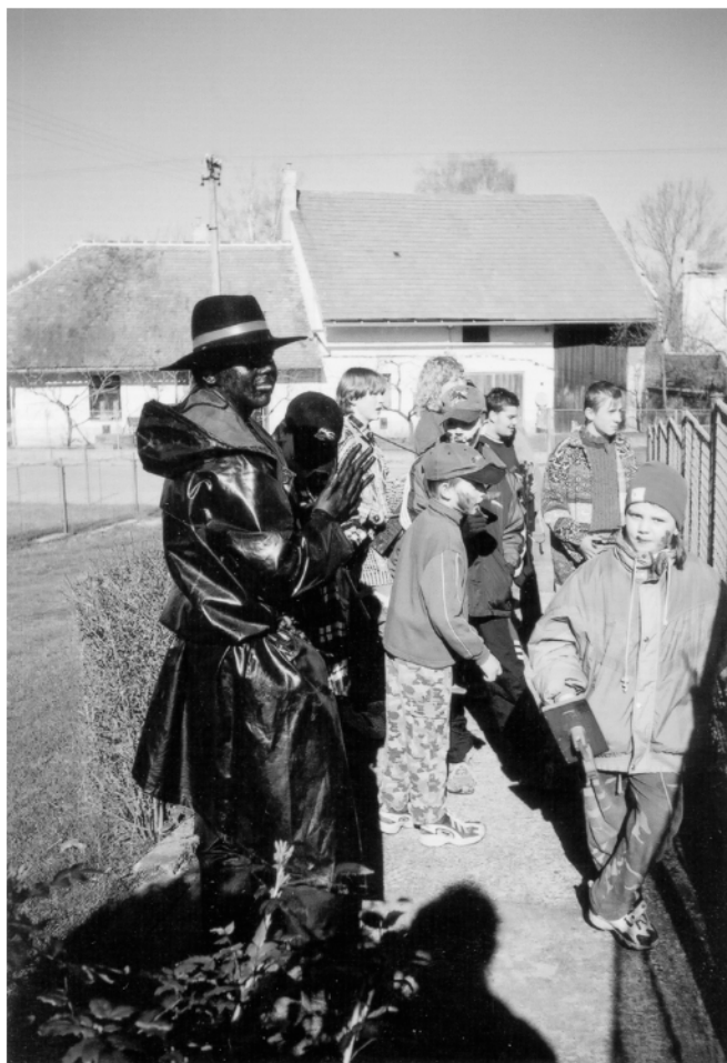
Rosice – severní část (okr. Chrudim), obchůzka s Jidášem na Bílou sobotu, 2002.