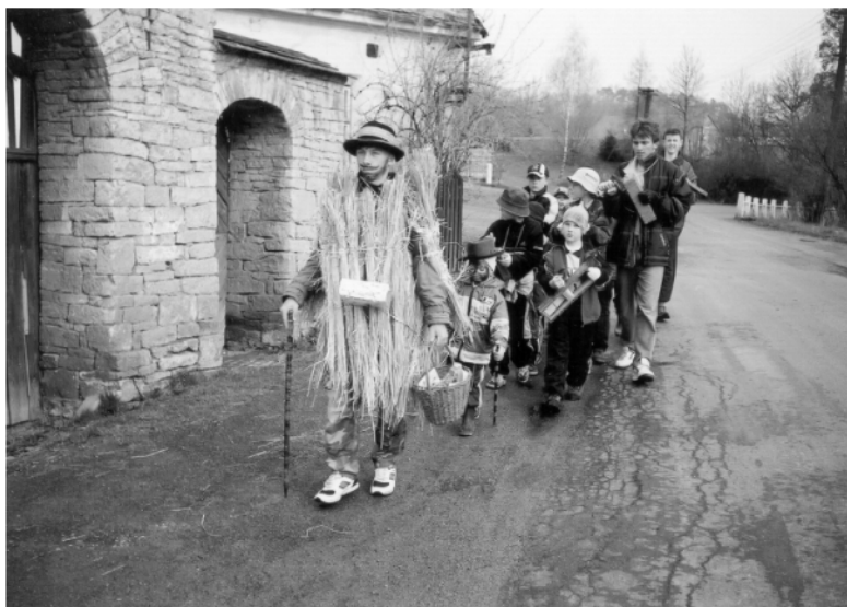
Radim (okr. Chrudim), obchůzka s Jidášem na Bílou sobotu, 2003.