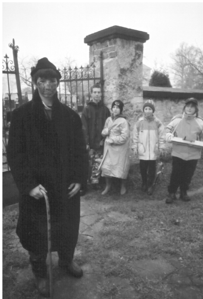
Trojovice (okr. Chrudim), občůzka s Jidášem na Bílou sobotu, 2005.