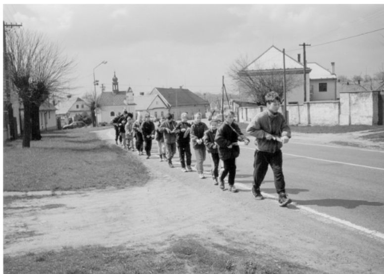
Čankovice (okr. Chrudim), obchůzka na Zelený čtvrtek, 2001.