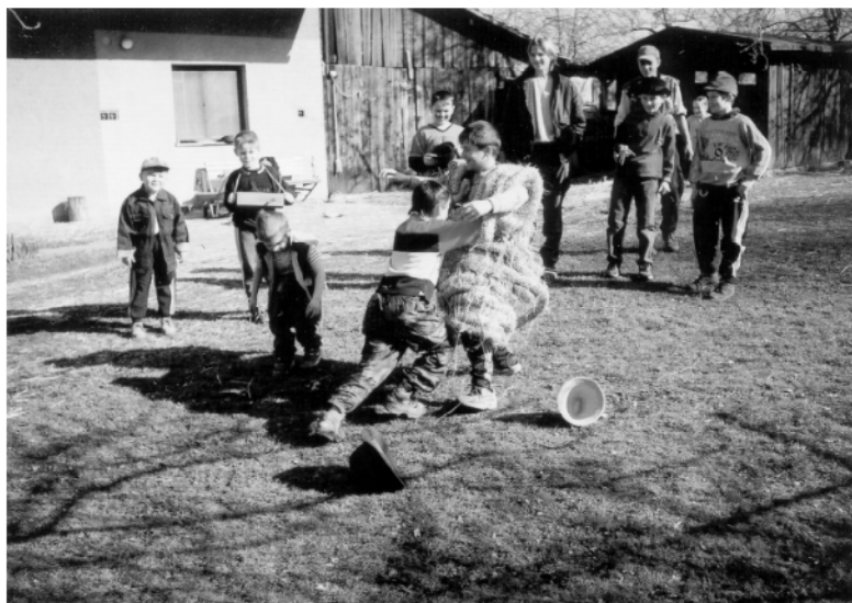
Litětiny (okr. Pardubice), zápas vodiče s Jidášem po ukončení obchůzky na Bílou sobotu, 2002.