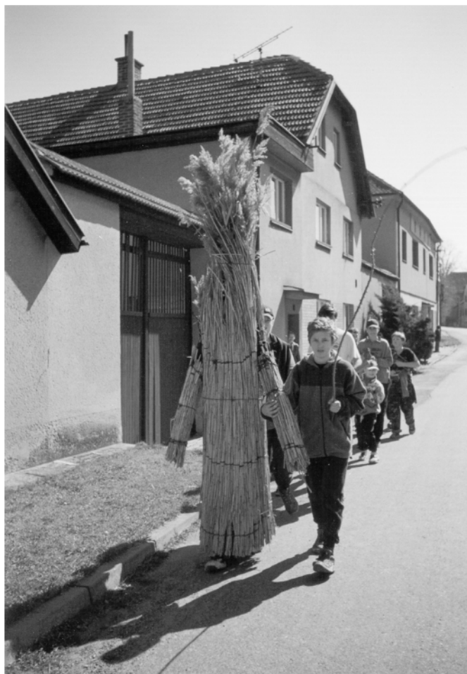
Sedlec (okr. Ústí n/O.), obchůzka s Jidášem na Bílou sobotu, 2002.