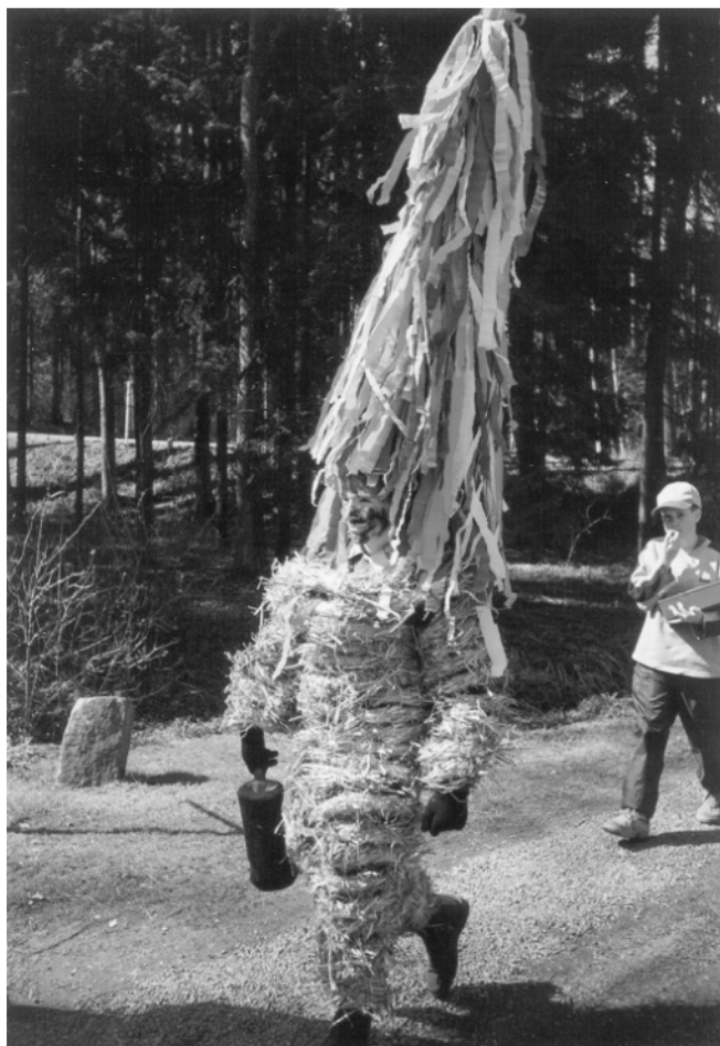
Domoradice (okr. Ústí n/O.), Jidáš při obchůzce na Bílou sobotu, 2002.