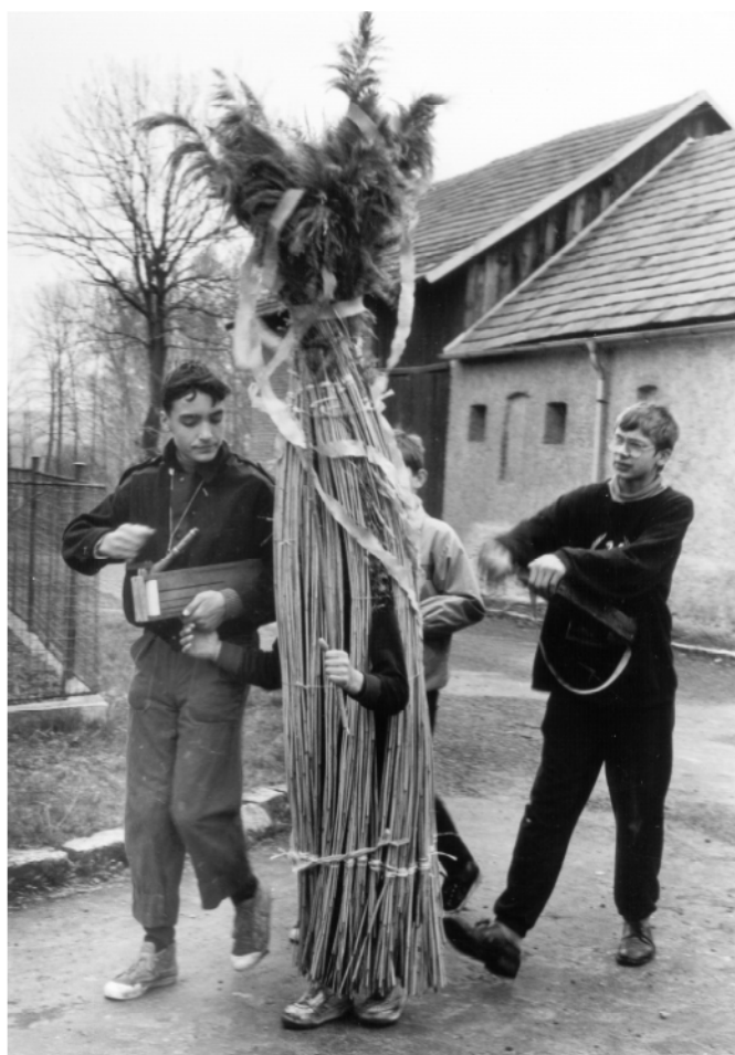
Mentour (okr. Chrudim), obchůzka s Jidášem na Bílou sobotu, 1994.