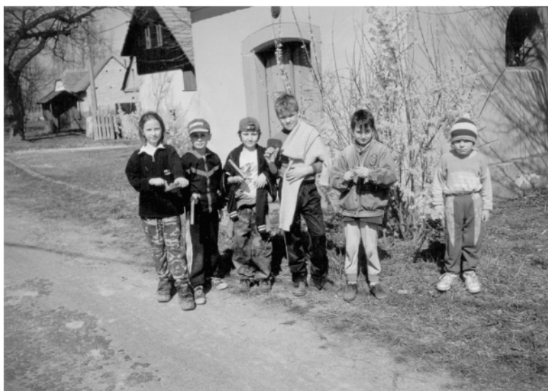
Mentour (okr. Chrudim), děti z Poděčel končí velkopáteční obchůzku u návěsí kaple, 2002.