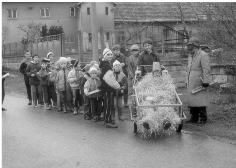
Zalažany (okr. Chrudim) děti z Jenišovic při obchůzce s Jidášem na Bílou sobotu, 1994.