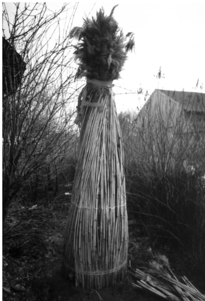
Městec (okr. Chrudim), kostým Jidáše na Bílou sobotu, 2005.