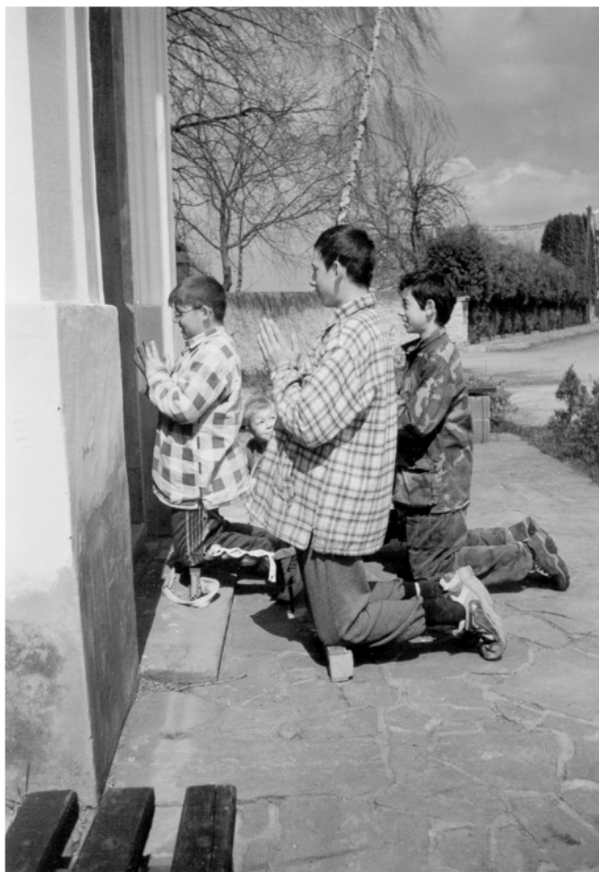
Brčekoly (okr. Chrudim), modlitba u návěsní kaple při obchůzce na Zelený čtvrtek, 2001.