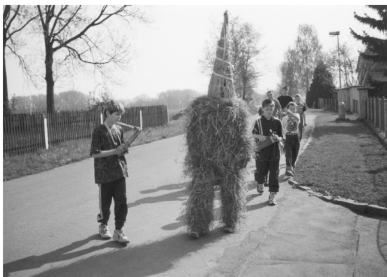
Lhota u Chroustovic (okr. Chrudim), obchůzka s Jidášem na Bílou sobotu, 2000.