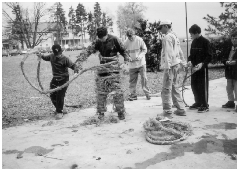
Ostrov (okr. Chrudim), odstrojování Jidáše po ukončení obchůzky na Bílou sobotu, 2003.