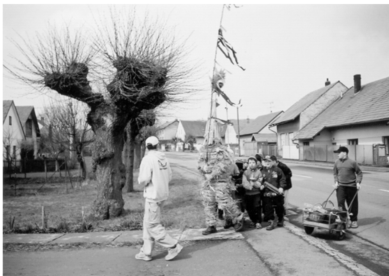
Ostrov (okr. Chrudim), obchůzka s Jidášem na Bílou sobotu, 2003.