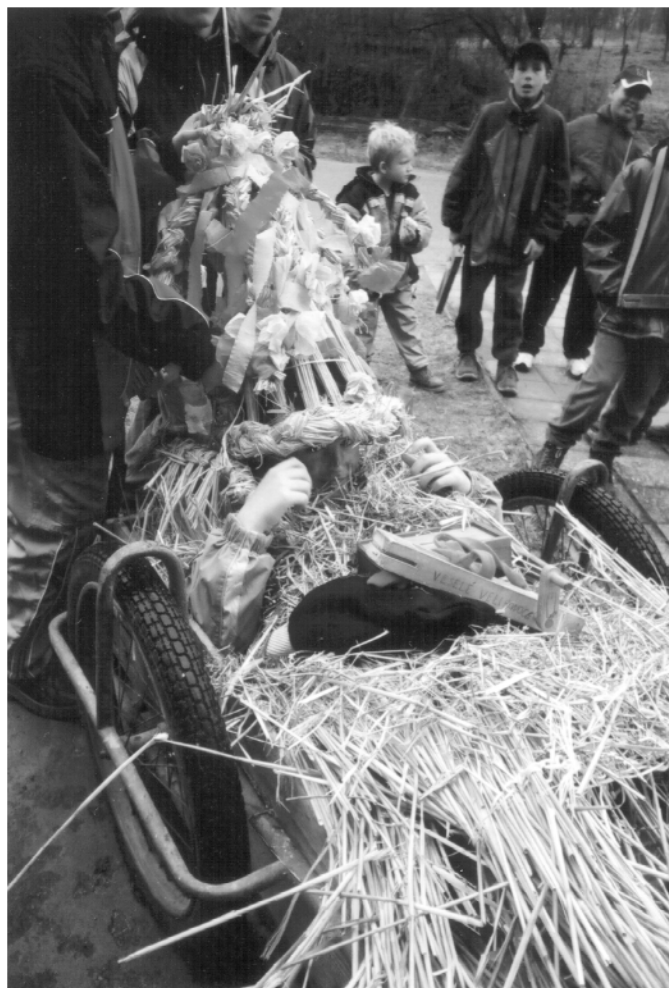
Jenišovice (okr. Chrudim), obchůzka s Jidášem na Bílou sobotu, 2005.