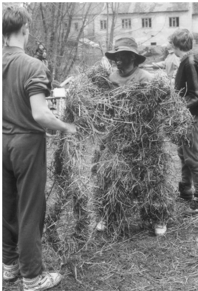
Chroustovice – Závodí (okr. Chrudim), strojení Jidáše do rulíků ze sena, Bílá sobota 1994.