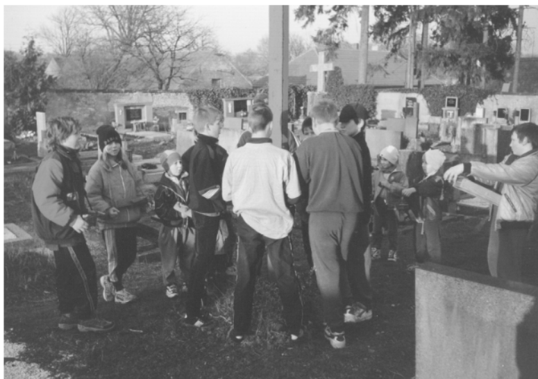
Trojovice (okr. Chrudim), zakončení obchůzky u hřbitovního kříže, Zelený čtvrtek 2002.