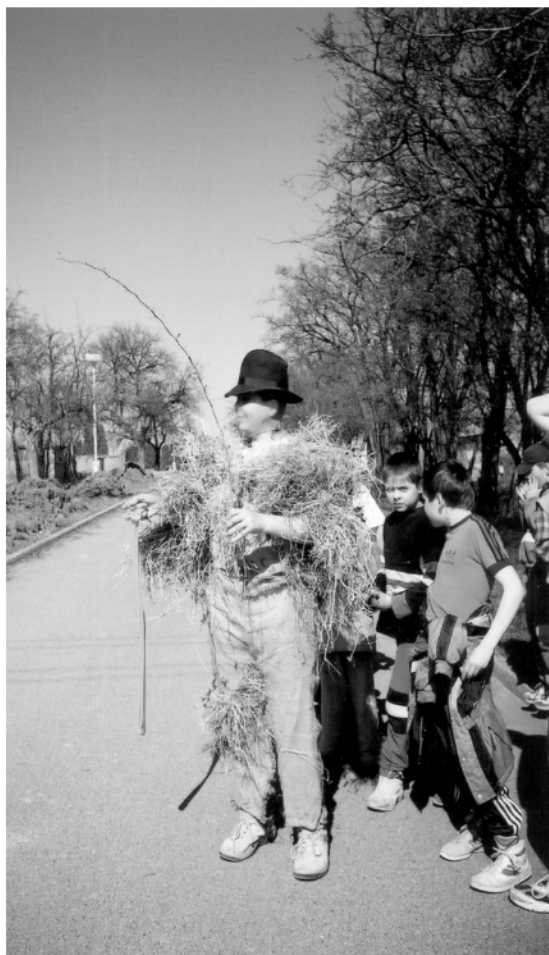
Chroustovice (okr. Chrudim), obchůzka s Jidášem na Bílou sobotu, 2002.