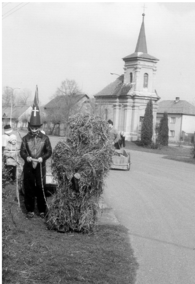
Turov (okr. Pardubice), obchůzka s Jidášem na Bílou sobotu, 1992.