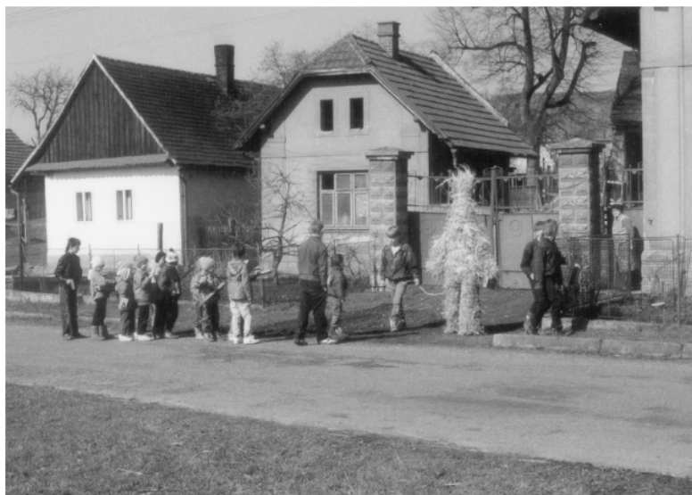
Týnišťko (okr. Pardubice), obchůzka s Jidášem na Bílou sobotu, 1993.