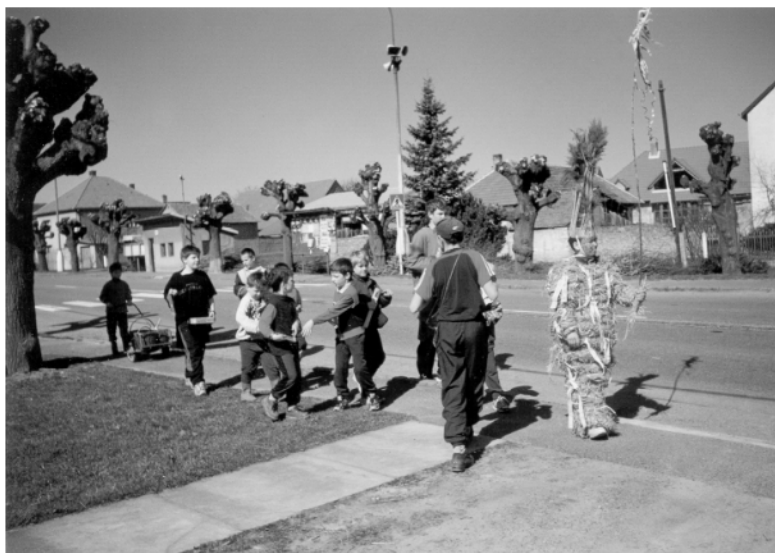
Ostrov (okr. Chrudim), obchůzka s Jidášem na Bílou sobotu, 2002.