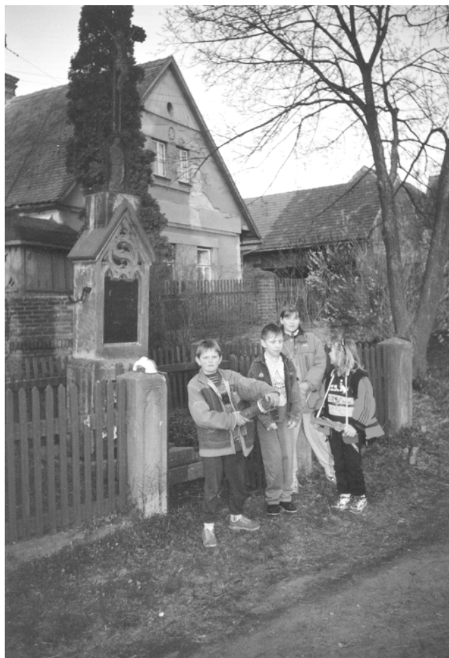
Synčany (okr. Chrudim), děti shromážděné u návesního kříže před obchůzkou na Zelený čtvrtek, 2002.