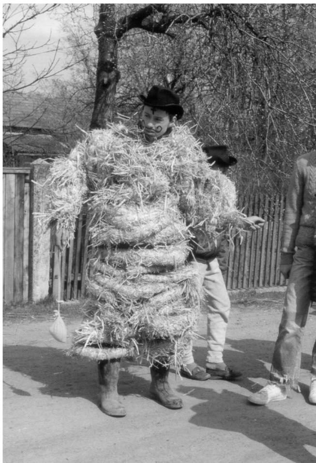
Litětiny (okr. Pardubice), Jidáš při obchůzce na Bílou sobotu, 1992.