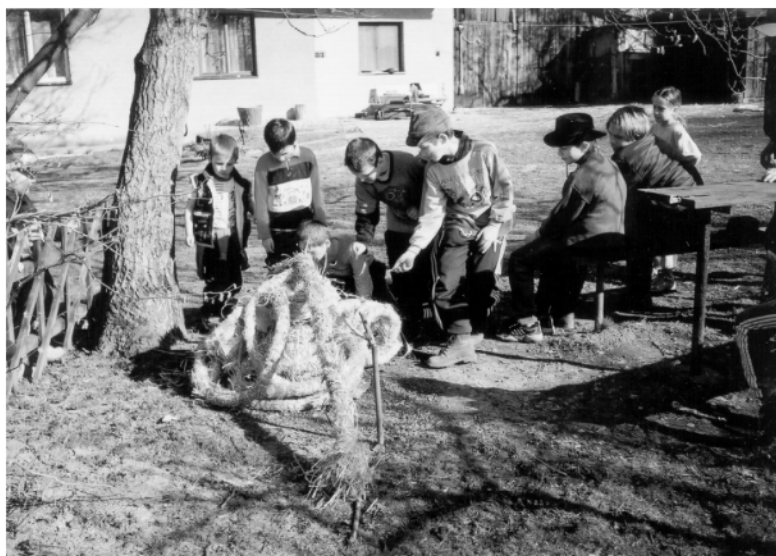
Litětiny (okr. Pardubice), zapalování rulíků z Jidáše po ukončení obchůzky na Bílou sobotu, 2002.