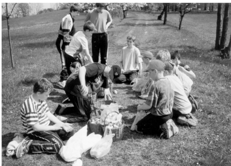
Stradouň (okr. Chrudim), rozdělování koledy po obchůzce na Bílou sobotu, 2000.