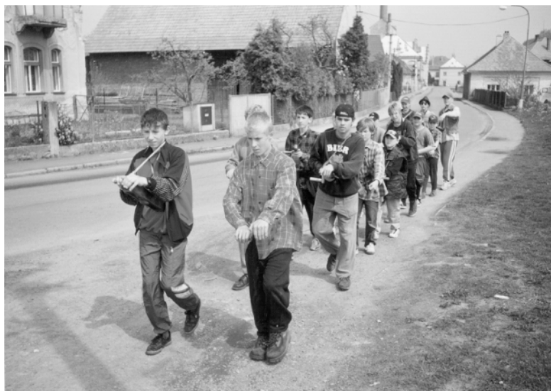
Rosice, severní část (okr. Chrudim), obchůzka na Zelený čtvrtek, 2000.