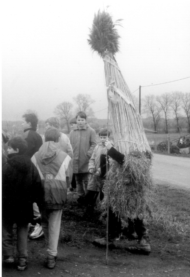
Chroustovice (okr. Chrudim), obchůzka s Jidášem na Bílou sobotu, 1994.