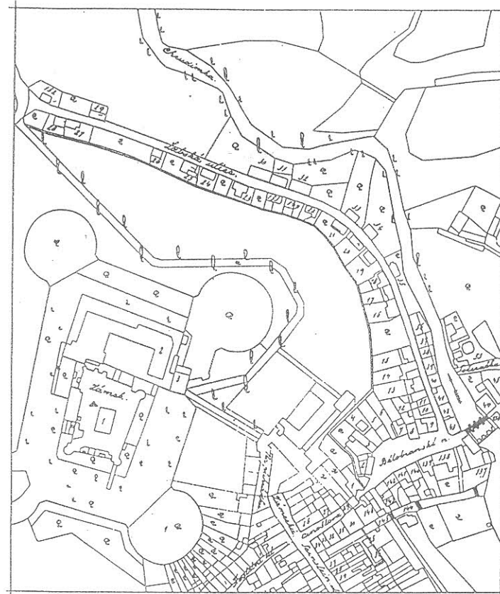
Předměstí Malé (Bílá) r. 1840.