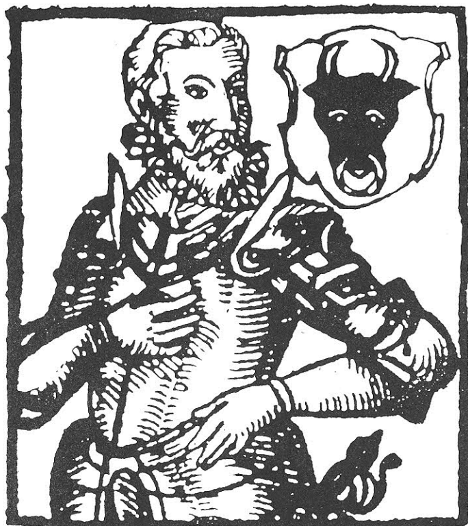
Jaroslav z Pernštejna (1528-1560) na dřevorytu z roku 1593