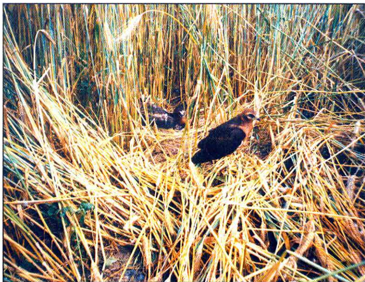
Obr. 6: Mláďata motáka lužního ( Circus pygargus ) na hnízdě u Černilova. Fig. 6: Montagu's Harrier young in the nest near Černilov village.