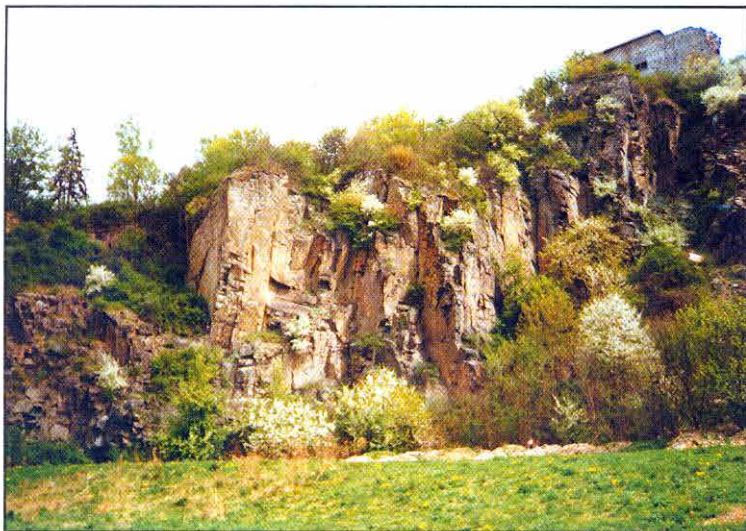
Obr. 5: Hnízdní biotop výra velkého ( Bubo bubo ) na Kunětické hoře. Fig. 5: Breeding habitat of the Eagle Owl ( Bubo bubo ) on Kunětická Mountain.