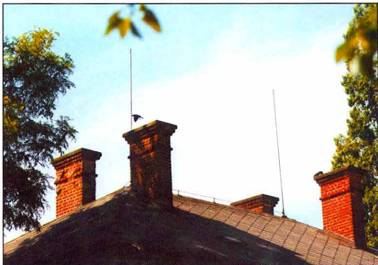
Obr. 3: Hnízdiště kavky obecné ( Corvus monedula ) na pardubickém lihovaru.

Fig. 3: A breeding place of the Jackdaw ( Corvus monedula ) on a distillery in Pardubice.