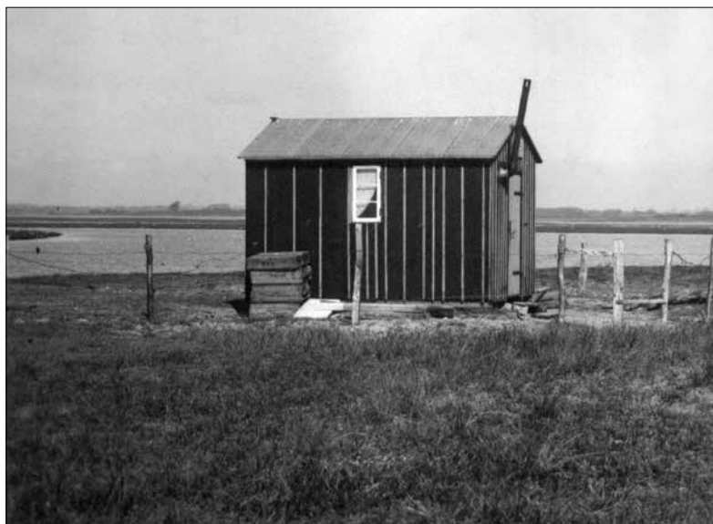
Obr. 2: Pohled na chatku i s mořským pobřežím v roce 1944.

Fig. 1: A view of the cottage and the fencing where Z. Klůz spent nearly three months, Oehe-Schleimünde, Germany, 1944.