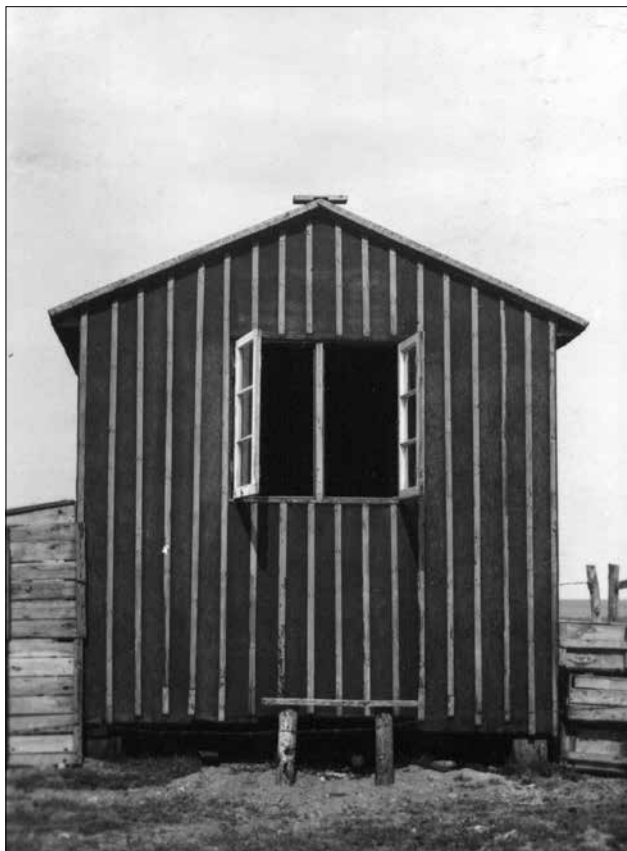
Obr. 3: Detailní pohled na chatku v roce 1944.

Fig. 3: A close-up view of the cottage, Oehe-Schleimünde, Germany, 1944.