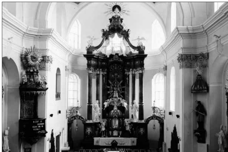
Obr. 2: Interiér chrámu Nanebevzetí Panny Marie v Jevíčku, pohled do presbytáře na hlavní oltář.