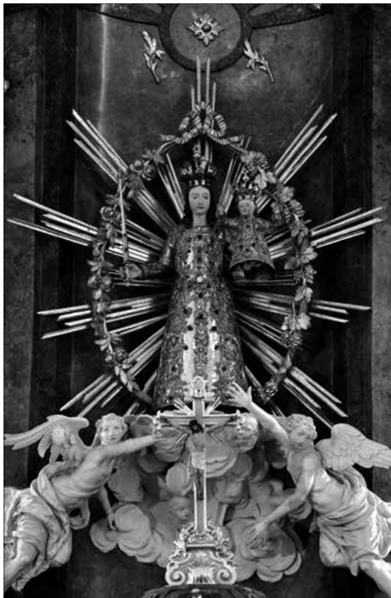
Obr. 1: Milostná socha Panny Marie v kostele Nanebevzetí Panny Marie v Jevíčku.