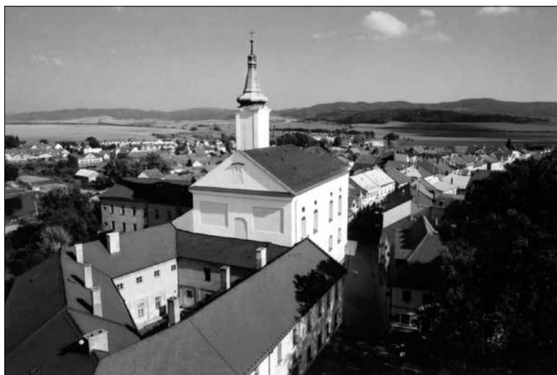
Obr. 7: Kostel Nanebevzetí Panny Marie v Jevíčku, pohled na vnější podobu kostela.

mezi širší veřejnost počítalo. Evidence záslibných destiček a zázračných příběhů mohla sloužit čistě k potřebám farní agendy, zároveň byla s to plnit propagační roli při šíření úcty k Panně Marii Jevíčské. Ačkoli se v Jevíčku nacházelo řeholní společenství, které by se zaznamenávání milostí bylo schopno věnovat systematicky, dle zjištěných informací tomu tak nebylo. Jevíčský soupis zázraků dle textů z votivních tabulek poutního kostela je jedním ze způsobů, jak bylo možné tyto jevy evidovat. Záznamy mají sice menší vypovídající hodnotu, jelikož jsou příliš stručné a povětšinou chudé na detaily z každodennosti příslušného votanta, stále však mohou poskytovat řadu dílčích zajímavých momentů ze života raně novověké společnosti napříč sociální stratifikací prosebníků. Ačkoli se v dnešní době na Jevíčko jako na poutní místo zapomnělo, zdobená zápisnice z poloviny 18. století je důkazem, jak velké oblibě se v dřívější době těšilo a jak důležitou roli hrála zdejší soška Panny Marie v duchovním životě místního obyvatelstva.