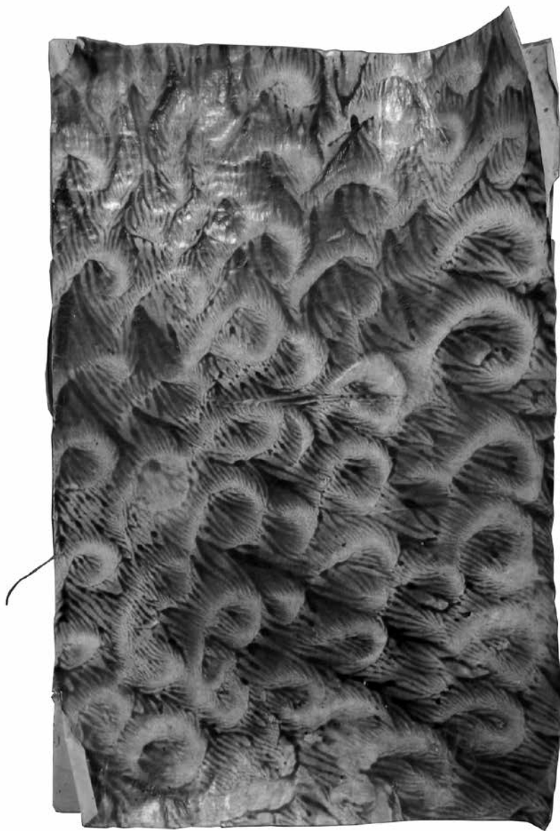
Obr. 3: Kniha zázraků z Jevíčka, batikový přebal sešitu (Terezie Vohralíková, 2014).