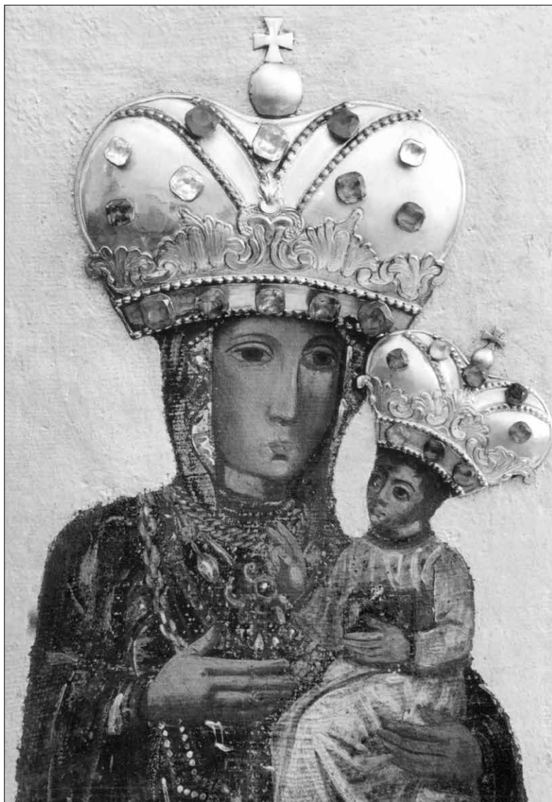
Přeloučský milosrdný obraz Panny Marie, jehož údajná uzdravující moc v době morové epidemie roku 1680 se stala podnětem ke zřízení tzv. „Svatopolské pouti“.