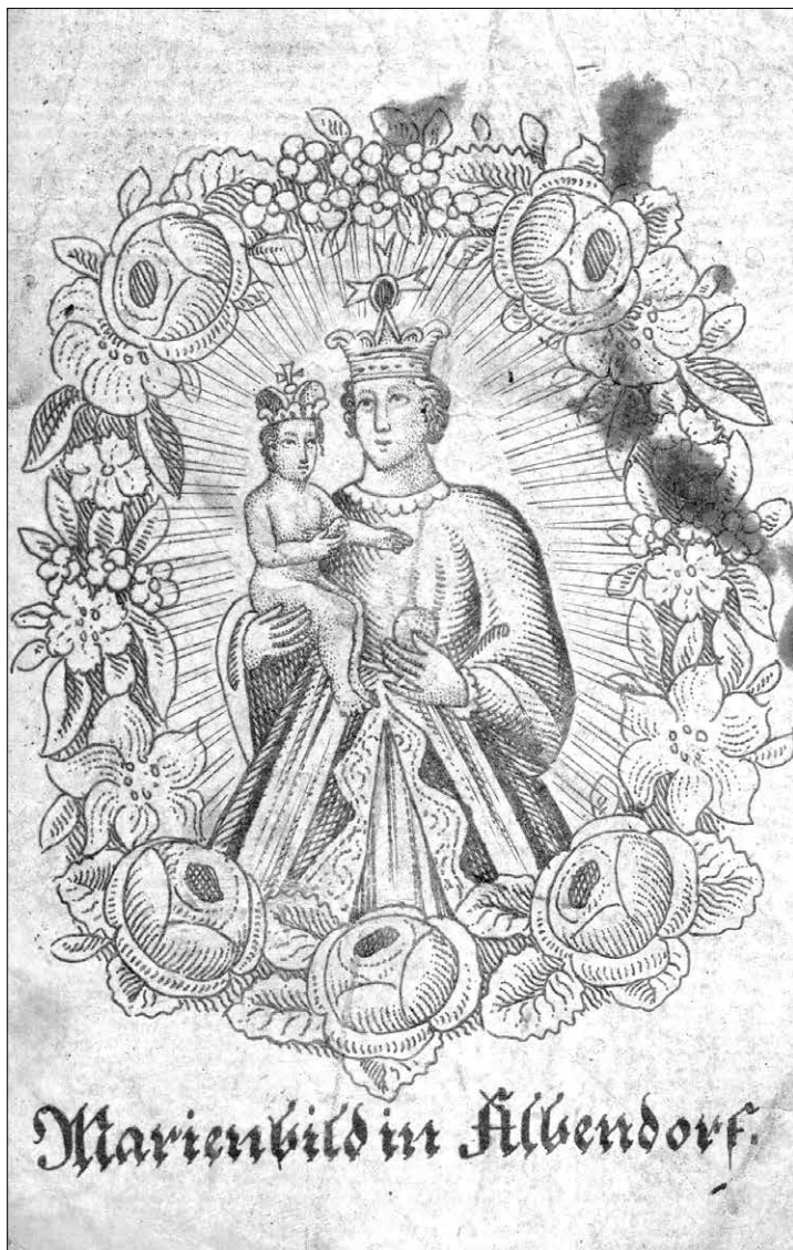
Svatý obrázek, Panna Maria Vambeřická, 1. polovina 19. století, Muzeum východních Čech v Hradci Králové.