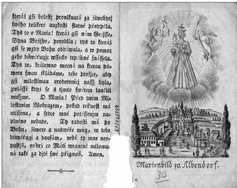
Modlitba k Panně Marii Vamberčické, 1. polovina 19. století, Muzeum východních Čech v Hradci Králové.