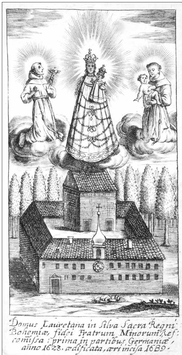
Obr. 2: První rytina zobrazující loretu v Hájku z knihy Jindřicha Labeho, Hájek svatý, milosti Boží... z roku 1690, Národní knihovna Praha, sign. NK 51 F 10, fol. 1r.