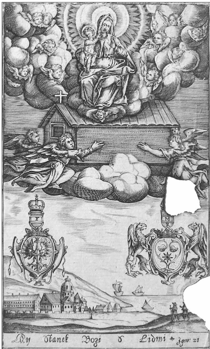
Obr. 1: Jednolist vydaný u příležitosti založení lorety v Hájku. NA Praha, fond Sbírka genealogicko-heraldická Wunschwitzova, složka Žďárský ze Žďáru, i. č. 1421.