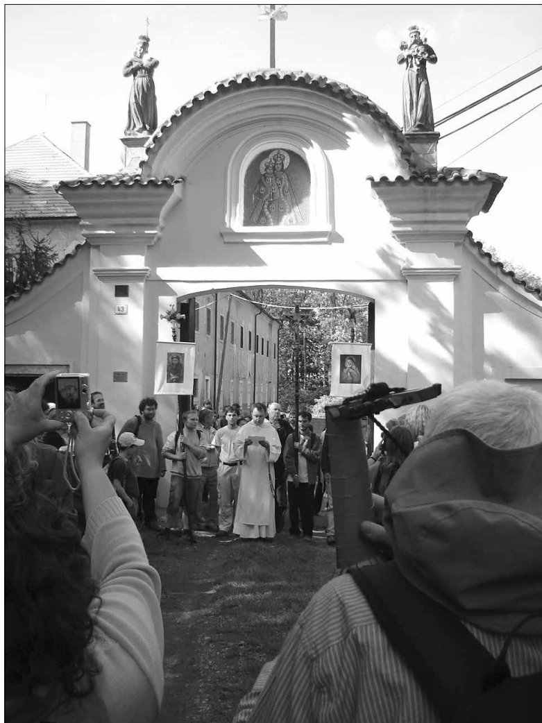
Obr. 5: Vítání účastníků Barokní pouti do Hájků před branou kláštera v květnu roku 2009.

že potřeba slavností a duchovních obřadů přetrvává a člověka ovlivňuje i v době dnešní (obr. 5).