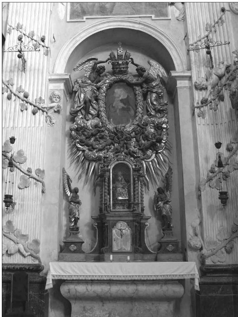
Oltář Blahoslavené Panny Marie Pomocné v choltické zámecké kapli (foto autor).