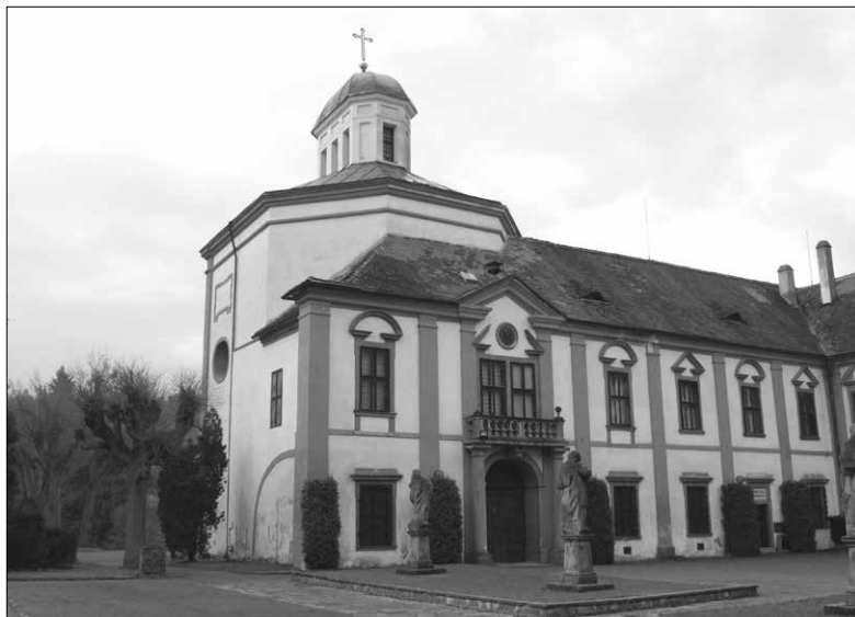
Zámecká kaple sv. Romedia v Cholticích.