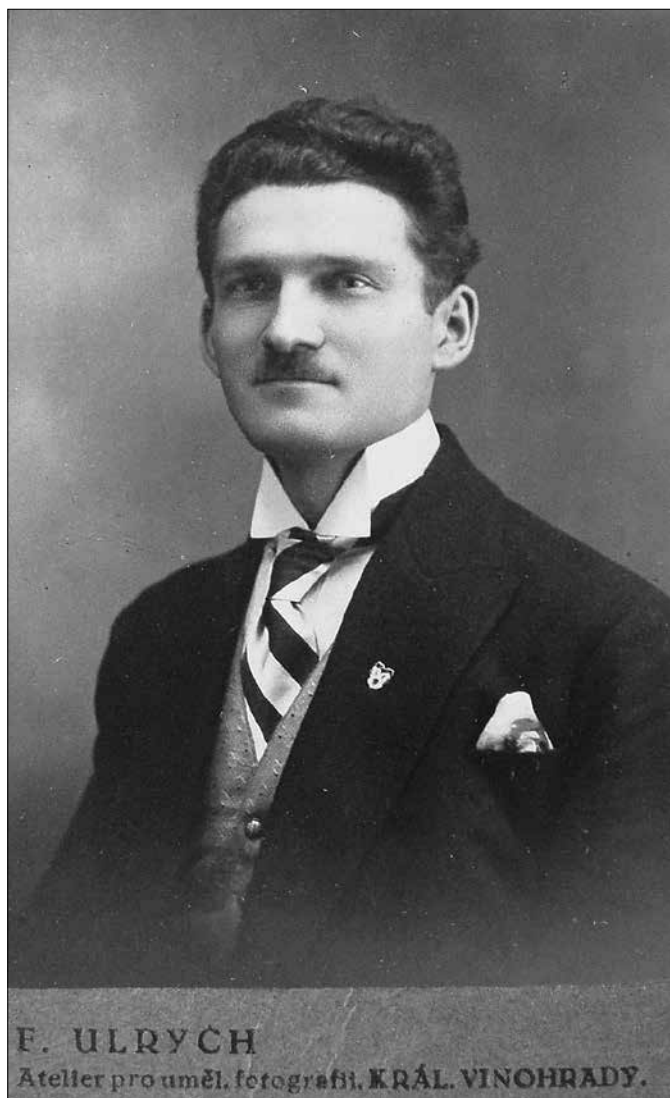
Obr. 6: Antonín Knížek (portrét), 1921.