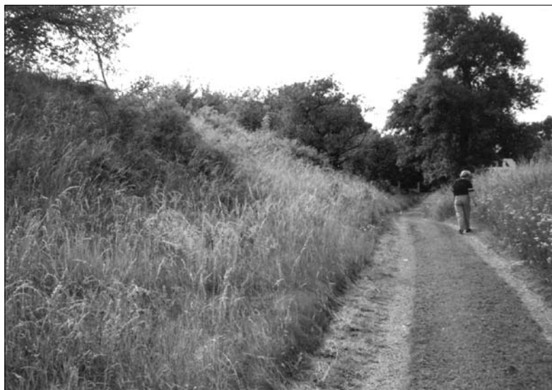
Chlum (Chloumek) u Mladé Boleslavě. Příkop na severozápadní straně, vnější stěna valu. Současný stav.