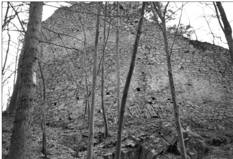
Hrad Strádov. Torso pláštěové zdi na severovýchodní vnější straně hradního jádra. Současný stav.