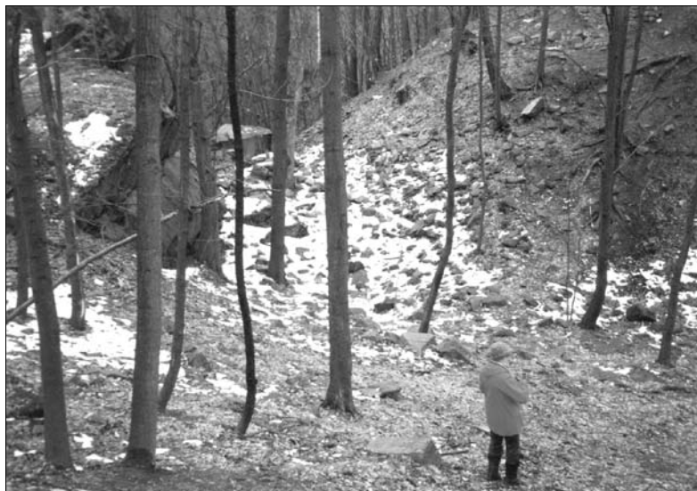
Hrad Strádov. Příkop před hradním jádrem. Současný stav.