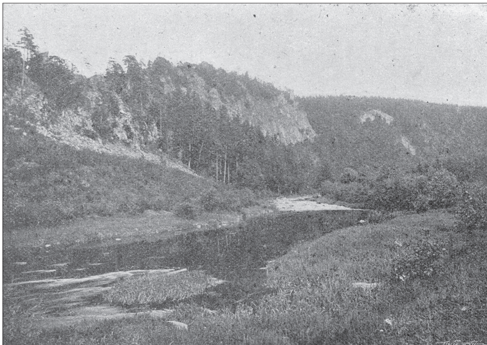
Hora Oheb. Pohled k jihozápadu cca 1910–1924, stav před stavbou přehrady Seč. Jan Zítek, Chrudim a Chrudimsko, 1925.