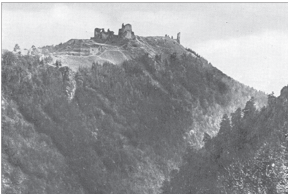
Hrad Lichnice. Stav v první třetině dvacátého století.