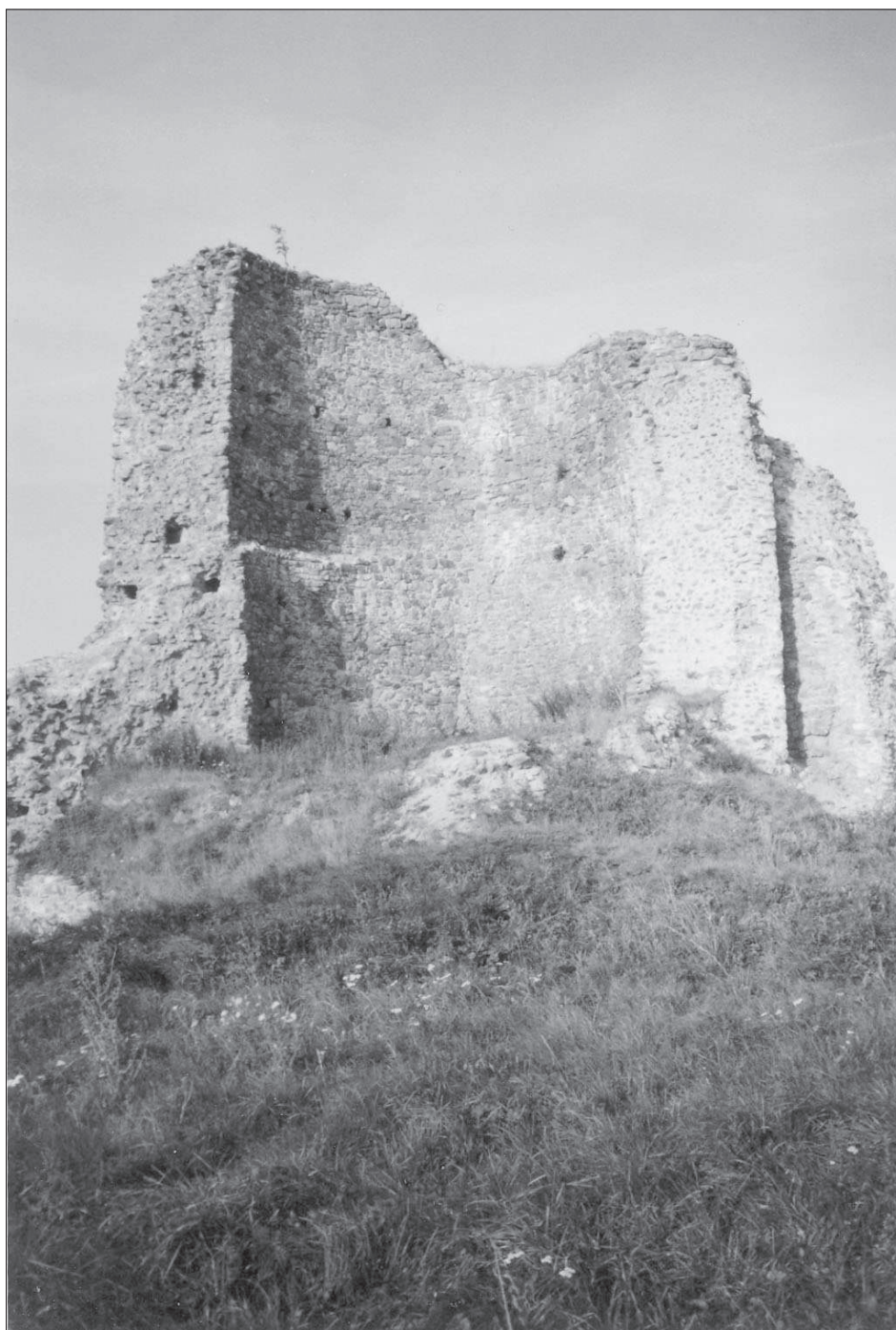
Hrad Lichtenburg čili Lichnice. Pohled k severoseverovýchodu (2005). Zbytek velké věže.