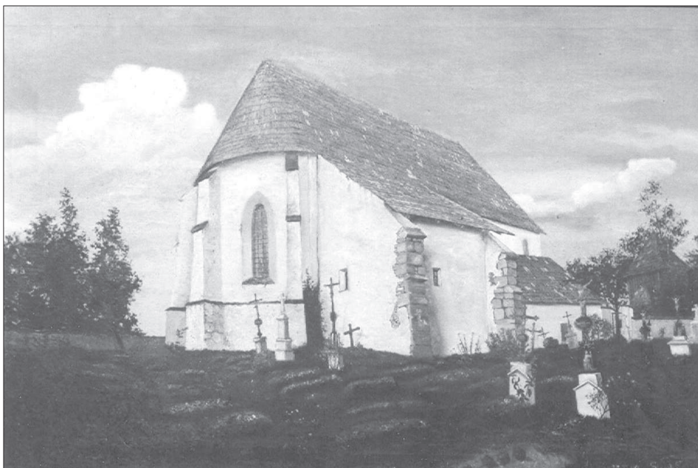
Kostel sv. Petra a Pavla, Kostelec u Heřmanova Městce. Opevněný kostel. Pohled k jihozápadu. Rekonstrukce podoby kostela před puristickou regotisací 1898.