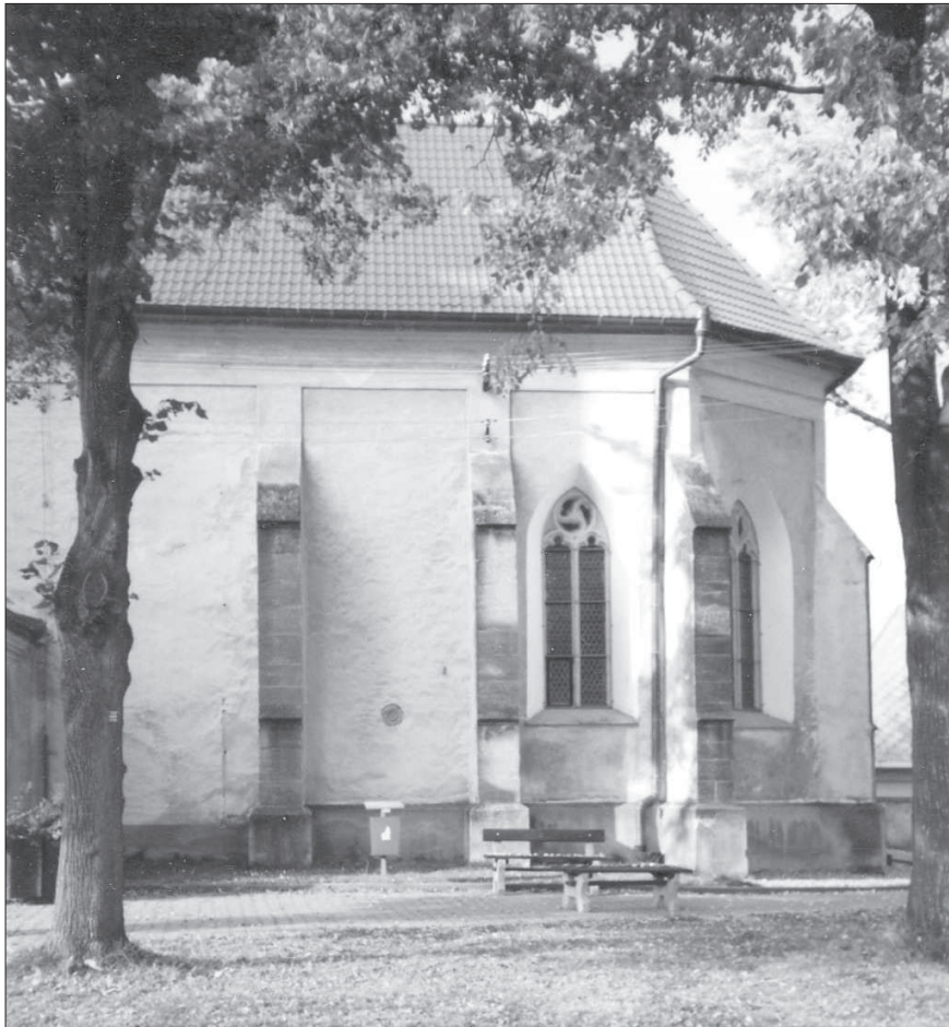
Kostel sv. Michaela archanděla, Licibořice. Pohled k severu na presbyterium. Stav 1996.