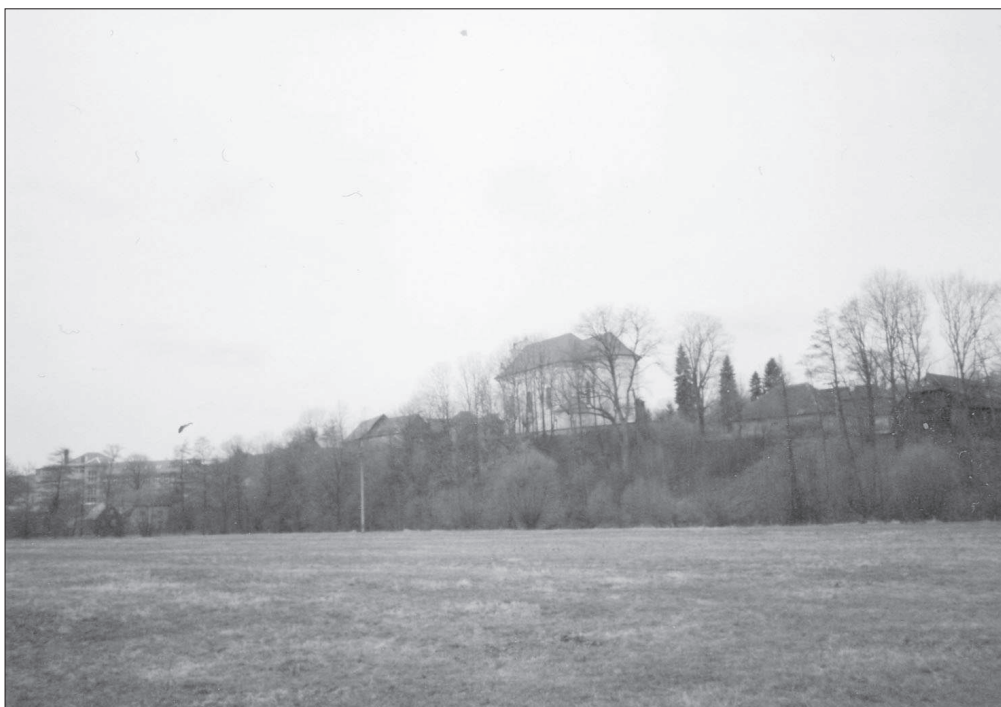
Bojanov. Pohled k severoseverozápadu (1998). Kostel sv. Víta v poloze nad řekou, pod ním v lužním porostu stromového a křovinového patra řeka Chrudimka.