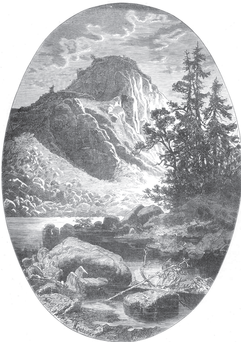
Hrad Vildštejn. Pohled k východu cca 1880 po proudu řeky Chrudimky přes cíp šíje zvané Malá Ohebka půl století před stavbou přehrady Seč. Na kresbě hrad Vildštejn již nemá věž, protože byla ve čtyřicátých letech 19. století zbořena, takže z hradního jádra zůstala pouze vnější ohradní zeď. Kresba Karla Liebschera. August Sedláček, Hrady, zámky a tvrze království Českého I, Praha 1882.