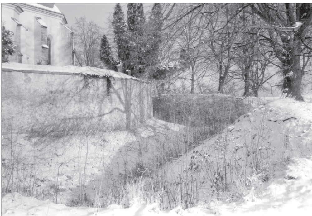
Kostel sv. Petra a Pavla, Kostelec u Heřmanova Městce. Opevněný kostel. Pohled k východu. Vnitřní příkop a val na jižní straně kostela. Stav 1996.