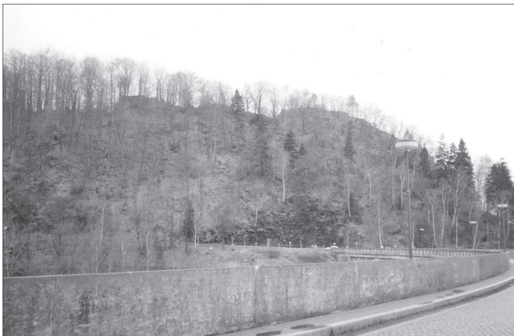
Hora Oheb. Pohled k jihozápadu (2004) podél hráze přehrady Seč.