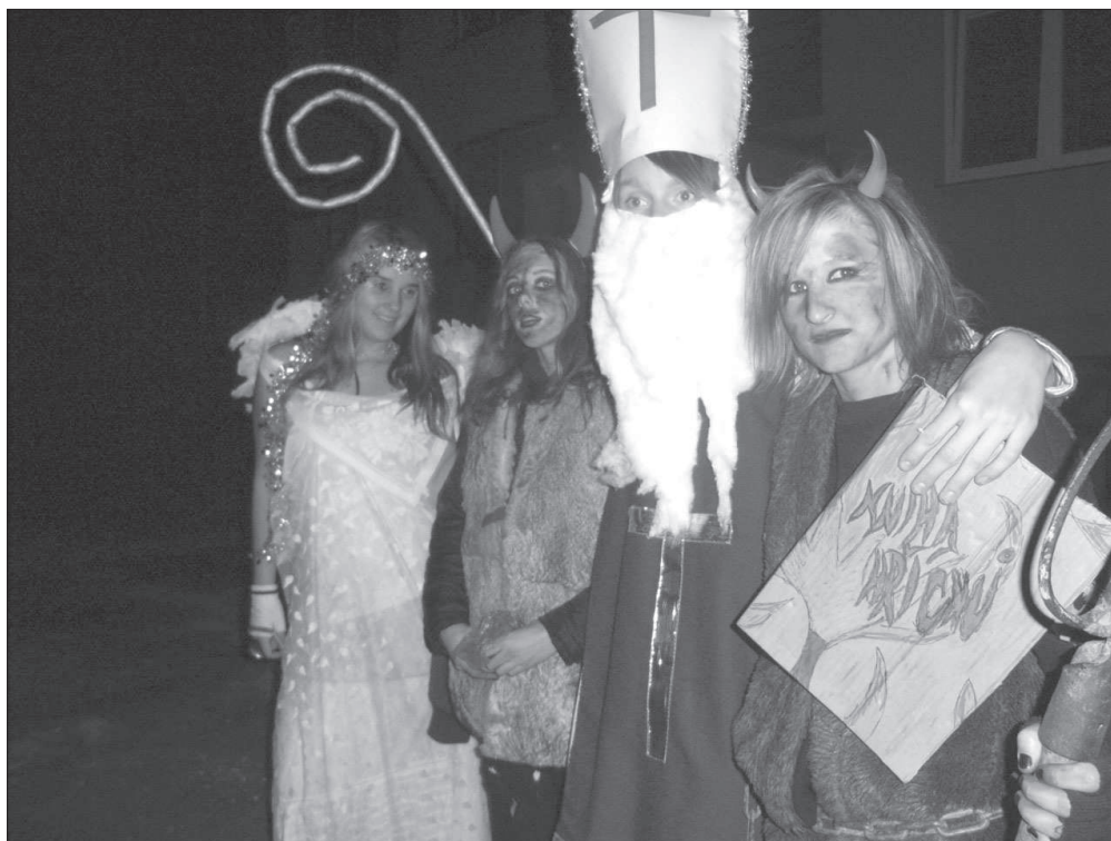
Mikulášská skupina při obchůzce ve Slatiňanech (okr. Chrudim), r. 2007