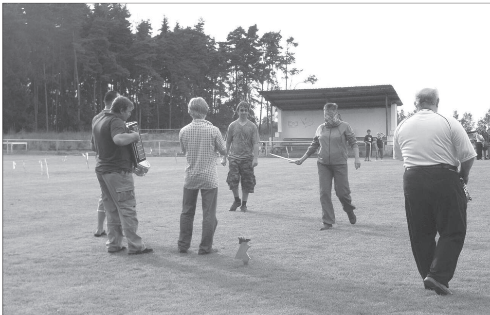
Soutěžící a hudba při akci „ Staročeské stínání kohouta “ v Načešicích (okr. Chrudim), r. 2008.