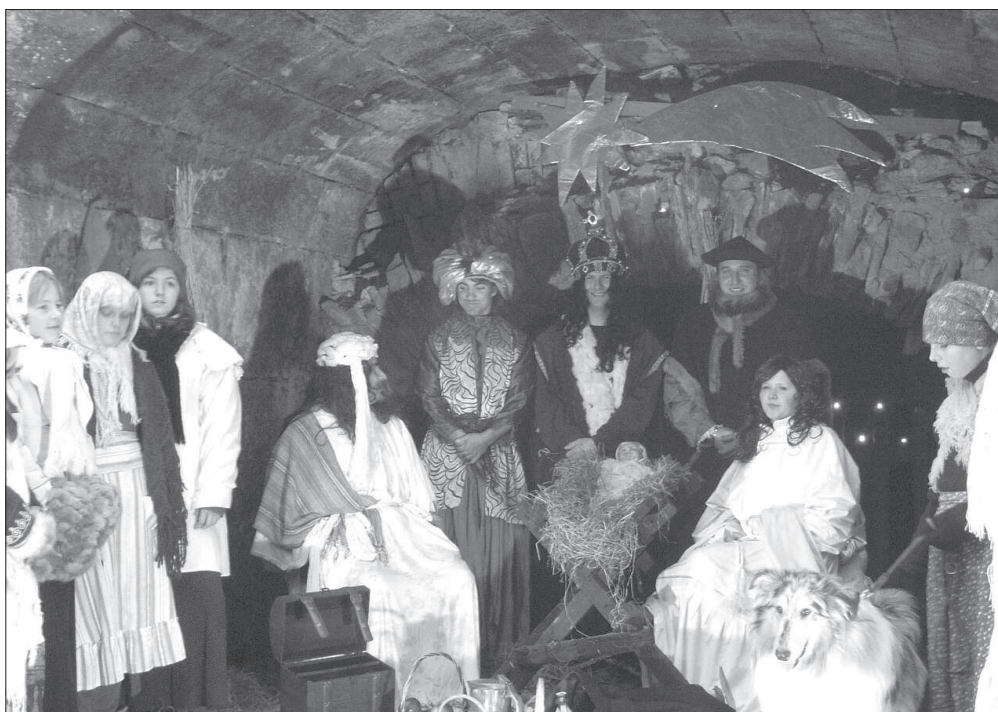
Živý betlém při akci „Klanění tři králů“ v Cholticích (okr. Pardubice), r. 2007