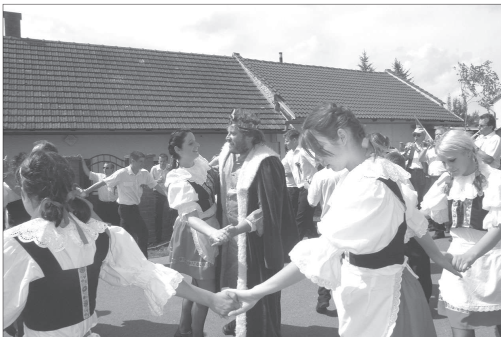
Představitel krále tančí s mládeží při obchůzce obcí při „ Staročeských májích “ v Konárovicích (okr. Kolín), r. 2009.