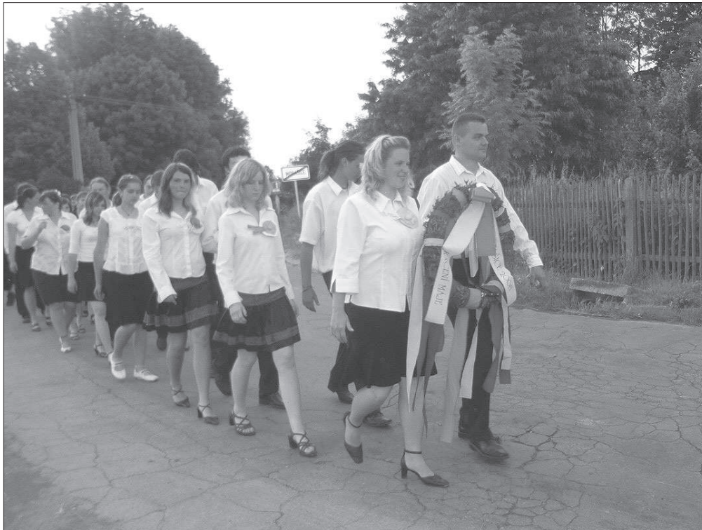
Průvod mládenců a děvčat s věncem, pod kterým budou tančit v hostinci při zábavě v rámci slavnosti „Kácení máje“ v Morašicích (okr. Chrudim), r. 2007.