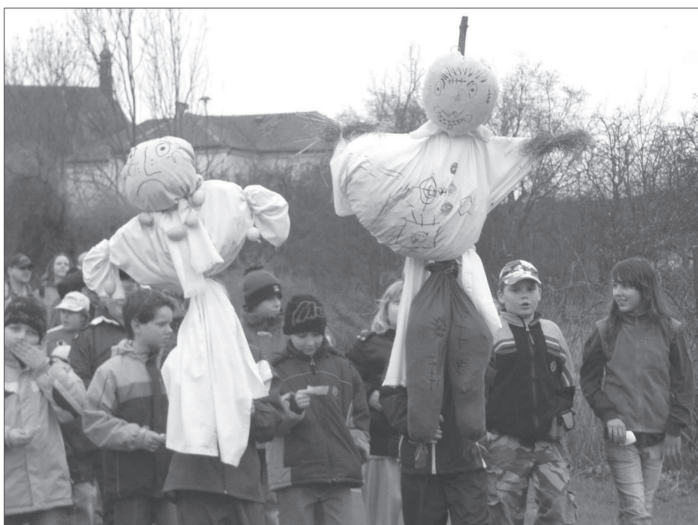
Průvod s Moranou a Smrtákem při akci „Vynášení Zimy ze vsi“ v Žehušicích (okr. Kutná Hora), r. 2009.