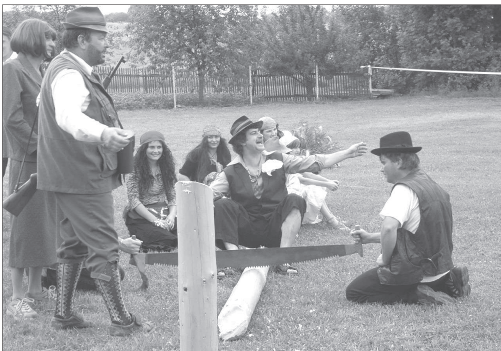
Dražba poražené máje při slavnosti „ Kácení máje “ v Morašicích (okr. Chrudim), r. 2007.