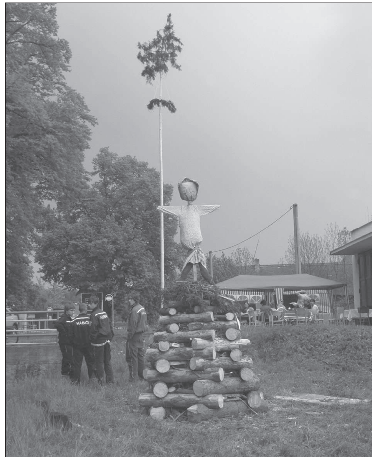
Obecní máj a hranice s figurínou čarodějnice , připravená k zapálení v Lipolticích (okr. Pardubice), r. 2009.