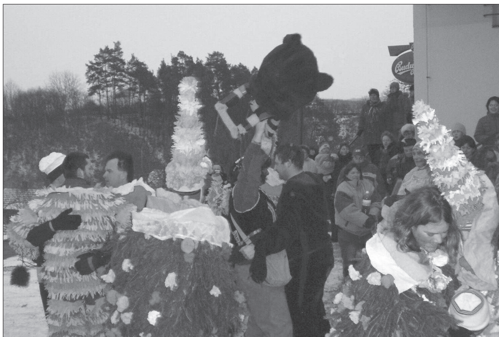
Symbolicky oživený medvěd tančí v závěru obchůzky maškar uprostřed ostatních, zatímco jeho vodič ( cikán ), zvedá hlavu medvědí masky do výše. V popředí chvojáci . Okřesaneč (okr. Kutná Hora), r. 2009.