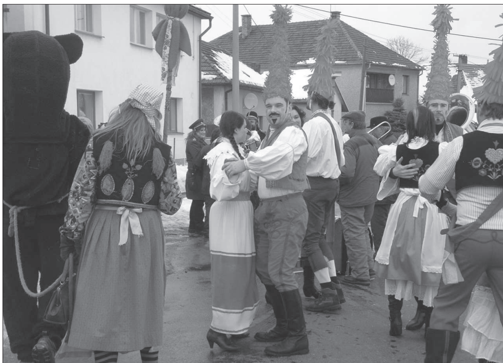
Tanec masek typu obřadníků ( tanečnicků a tanečnic ) před domem při obchůzce maškar v Hostovicích (okr. Kutná Hora), r. 2010.