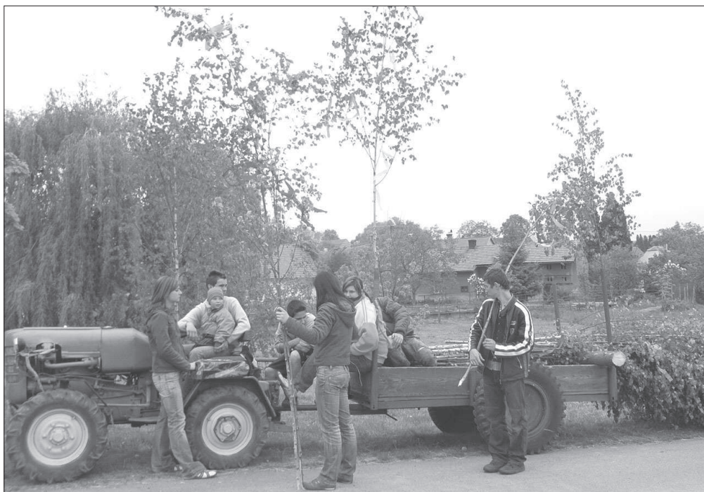
„ Stavění májů “ místní mládeží v Bukovině u Přelouče (okr. Pardubice), r. 2007.