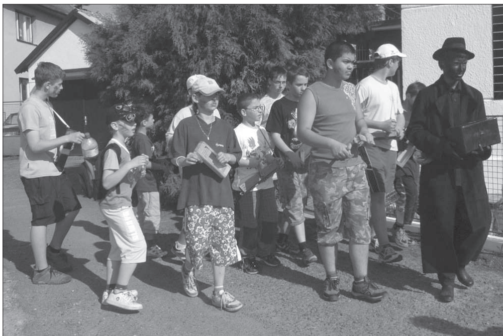
Obchůzka s Jidášem v černě pojatém maskování na Bílou sobotu v Řestokách (okr. Chrudim), r. 2009.