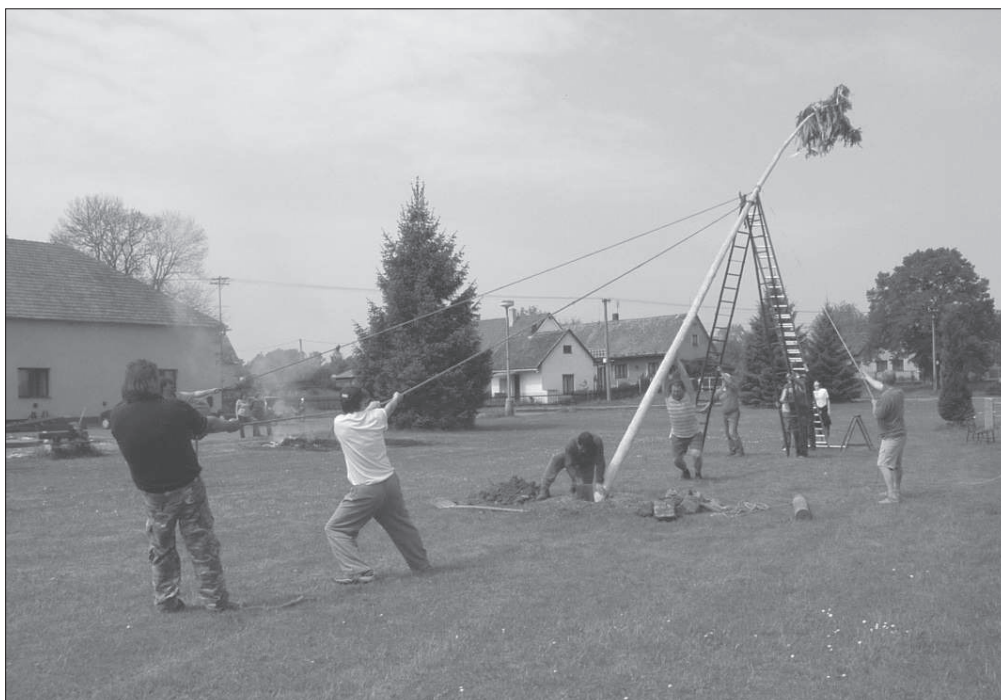
Stavění obecní máje na návsi v Urbanicích (okr. Pardubice), r. 2009.