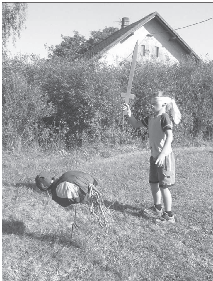
Stínání kohouta v rámci „Loučení s prázdninami“ ve Stojících (okr. Pardubice), r. 2009