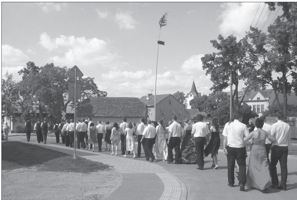
Průvod mládeže při obchůzkové slavnosti „ Staročeské máje “ ve Vraclavi (okr. Ústí nad Orlicí), r. 2009.