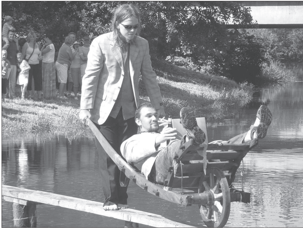
Účastníci disciplíny „ jízda na trakaři “, jejíž komično vezený podtrhuje cigaretou, otevřenou lahví piva a psaním na notebooku, při akci „ Sezemická pouťová lávka “ v Sezemících (okr. Pardubice), r. 2009.