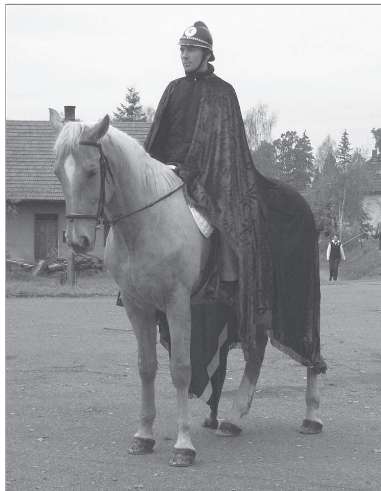
Představitel sv. Martina při akci „Vítání svatého Martina“ v Lukavici (okr. Chrudim), r. 2009.