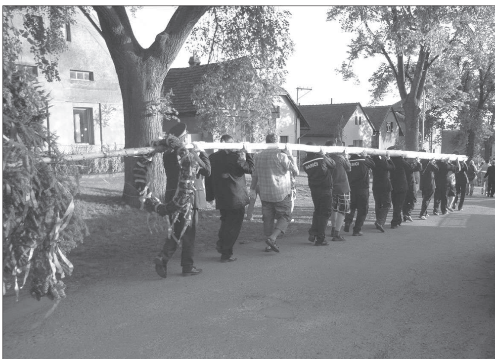
Muži přinášejí máj , aby ji postavili u hostince, v závěru „ Stavění májů “ v Semtěši (okr. Kutná Hora), r. 2009.