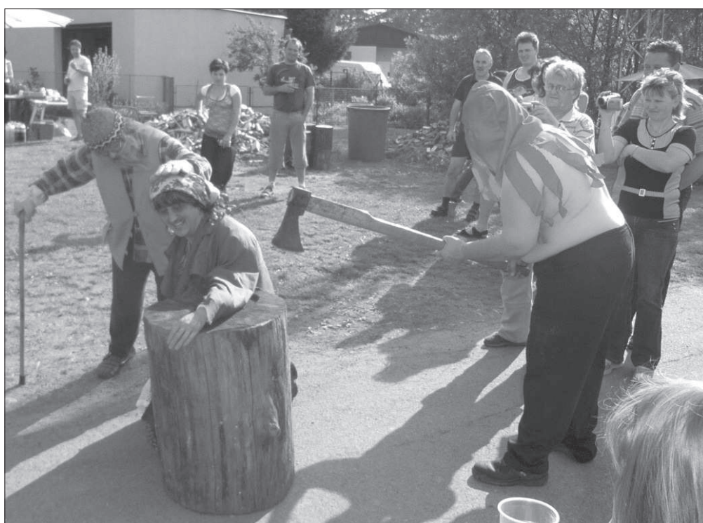
Výkon trestu utěti ruky (atrapy paže) bábě (utěšované dědkem ) za účast na pokácení máje při slavnosti „ Kácení máje “ v Bukovině u Přelouče (okr. Pardubice), r. 2009.