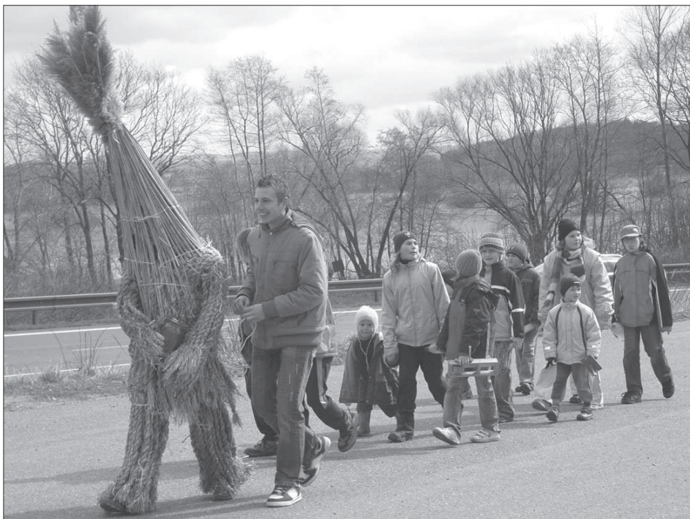
Obchůzka s Jidášem v masce z rostlinného materiálu na Bílou sobotu v Týnišťku (okr. Ústí nad Orlicí), r. 2008.