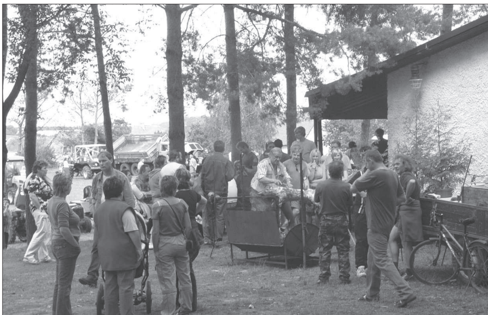
Grilování prasete při akci „Spanilá jízda traktorů a domovin“ v Jankovicích (okr. Pardubice), r. 2007.