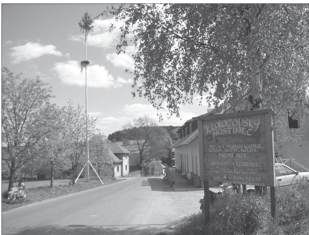
Obecní máj u hostince v Klokočově (okr. Havlíčkův Brod), r. 2007.