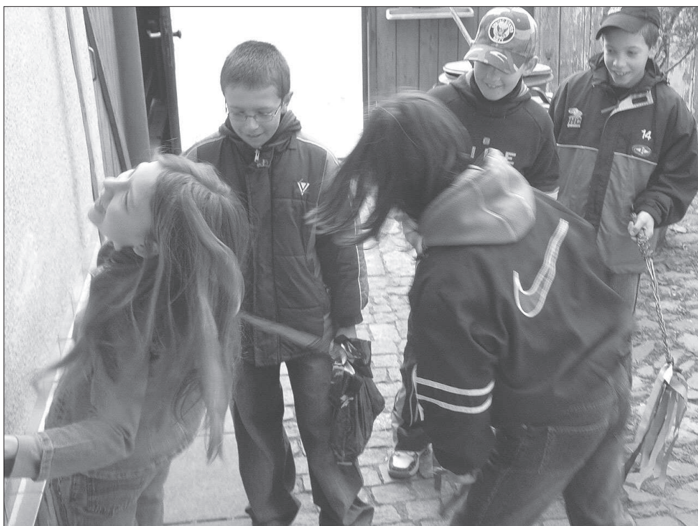
Koledníci při obchůzce na Velikonoční pondělí ve Slatiňanech (okr. Chrudim), r. 2007.