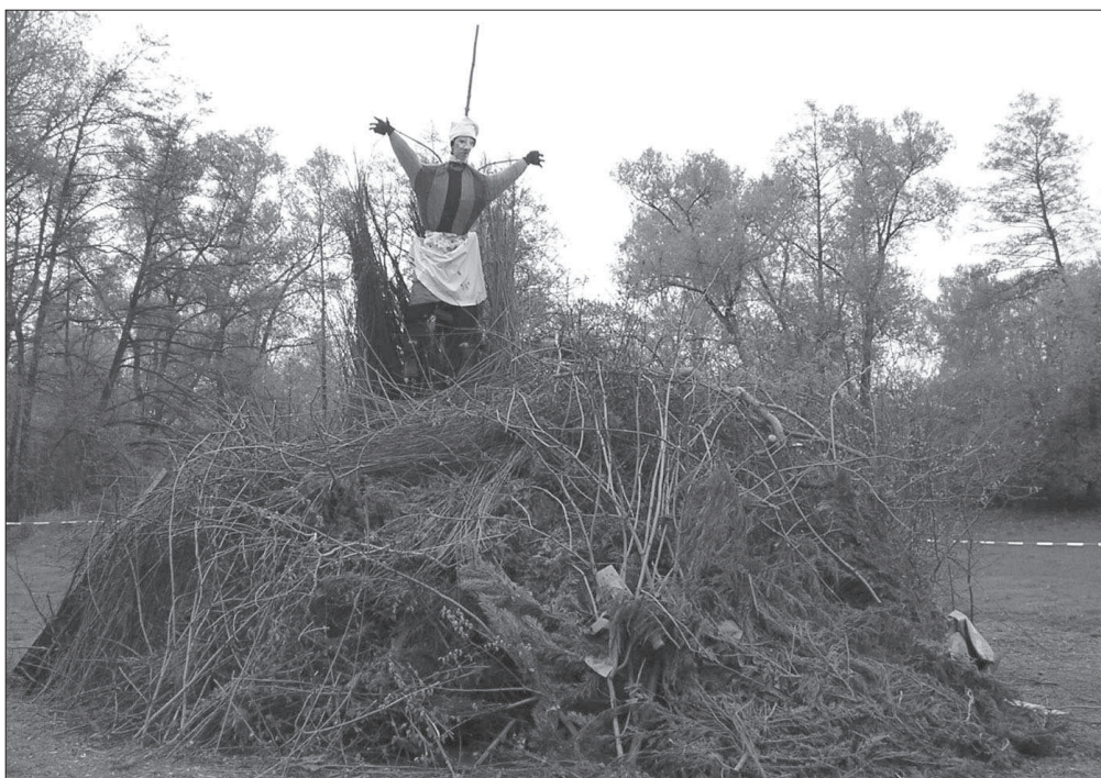
Hranice s figurínou čarodějnice ve Valech (okr. Pardubice) před zapálením, r. 2006.