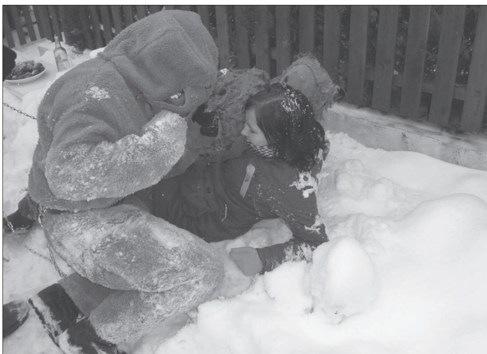
Dívka stržená do sněhu maskami medvěda a opice při obchůzce maškar v Míčově (okr. Chrudim), r. 2009.