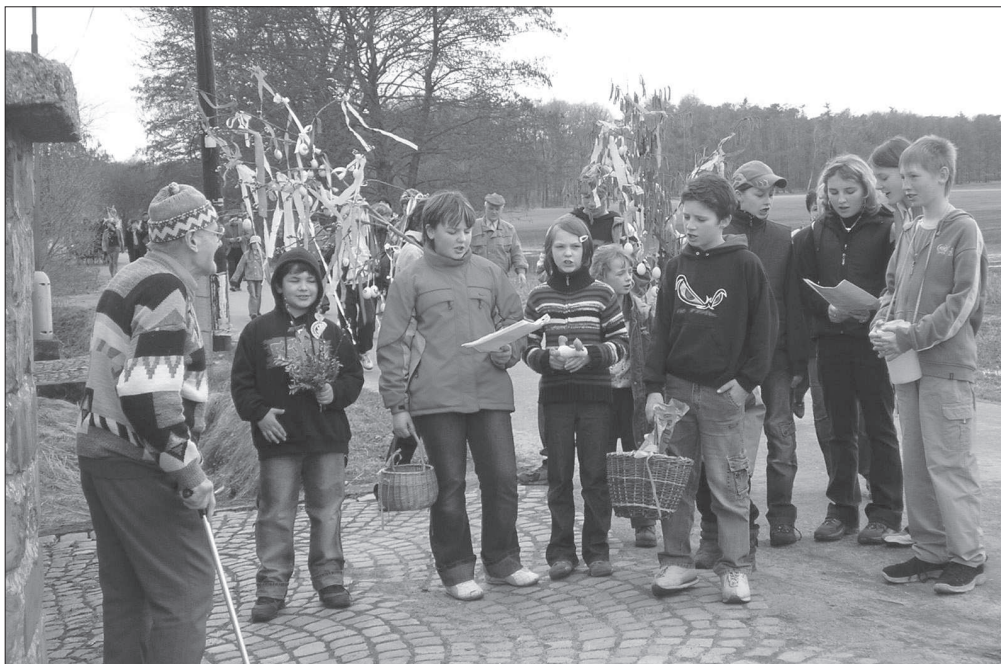
Obchůzka s lity po domech při akci „ Přinášení lity, odnášení smrti “ v Neratově (okr. Pardubice), r. 2006.