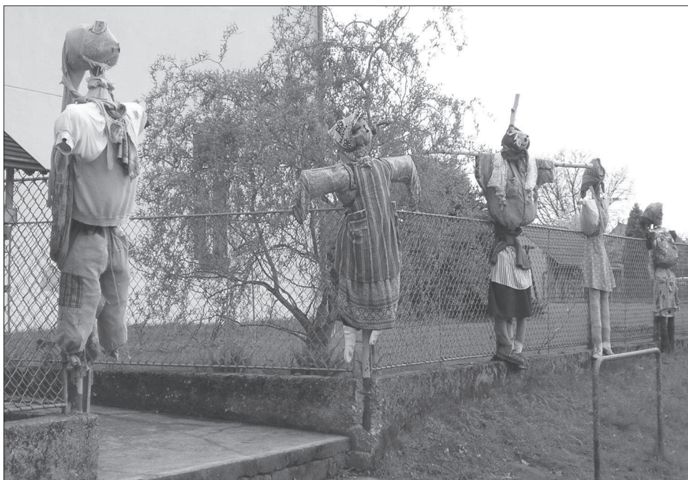
Figuríny čarodějnic , vystavené na plotech domů, ve kterých byly připraveny, je vidět již jen vzácně. Tyto zhotovili žáci Základní školy v Semíně (okr. Pardubice), r. 2006.