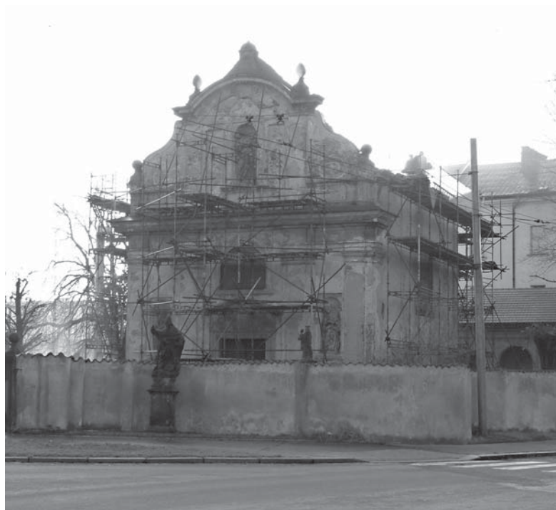
Kostel Sedmibolestné Panny Marie na Bílém předměstí v Pardubicích. Stav v době rekonstrukce dne 13. listopadu 2002.

Zjištěný písemný i hmotný materiál dokládá jednak samotné stavební úpravy střechy kostela Sedmibolestné Panny Marie, jednak přináší i zajímavý autentický materiál, dokumentující historický vývoj celého města. Z dochovaných písemností vyplývá, že záznamy byly v různém rozsahu doplňovány do schránky, 2) umístěné v krovu kostelní věžičky, celkem pětkrát, a to v letech 1710, 1766, 1837, 1863 a 1926.