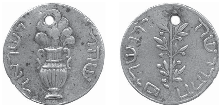
Litý cínový jetton z přelomu 18. a 19. století, tzv. „šekelová medailka“. Jednalo se o napodobení stříbrného šekelu z první třetiny 1. století n.l., tedy platidlo, které měl podle bible Jidáš přijmout za zradu Krista („třicet stříbrných“). Tyto předměty se vyráběly jako komerční zboží a distribuovaly se v rámci stánkového prodeje na poutních místech (zvětšeno, skutečný průměr 30,8 mm; dodatečně proražený otvor). Na lící straně byla tradičně zobrazována větev vavřínu (starozákonní „Áronův keř“), opis v hebrejštině měl znamenat „Svatý Jeruzalém“. Na rubové straně je ztvárněná kouřící obětní nádoba (obvykle kalich, v tomto případě má však tvar empírové vázy), opis v hebrejštině měl znamenat „izraelský šekel“. Dar Františka Marholda (viz níže v soupisu č. 47).