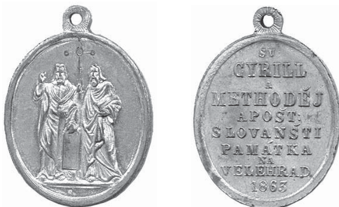
Morava, Velehrad, svátostka s upomínkou na moravské věrozvěsty Cyrila a Metoděje z roku 1863 (zvětšeno, skutečný rozměr 21,2 x 28,7 mm).