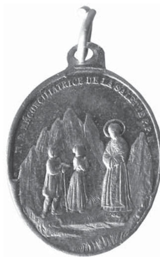
Francie, Salette, bronzová svátostka z mariánského poutního místa; nedatováno, raženo po roce 1852 (zvětšeno, skutečná velikost 14,8 x 20,5 mm). Dárce nelze identifikovat (viz níže v soupisu č. 155).