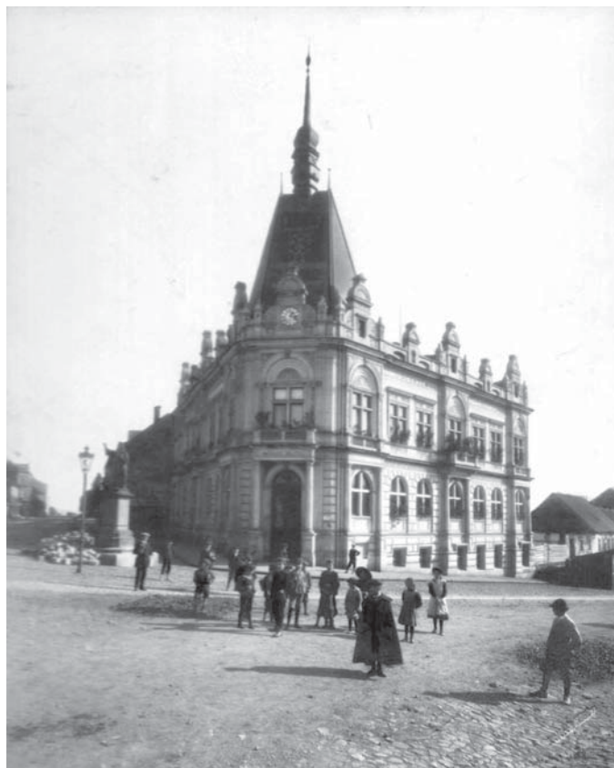
Obr. 1 – Občanská záložna, kolem roku 1930, archiv OMaG Jičín