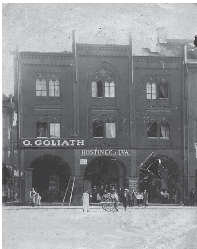
Obr. 6 – Hostinec U Lva na dnešním Valdštejnově náměstí, archiv OMaG Jičín.