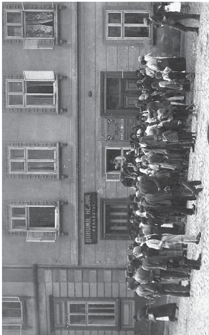
Obr. 5 – Fronta na chléb před domem pekaře Hejny roku 1917