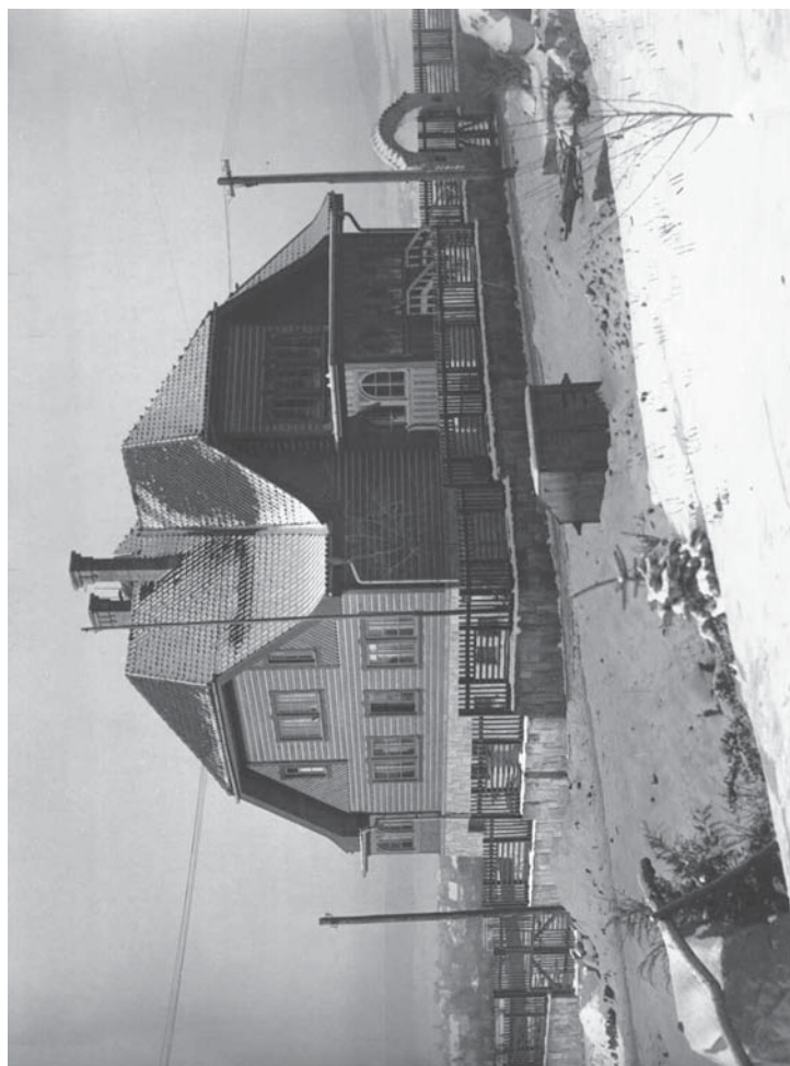
Obr. 7 – Dům architekta Františka Šikoly pod Čerovkou, foto Jiří Trejbal, 1943, archiv OMaG Jičín