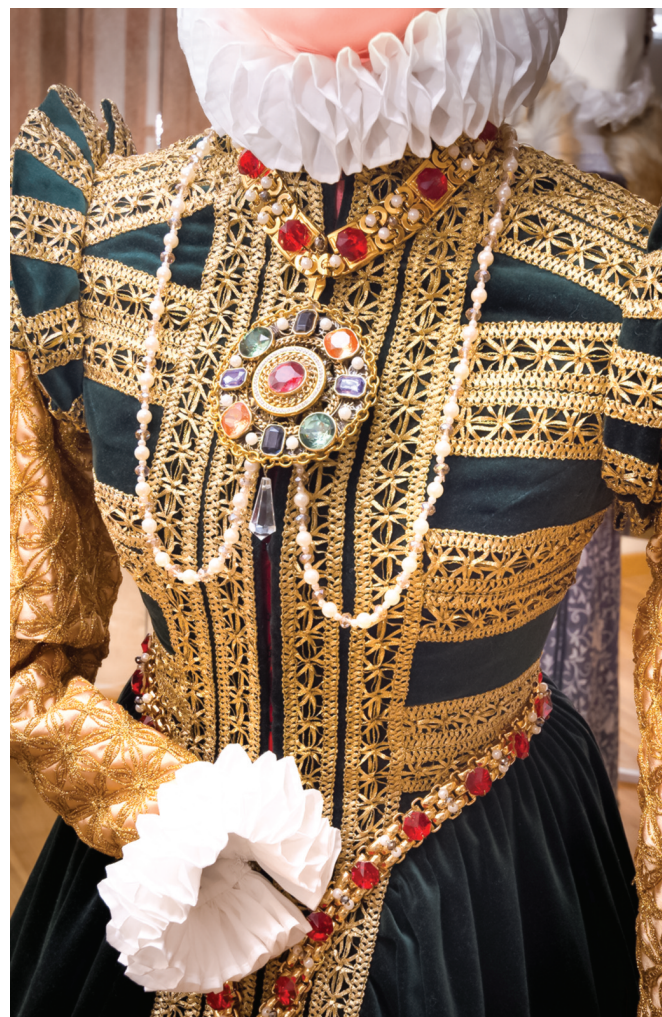
Německá varianta španělské módy – detail.