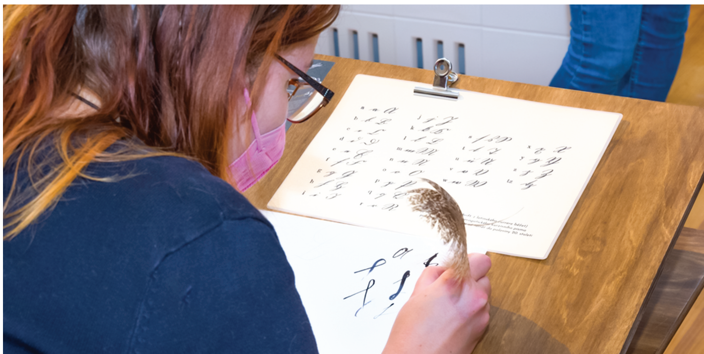
Písaři, piš! Aneb vyzkoušejte si, jak psaly Pernštejnky.