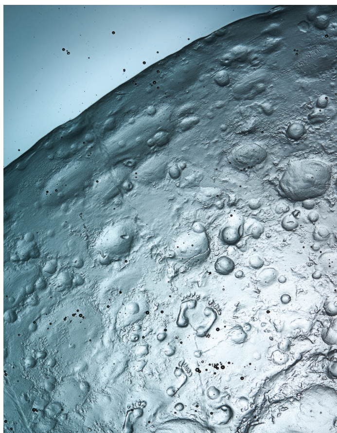
Přijměte pozvání do vnitřních světů Petra Hory!