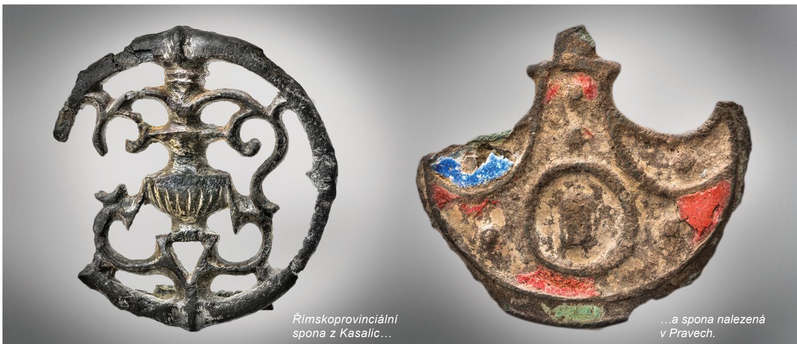
Římskoprovinciální spona z Kasalíc...