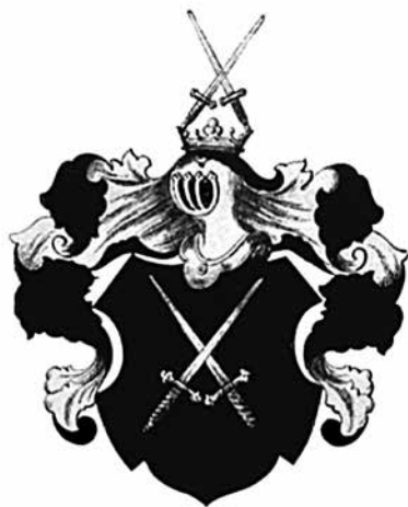
Obr. 1: Erb Vrábských z Vrábí (NN, Znaky rodů českých, Poděbrady: Vil. Kumpfer, b. d., vyobrazení č. 86).

Rytířský rod Vrábských z Vrábí se poprvé v pramenech objevil na konci 14. století. Svě jméno odvozoval od středočeské tvrze Vrábí, stojící neda-leko Brandýsa nad Labem (lokalita Vrábí je dnes jeho součástí). 3) Václav Vrábský Tluksa z Vrábí (1603–1649), který od poloviny 40. let 17. století užíval ještě druhé jméno Vojtěch (zřejmě pro odlišení se jmenovcem z jiné rodové větve), šel do jisté míry ve stopách svého vzdáleného příbuzného Hynka. Již od roku 1640 bydlel trvale v Praze v domě Albrechta Lavína (Dlouhá ulice, Staré Město pražské) a hlavní příjmy získával z úroků ze zapůjčených peněz. Po prodeji Zdechovic (1641) vlastnil jediný malý statek Tisová v Podbrdském kraji. Mimo to působil i jako zemský úředník – byl hejtmanem Chrudimského kraje (1636–1639) a radou při soudu Nejvyššího purkrabství pražského. 4) Václav Vrábský byl dvakrát ženatý. Jeho první manželkou byla Eliška (Alžběta) Obytecká z Obytec († d. 1642); z tohoto manželství vzešel jeden syn Adam Sezima (d. 1630 – p. 1663) a tři dcery. 5)