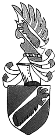
Obr. 4: Erb Vartovských z Varty (M. MYSLIVEČEK, Velký erbovník, sv. II, s. 300).