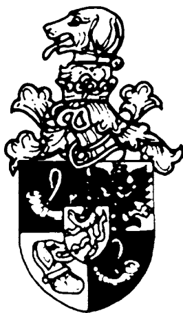
Obr. 2: Erb Věžníků z Věžník (J. HALADA, Lexikon, Praha 1992, s. 174).