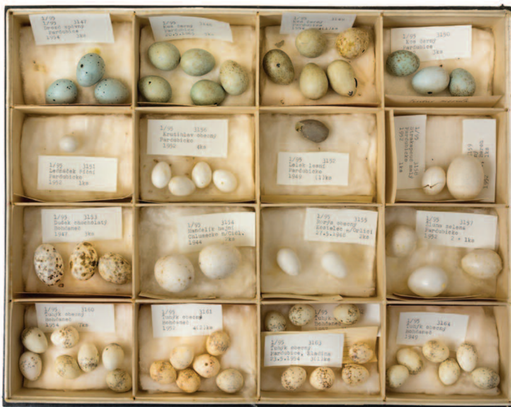
Ukázková krabice Obhlídalovy sbírky vajec.