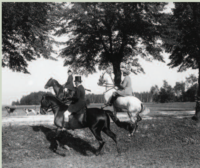
V průběhu honu jezdci překonávali nejrůznější terénní překážky.

A jak takový hon probíhal? Společnost se ráno sešla na předem určeném místě (často to bývalo závodistiště) a jelen označený mašličkou na paroží byl vypuštěn z vozu. Po určité době huntsman vydal pokyn k vypuštění smečky, za kterou se vydali jezdci na koních. Cílem nebylo jelena zabít, ale odchytit, aby mohl běžet při dalších honech. Jezdci (i jezdkyňe v dámských sedlech) přitom zdolávali četné terénní překážky a běžně urazili víc než třicet kilometrů za den.