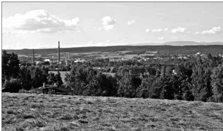
Obr. 1: Pohled ze Žirecké Podstráně na Dvůr Králové s panoramatem Krkonoš. Vlevo dole střecha rodinného domu na místě údajného tvrziště (foto autor).

Kdy došlo k výstavbě tvrze, není jisté. Nevíme nic ani o počátcích samotné Podstráně, natož jestli s ní toto vladycké sídlo souviselo již od založení. První písemné zmínky jsou v pramenech zachyceny až kolem přelomu 14./15. století. Místní jméno Podstráň reflektuje polohu, na níž byla vesnice s tvrzí vystavěna a odkazuje se na oronymum Stráň ( Tieberleiten ). Ta, zhruba v délce osmi kilometrů, lemuje jižní část královédvorské kotliny, kterou o více jak 100 m převyšuje.