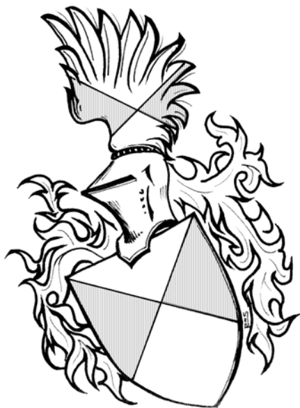
Obr. 2: Erb Hrabšů z Nové Vsi (kresba autor).

Jak již bylo zmíněno, Jan z Habru a Nové Vsi se pravidelně psával ve stejném tvaru. Ovšem ve třech zápisech ze dne 14. února roku 1482 dochází k obratu, kdy je uváděn pouze s protopříjmením Hrabiše z Nové Vsi . 21)