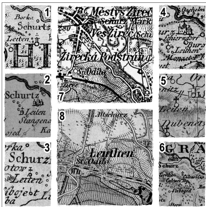
Obr. 7: Kostel v Žirecké Podstráni (Leiten) na starých mapách (1 – Müllerova mapa 1720; 2 – Le Rougeova mapa 1757; 3 – Müllerova mapa 1770; 4 – Mapa Hradecké diecéze 1790; 5 – Schmollova mapa 1809; 6 – Kreibichova mapa s kostelem nad Kalvárií 1828; 7–8 – Kaple sv. Odila v Podstráni na III. vojenském mapování 1880. Online viz: http://chartae-antiquae.cz ).

Poblíž stával i jesuitský kostelík (kaple) sv. Kříže ( Kreutz Kirche ) s křížovou cestou na Kalvárii ( Kalvarienberg ). Zaznamenaný byl ještě na I. vojenském mapování, na rozdíl od nijak zdůrazněného kostelíka sv. Odilona. Jednalo se o stavbu z let 1729–1733. Do současnosti se z kaple nic nedochovalo. 60)