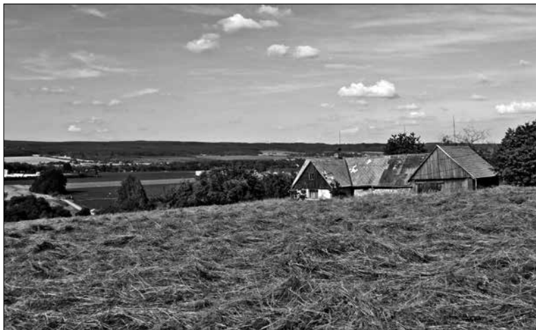
Obr. 4: Žirecká Podstráň. Typická usedlost s pohledem do údolí zaniklých rybníků.

Hodnota podstránského statku spočívala především v jeho rybnících. Těmi bylo zaplaveno celé pravobřežní údolí Labe téměř od Dvora Králové až k Žirči. V deskách manských se výslovně jmenují dva: Hrabišovský rybník a rybníček malý . 54) Podle terénních reliktních hrází, současně s kartografickou toponymií, je zřejmé, že se zde nacházelo minimálně pět rybníků.