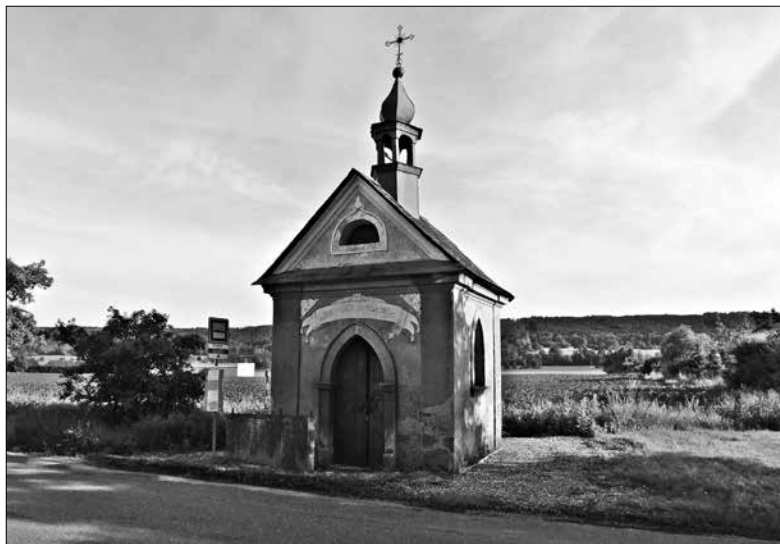
Obr. 5: Borek. Kaple P. Marie Bolestné se Strání v pozadí.