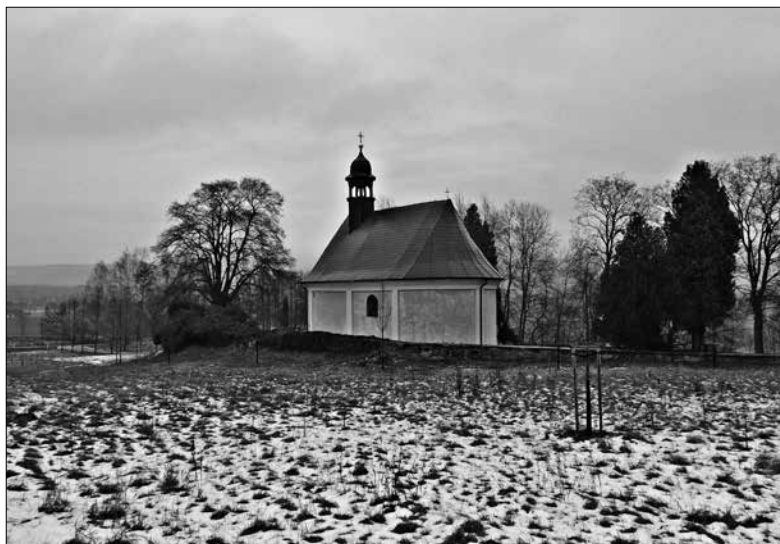
Obr. 6: Kaple sv. Odilona. Pohled od jihozápadu.