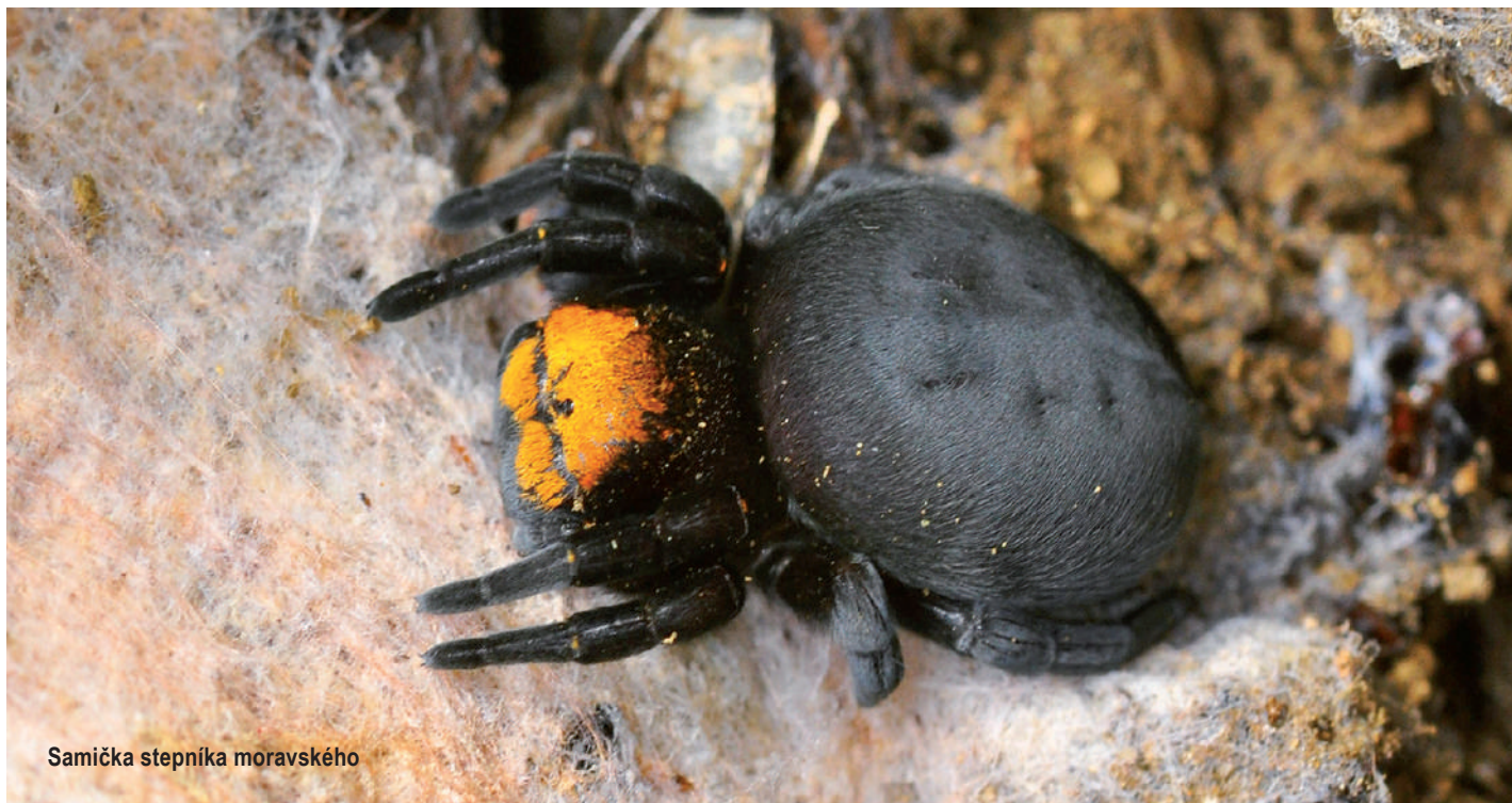
Samička stepníka moravského

Kromě toho jsou pavouci také významnou bioindikační skupinou živočichů.