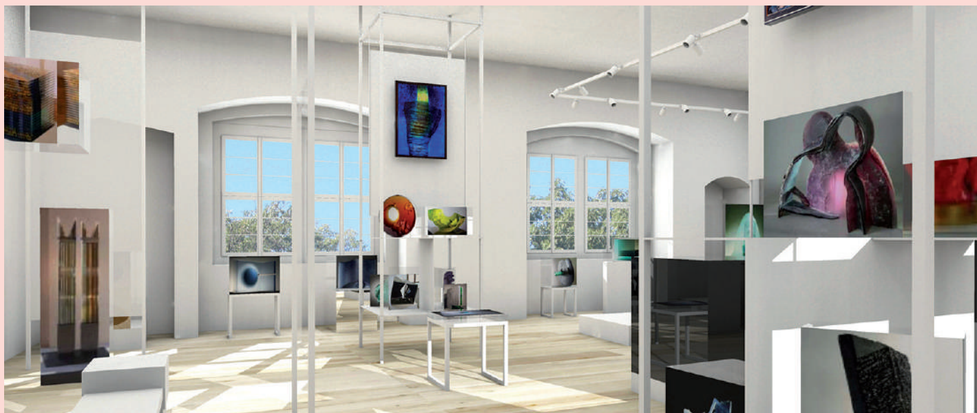
Návrhovaná podoba nové výstavní expozice

Během let se sbírka autorského skla výrazně rozšířila o další vynikající díla českých umělců, kteří patří ke světově uznávaným tvůrcům. Pardubická sbírka je nyní i v zahraničí respektovanou kolekcí jak svojí početností, tak kvalitou zastoupených exponátů.