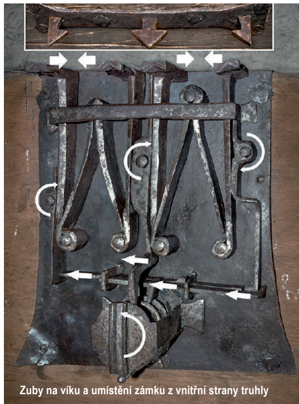
Zuby na víku a umístění zámku z vnitřní strany truhly