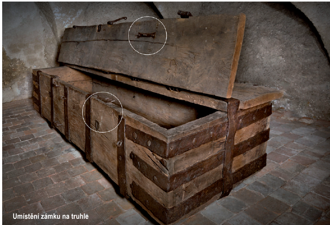
Umístění zámku na truhle