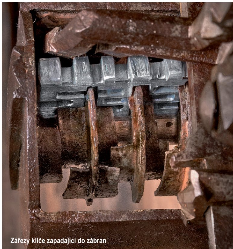
Zářezy klíče zapadající do zábran