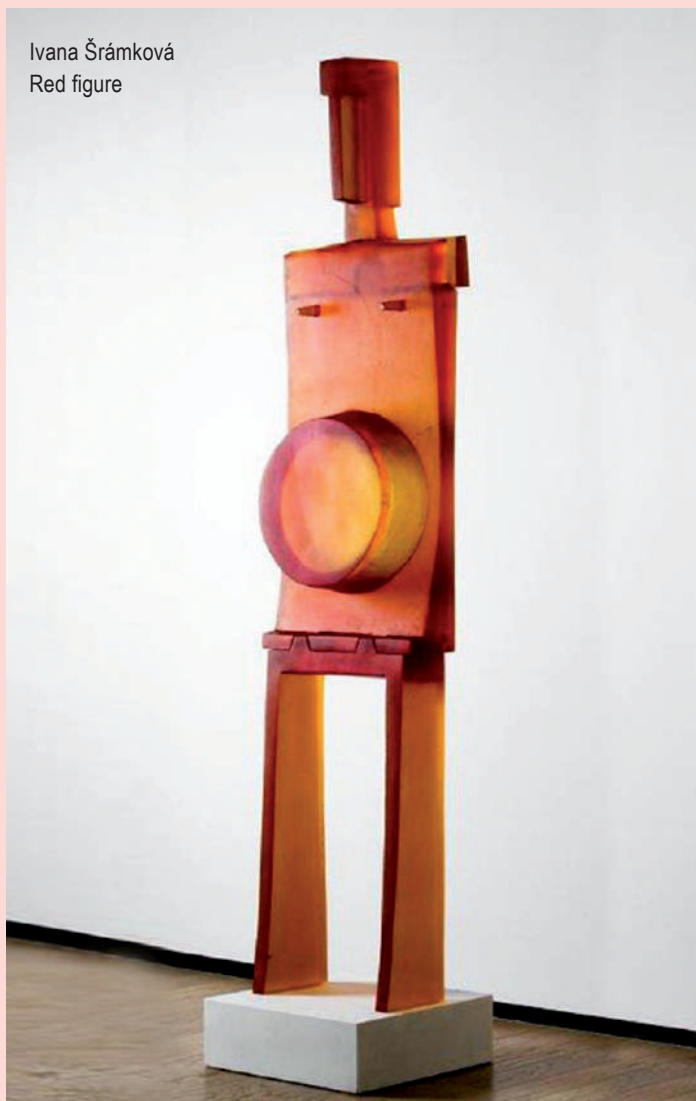
Ivana Šrámková Red figure