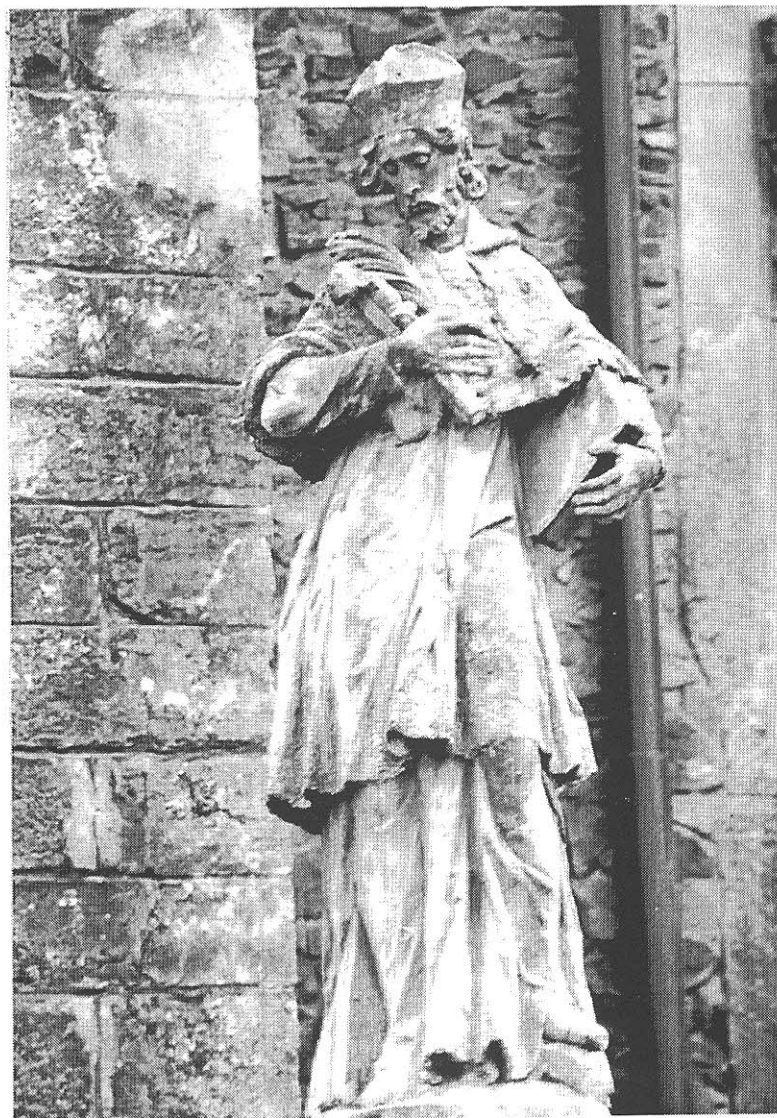
Sv. Jan Nepomucký u Sv. Bartoloměje v Pardubicích