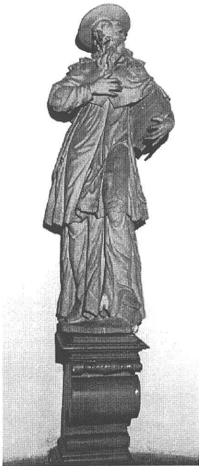
Sv. Jeroným - originál v kostele Sv. Trójice ve Vysokém Mýtě