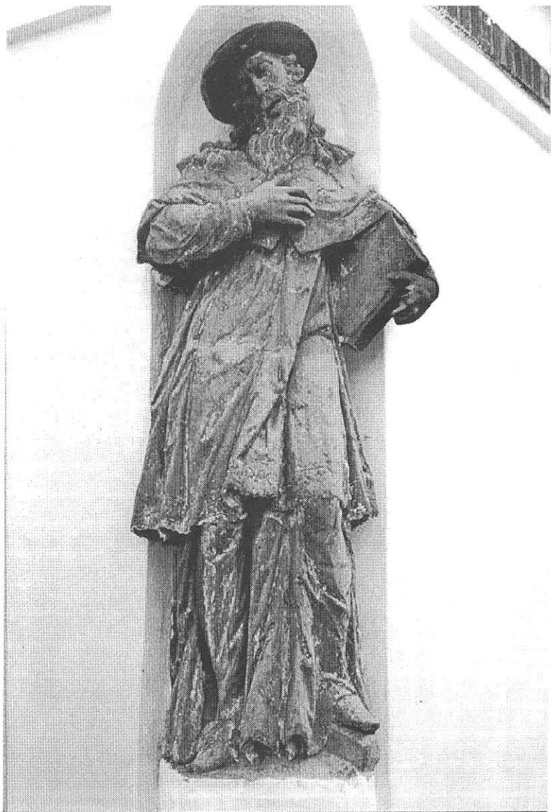
Sv. Jeroným na zvonici ve Vejvanovicích