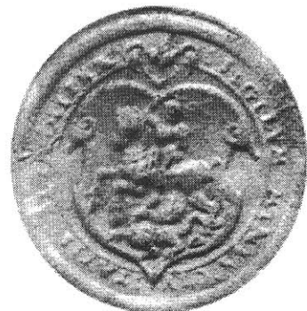
obr. 1: Oplatková pečeť města Vysokého Mýta na položce č.6.

6. 1591, úterý po neděli Cantate [4.5.1591], Vysoké Mýto Purkmistr a rada města Vysokého Mýta propouštějí na žádost hejtmana pardubického panství Václava Chotka z Chockova a na Všetatech na pardubické panství svého poddaného Jana Pavlova ze vsi Vratislavě. 1 fol. 20 x 33 cm. Na reversu adresa a dobře dochovaná oplatková pečeť o průměru 35 mm, původně list uzavírající. Text česky.