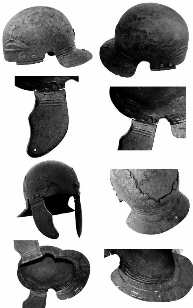
Obr. 3: Římská přilba typu Weisenau ze sbírek státního zámku Opočno, detaily.