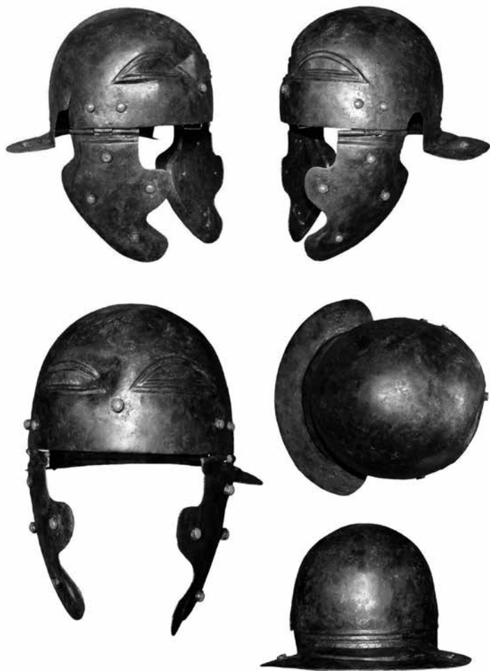
Obr. 6: Lokalita neznámá, soukromá sbírka, římská přilba typu Weisenau (podle Roman legions (online). Dostupné z URL: http://www.romancoins.info/MilitaryEquipment-Helmet-weisenau.html#Guttman , [cit. 20. 8. 2021]).