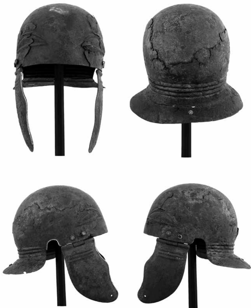
Obr. 2: Římská přilba typu Weisenau ze sbírek státního zámku Opočno.