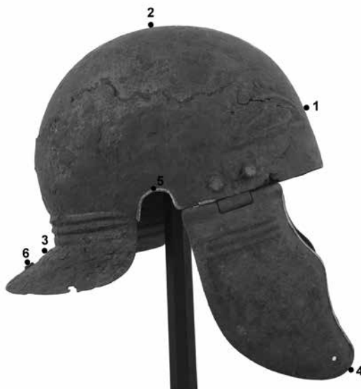
Obr. 7: Římská přilba typu Weisenau ze sbírek státního zámku Opočno, body měření pXRF analýzy (měření provedla A. Pukanczová).

Přilba byla podrobena několika měřením za pomoci ručního fluorescenčního spektrometru (pXRF) 63) typu Delta Professional (tab. 1). Přístroj byl nastaven na mód Analyticky Plus, který je standardně používaný pro měření kovů. 64) Měření probíhala přes Mylar fólii, každé po dobu 60 vteřin. I přes zúžení RTG paprsku na nejmenší možný průměr (3 mm) byla mnohá z měření přístrojem přerušena a takto získaná data nejsou uznána za validní. Celkem byla přilba podrobena 15 měřením, z čehož pouze 6 nebylo přístrojem přerušeno a jsou tedy považována za validní (obr. 7).