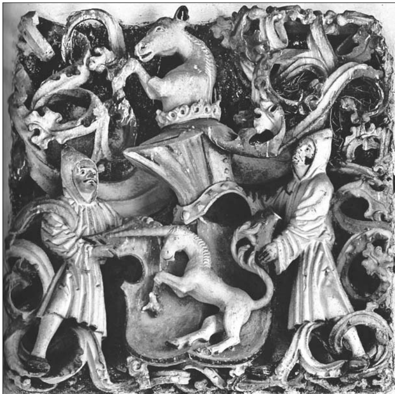
Erb rodu z Vrchovišť, polychromovaná dřevořezba, 1488–1504, kostel sv. Trojice v Kutné Hoře.