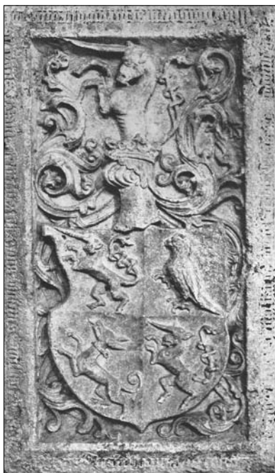
Náhrobník Jana Smiška z Vrchovišť z roku 1501, kostel sv. Trojice Kutná Hora.