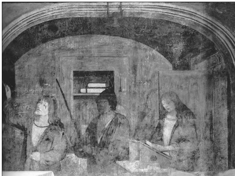
Kostel sv. Barbory, Kutná Hora, Smiškovská kaple, votivní scéna. Votivní scéna na čelní stěně Smiškovské kaple v chrámu sv. Barbory v Kutné Hoře, datovaná v dosavadní literatuře do doby kolem roku 1490, patří mezi nejvýznamnější projevy naší pozdně gotické výtvarné kultury.