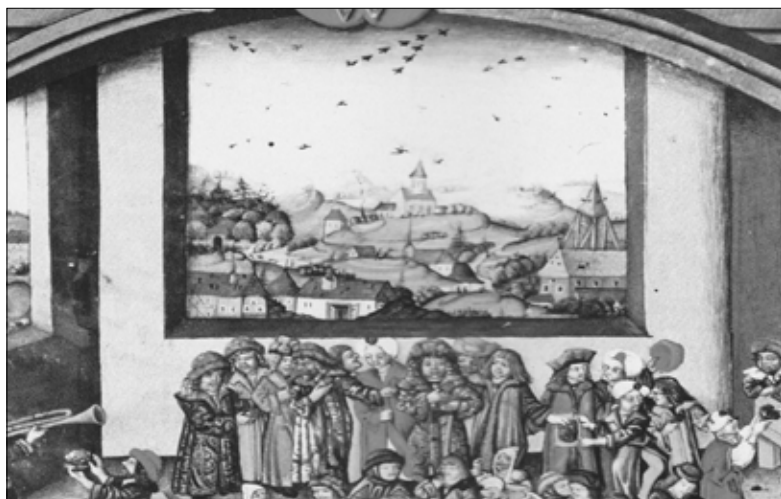
Detail z titulního listu Kutnohorského kancionálu s pohledem na středověkou horní aglomeraci kolem kostela sv. Petra a Pavla u Kutné Hory s mohutnými odvaly, hornickou kavnou, křížovým větrákem a hutí s širokým dymníkem v popředí. Konec 15.století. Kutnohorský kancionál, Rakouská národní knihovna, Vídeň, cod.s.n. 15.501.