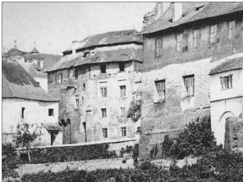
Rožďalovský dům v Kutné Hoře – významná dominanta v sousedství kostela sv. Jakuba – stav před rokem 1870, kdy byl zbourán. Foto Jindřich Dittrich, 1870.