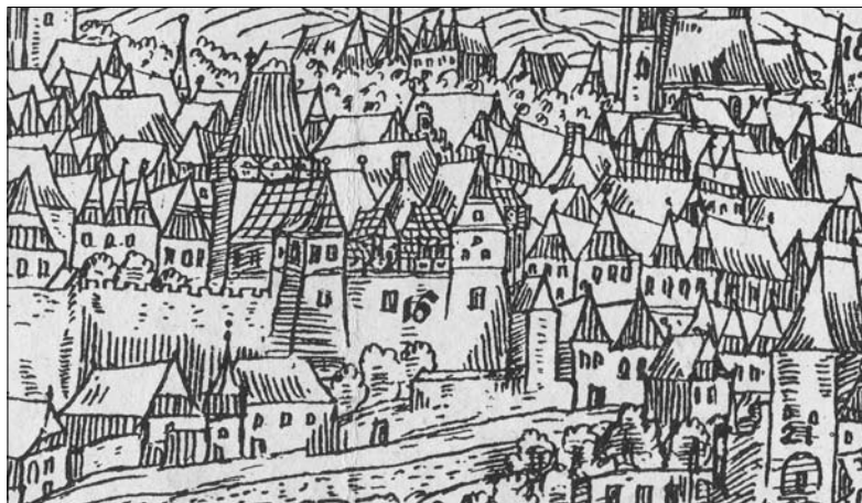
Hrádek v Kutné Hoře – detail z veduty J. Willenberga z roku 1602 se zachyceným hutním sopouchem.