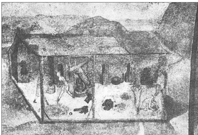
Detail nástěnné malby v zelené světnici hradu Žirovnice z roku 1490 – vyobrazení ságrovací huti k vycezdování stříbra z černé mědi, které je nejstarším dokumentem výrobního postupu u nás.