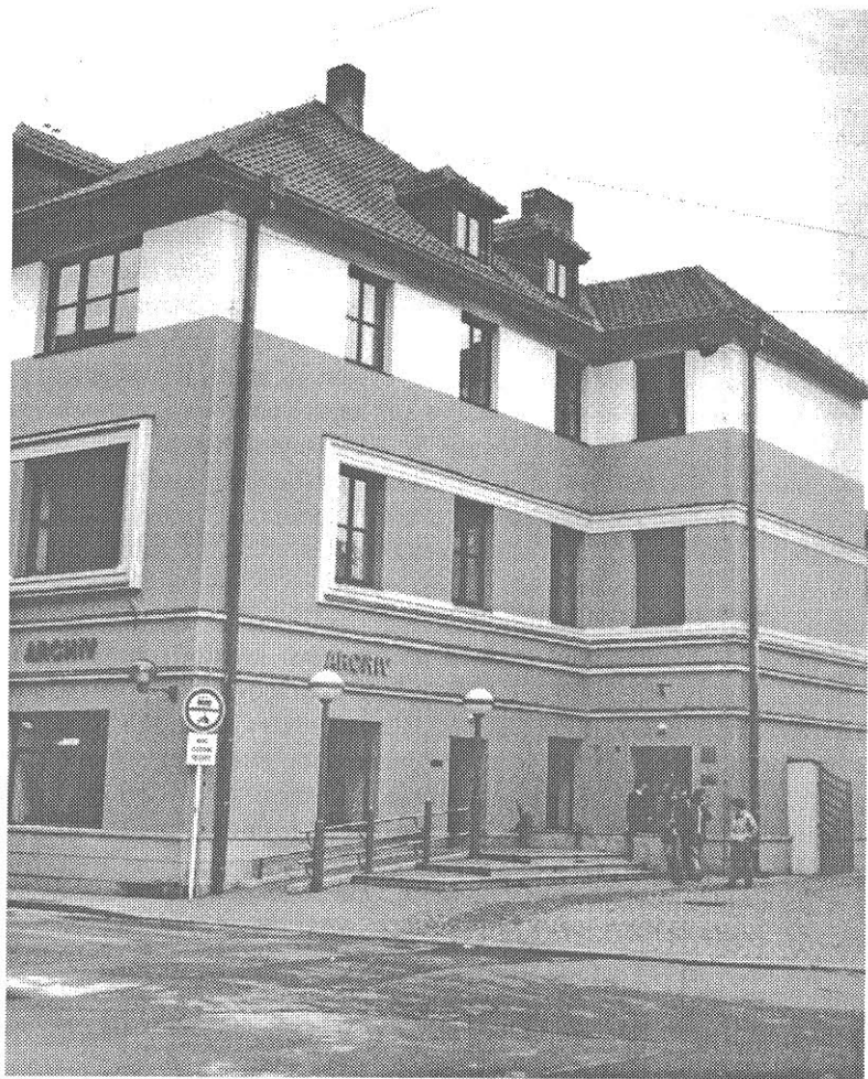
Nová budova státního okresního archívu v Pardubicích