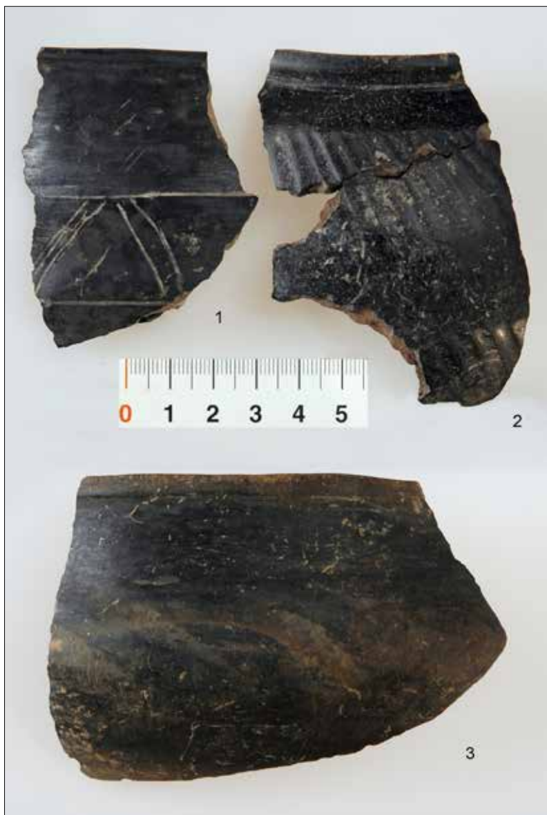
Obr. 2. Blato, okr. Pardubice. Zlomky keramiky z doby římské.