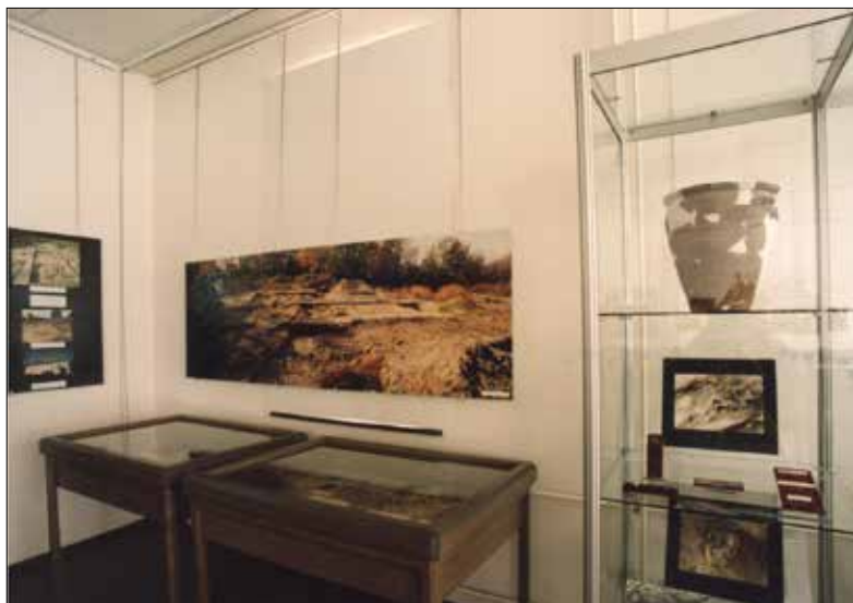
Foto z výstavy archeologických nálezů z Pardubiček ve SOA v Pardubicích.