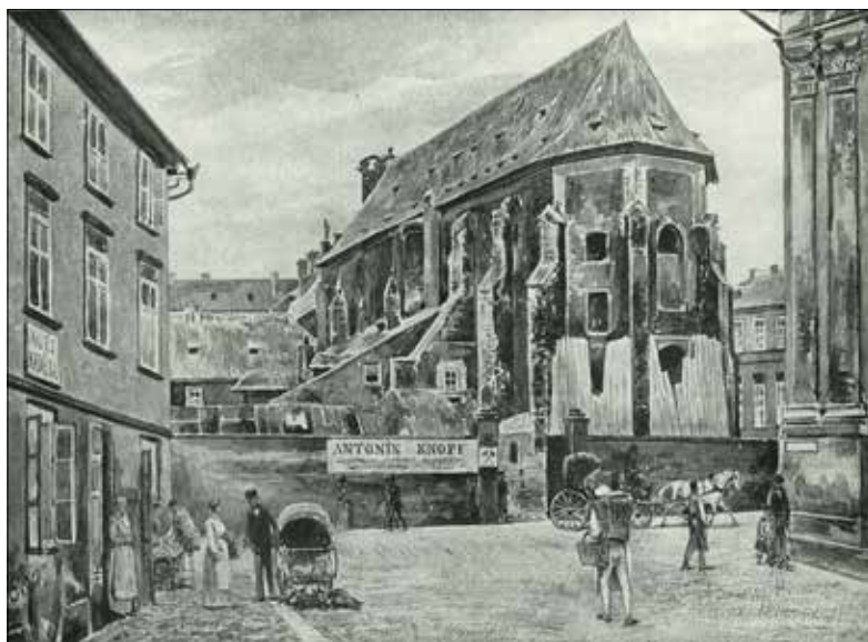
Cyriacký kostel sv. Kříže Většího v Praze (Štech a kol. 1946, obr. 32).