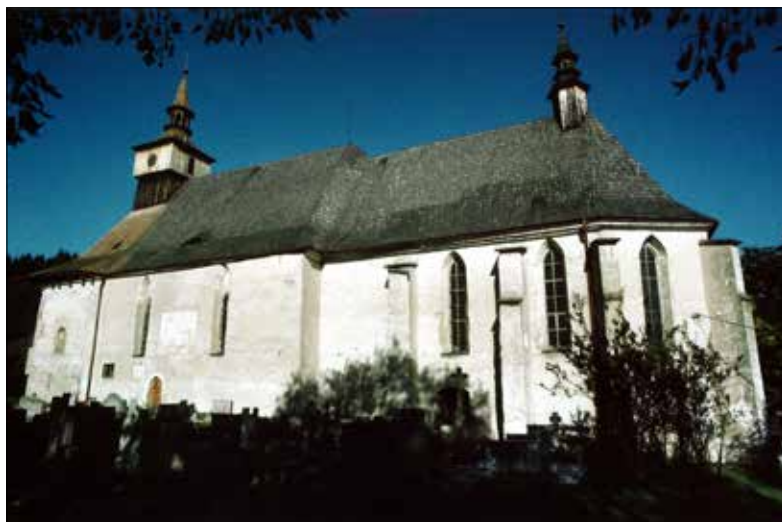
Cyriacký kostel Nejsvětější Trojice (původně P. Marie) v Klášterci nad Orlicí.