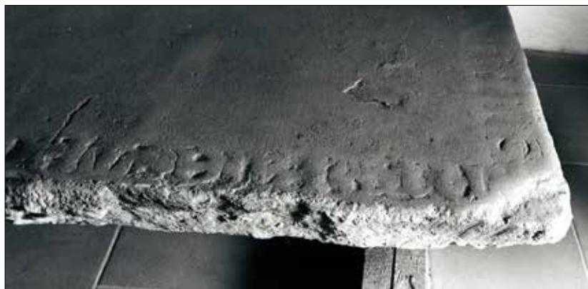
Náhrobek (Adličky? Arnošta?) při pokusu o čtení nápisu.