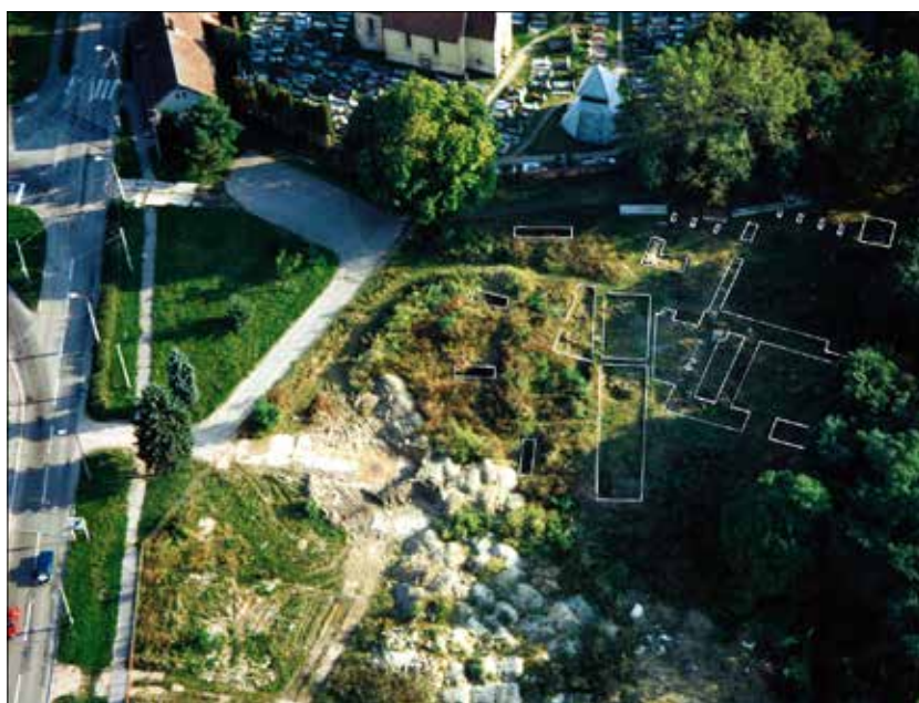
Letecký snímek plochy archeologického výzkumu v Pardubičkách z r. 1995 (pohled ze severní strany, bíle vyznačeny v minulosti odkryté sondy, foto V. Maryška).