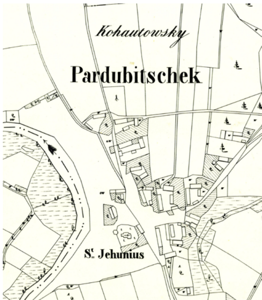
Mapa Pardubiček z r. 1839.