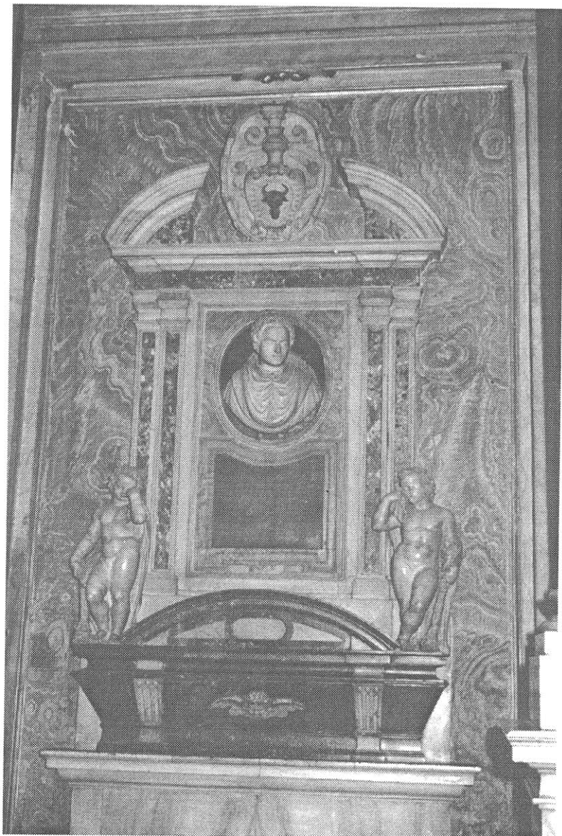
Celkový záběr na Maxmiliánův mramorový náhrobek