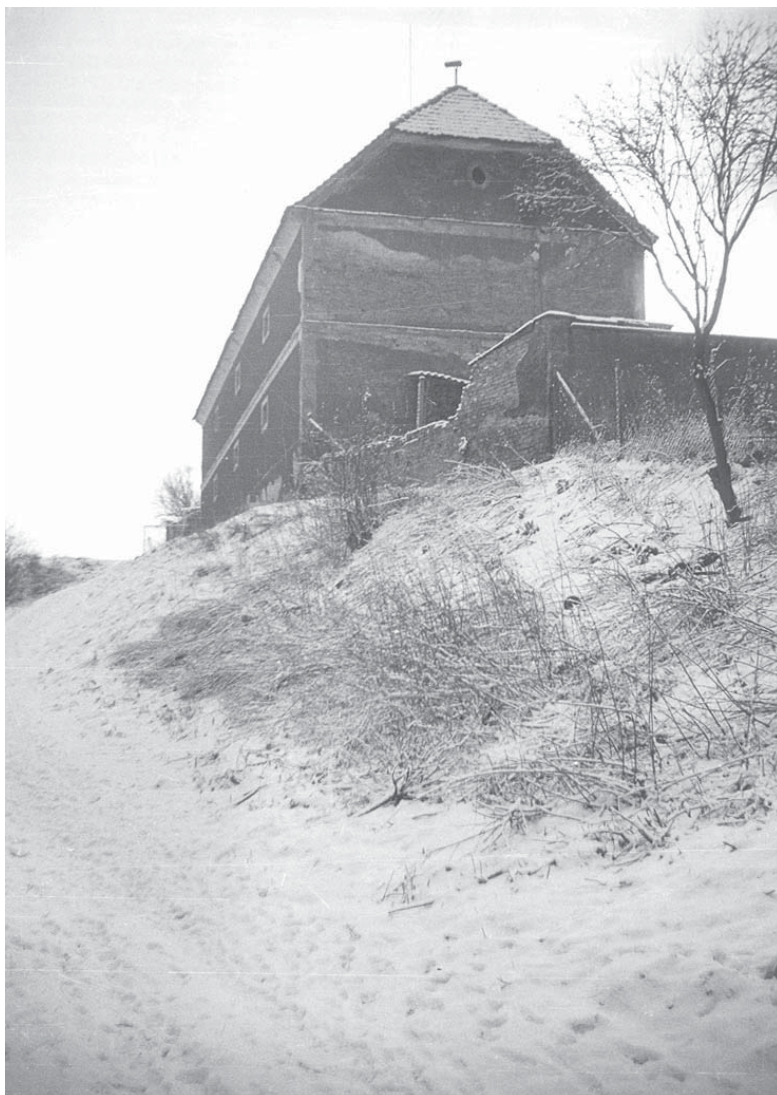
Sýpka dvora v Dubanech, pohled od severozápadu (foto dokumentace VČM Pardubice, Z. Bičík, 1968).