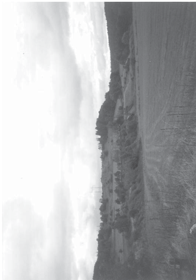
Kota 487 m Hrobka, též vrch Žemlov u Jílového. Pohled ze silnice Hodkovice - Jílové. Takto kotu viděli postupující Prusové. Současný stav.