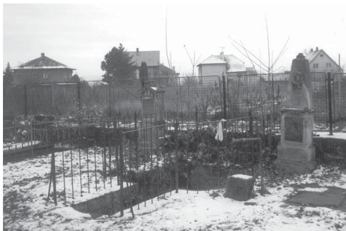
Chrudim, o. Chrudim. Hřbitov u sv. Václava na Novém Městě. Hroby, v nichž jsou pohřbeni Josef Matyáš a Michael Zeley. Současný stav.