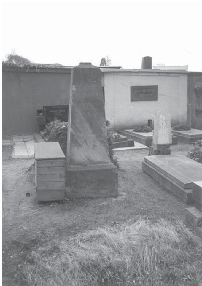
Přelouč, o. Pardubice. Hřbitov na Svatém poli. Pomník na hromadném hrobě pruských vojáků. Pomník je poškozen, kříž na vrcholu chybí. Současný stav.