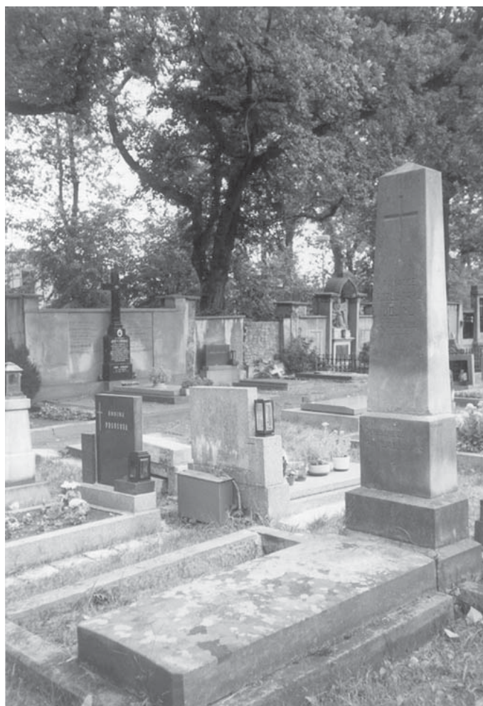
Pardubice, o. Pardubice. Starý hřbitov, ulice Pod břízkami. Zcela vpravo pomník věnovaný památce pozůstatků vojáků z roku 1866. Současný stav.