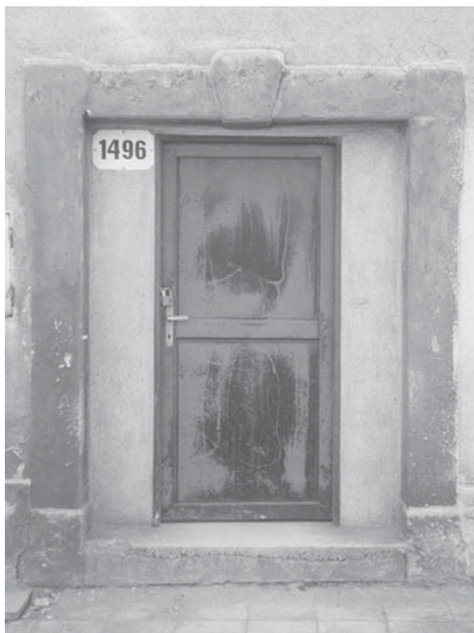
Přelouč, o. Pardubice. Roh Pražské a Havlíčkovy ulice. Portál špýcharu, v němž byl v roce 1866 lazaret. Současný stav. Severně od špýcharu a od Pražské ulice byl hromadný hrob vojáků zemřevších v lazaretu. Nad hrobem byl od konce devatenáctého století již neexistující pomník.