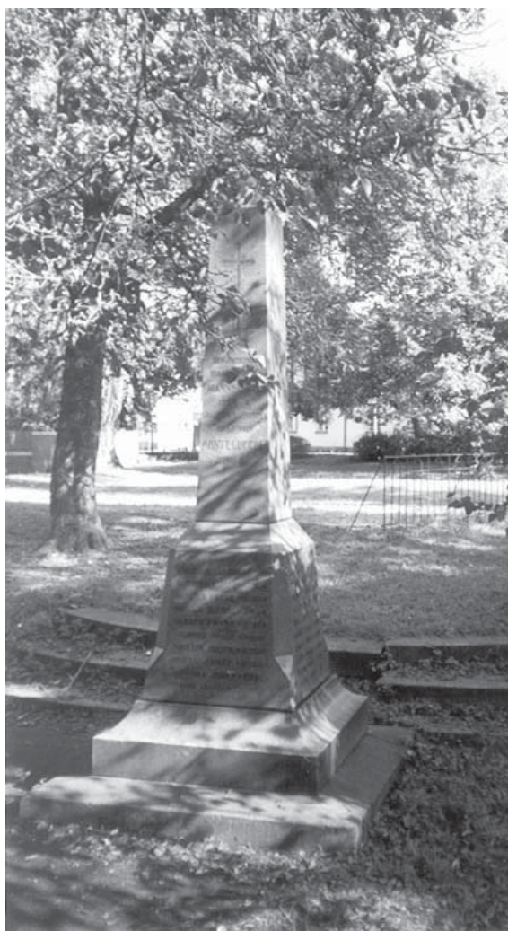
Pardubice, o. Pardubice, místní část Pardubičky. Bývalý vojenský hřbitov, nyní parčík. V popředí pomník 8. pluku dragounů vzniknuvší koncem devatenáctého století. Pomníky na hromadných hrobech pruských vojáků (byly zničeny), stály na trávníku za ním, pomníky (byly zničeny) na soliterních hrobech byly vpravo. Současný stav.