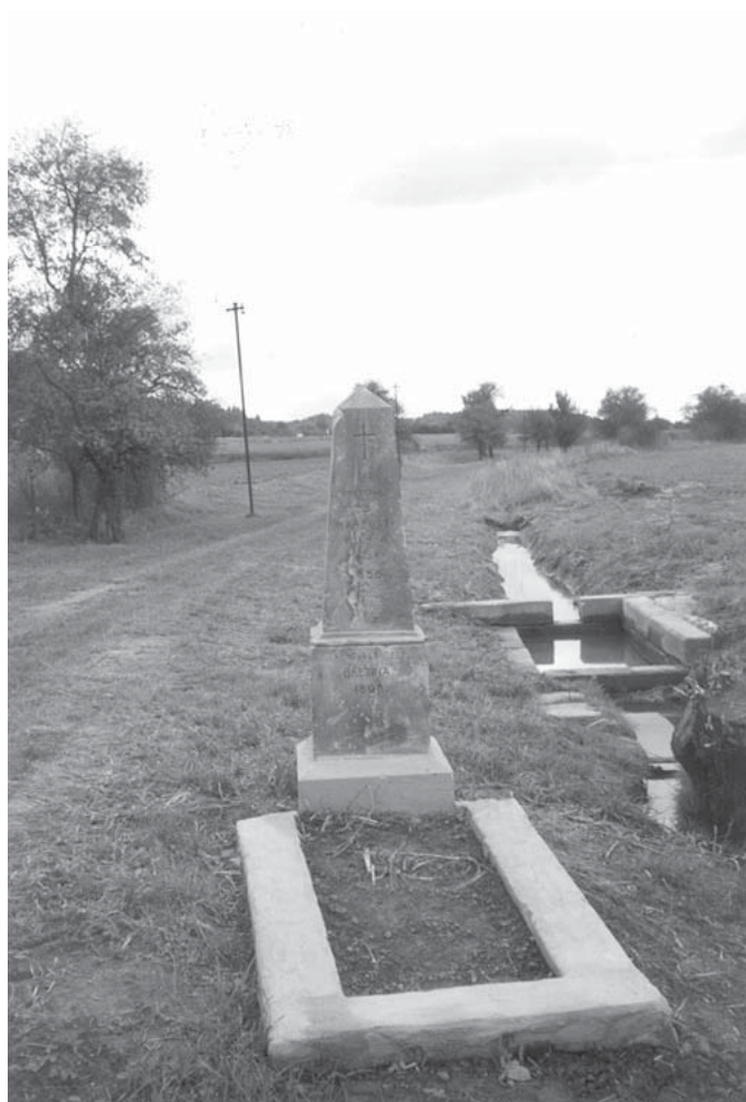
Březina, o. Mladá Boleslav, jižní část obce. Pomník na hrobě tří rakouských vojáků. Současný stav.