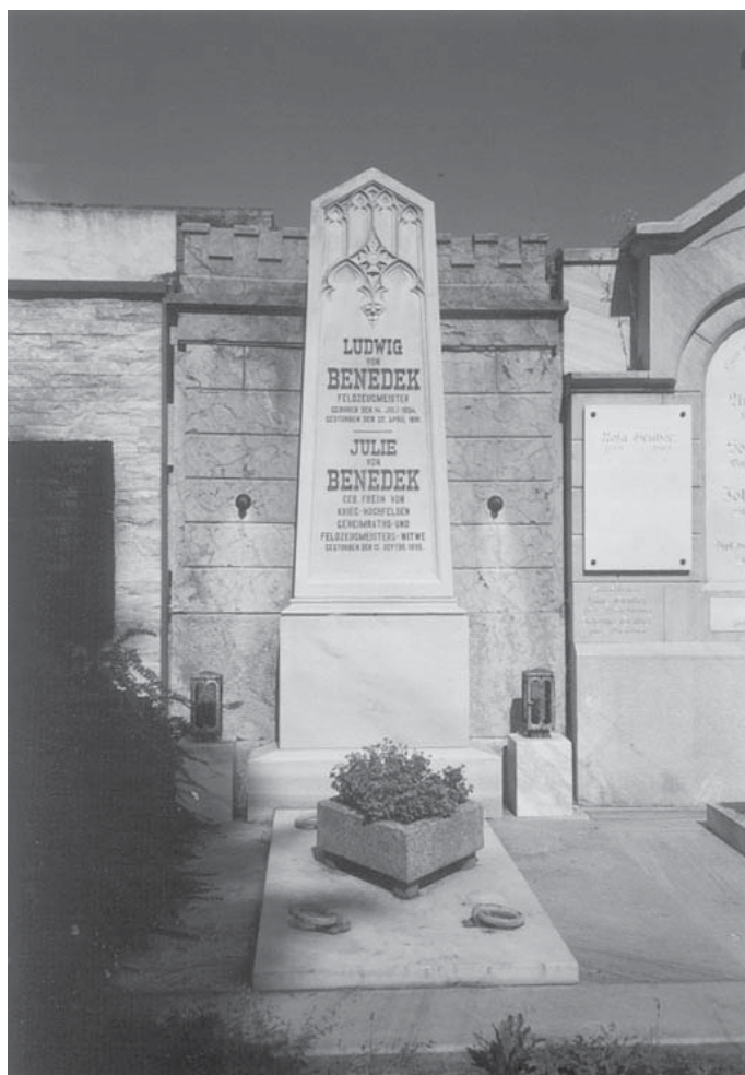
Štýrský Hradec, Rakousko. Hřbitov u sv. Leonharda. Pomník na hrobu, v němž jsou pohřbeni generál polní zbrojmistr Ludvík Benedek a jeho manželka Julie. Současný stav.