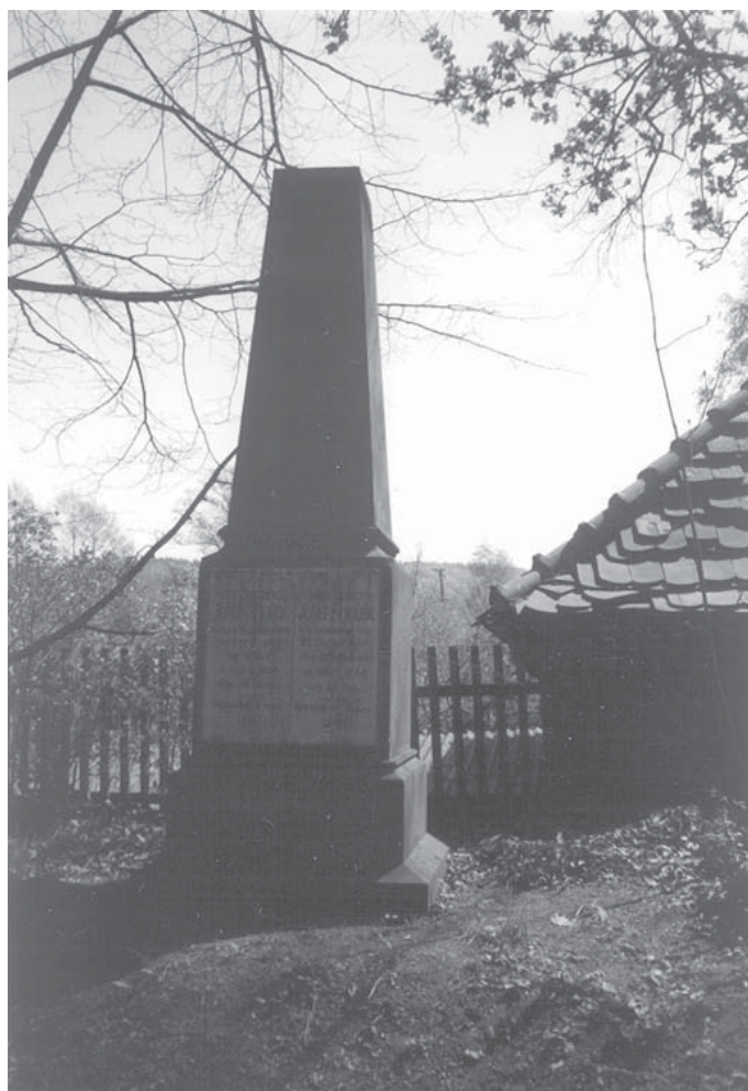
Náchod, o. Náchod, u bývalé celnice u silnice II/303. Pomník desátníka Josefa Součka od pěšího pluku č. 35. Současný stav. Liste Nr. 7