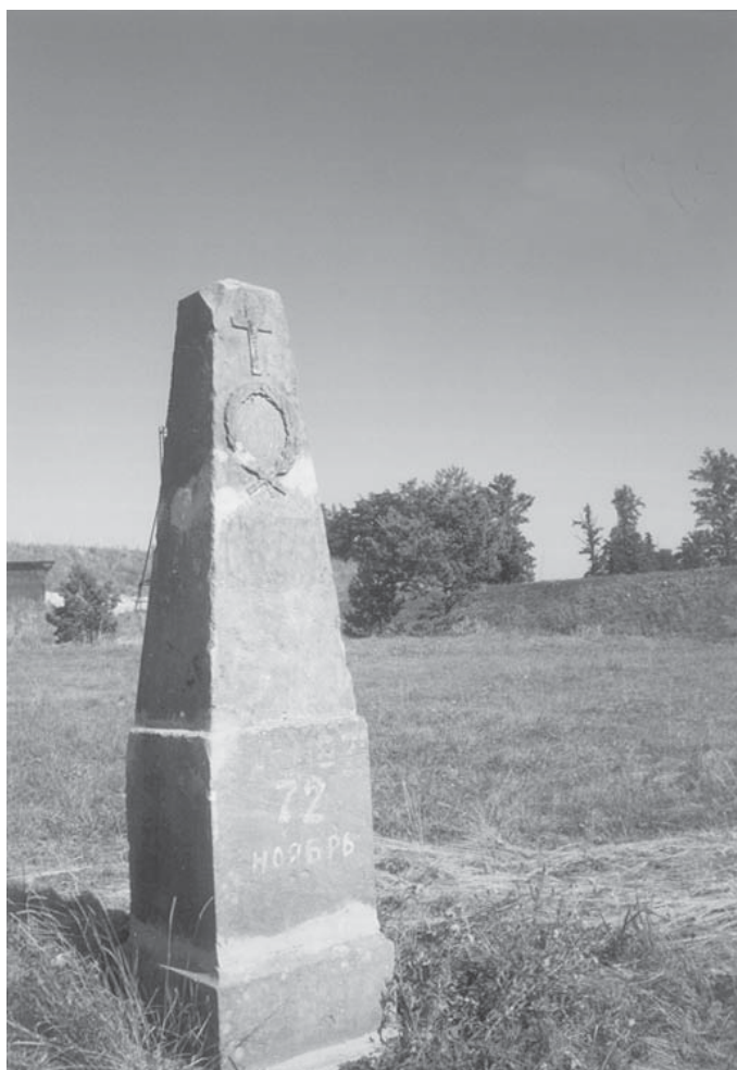
Vysoké Mýto, o. Ústí nad Orlicí. Bývalé vojenské cvičiště. Pomník na hromadném hrobě rakouských a pruských vojáků. Současný stav.