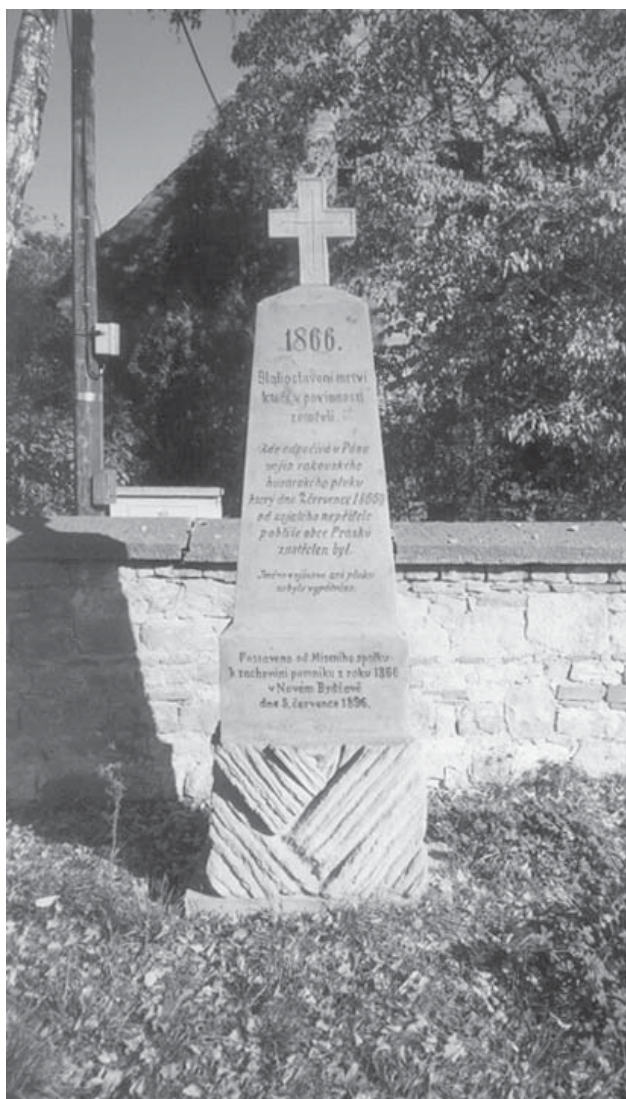
Metličany o. Hradec Králové. Zrušený hřbitov u kostela sv. Jakuba. Pomník vojáka husarského pluku, zabitého u Praseku. Současný stav.