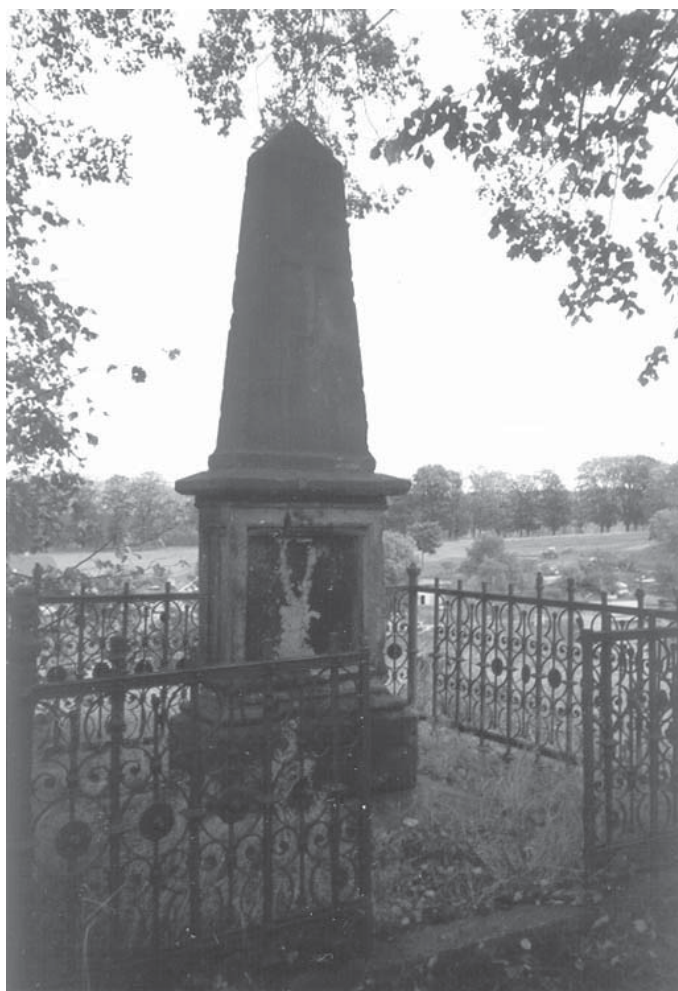
Dlouhý Most, o. Liberec (Langenbruck), západně od obce. Pomník na místě zranění majora Franze von Panz. Pomník je poškozen, chybí nápisová deska a část ohrazení. Současný stav.