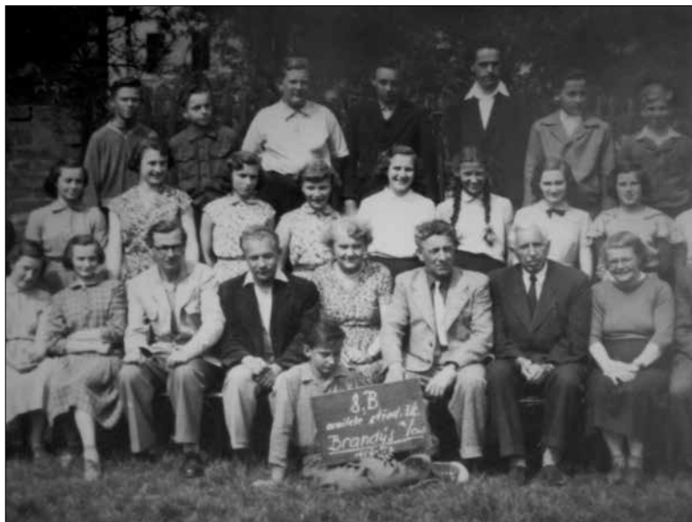
Obr. 3: Pedagogický sbor ZŠ Brandýs nad Orlicí v roce 1957.

Od dalšího školního roku 1957/58 pak Porš ve své třídě prosazoval pravidelná setkání s rodiči, později i pod hlavičkou SRPŠ (Sdružení rodičů a přátel školy). Na jaře v roce 1959 už musel (aby se vystřídalí všichni učitelé) přednést vzpomínkový referát k výročí Leninových narozenin. 26) Z četných akcí, mezi nimiž postupně ubývalo ryze politických a ideologických povinných aktivit ve prospěch aktivit pedagogicko-didaktických, lze v průběhu 60. let vyzdvihnout Poršem iniciovaná setkávání učitelů v Pamětní síni