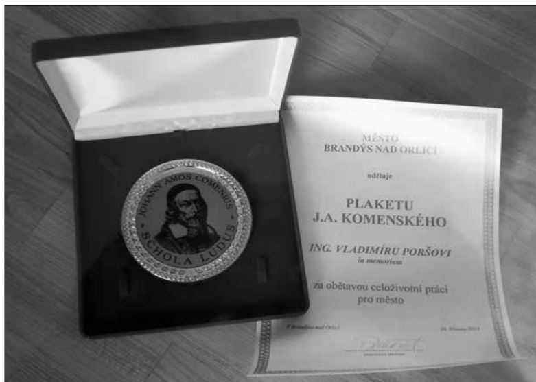
Obr. 6: Plaketa J. A. Komenského.

Zatím poslední připomínkou díla ing. Vladimíra Porše bylo slavnostní předání plakety J. A. Komenského města Brandýsa nad Orlicí za celoživotní činnost ve prospěch města in memoriam u příležitosti Dne učitelů 28. března 2014 za účasti rodinných příslušníků. 43)