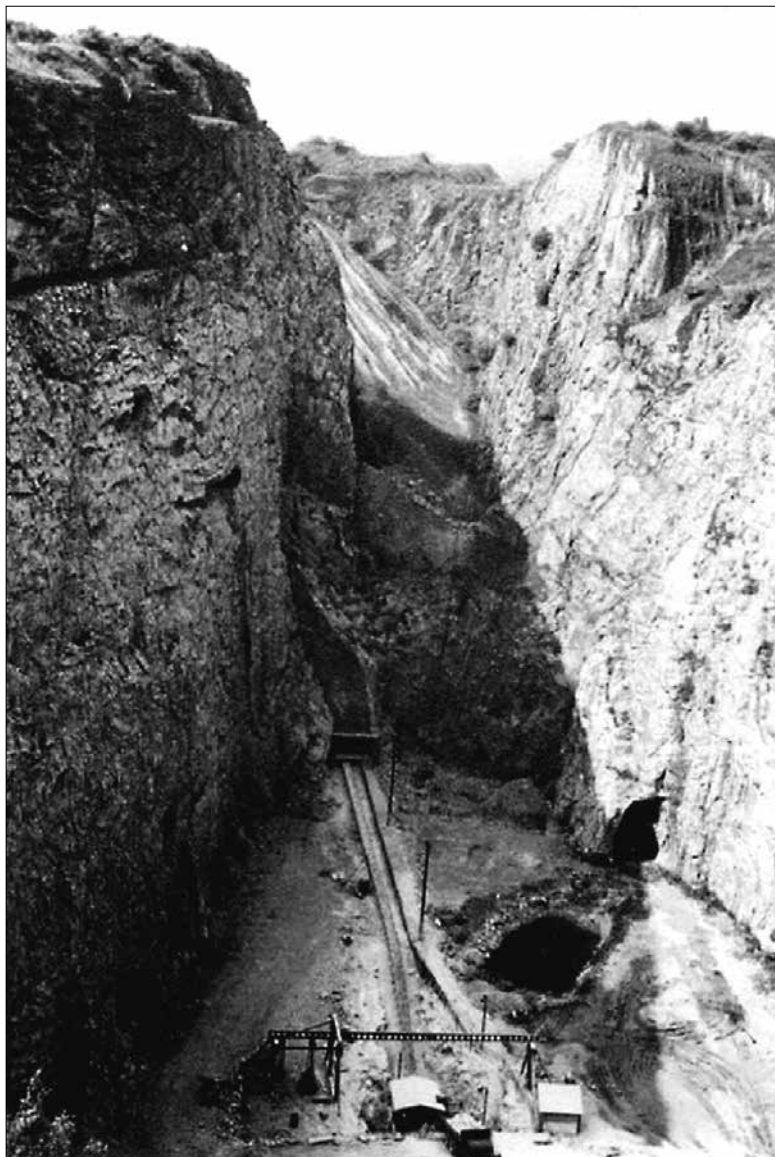
Obr. 7: Trestanecký lom u obce Mořina, kde byl Pavel Thein ve druhé polovině roku 1950 ve výkonu trestu. Fotografie z počátku 50. let.