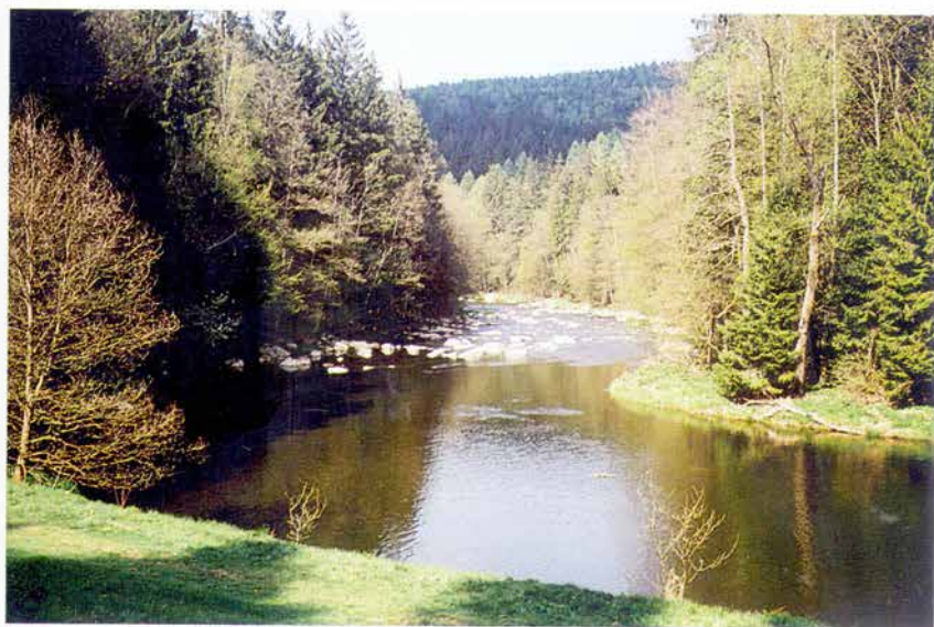
Foto 2: Údolí řeky Sázavy v ústřední části přírodní rezervace Stvořidla (k článku na str. 3).

Photo 1: Melechov hill from western side (see page 3).