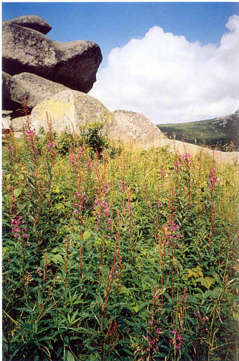
Foto 16: Rozšíření synantropního druhu Epilobium angustifolium L. v okolí Tvarožníku (k článku na str. 105).

Photo 16: Expansion of synantropic plant Epilobium angustifolium L. in the area of locality Tvarožník (see page 105).