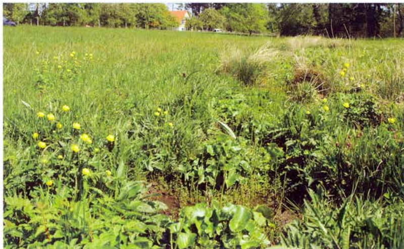
Foto 5: Betlém: Trollius altissimus – hojně se vyskytující v olšových remízcech a souvisejících mokřadních biotopech (k článku na str. 33).

Photo 5: Betlém: Trollius altissimus – abundantly in the alder carr and in neighbouring wetland biotopes (see page 33).