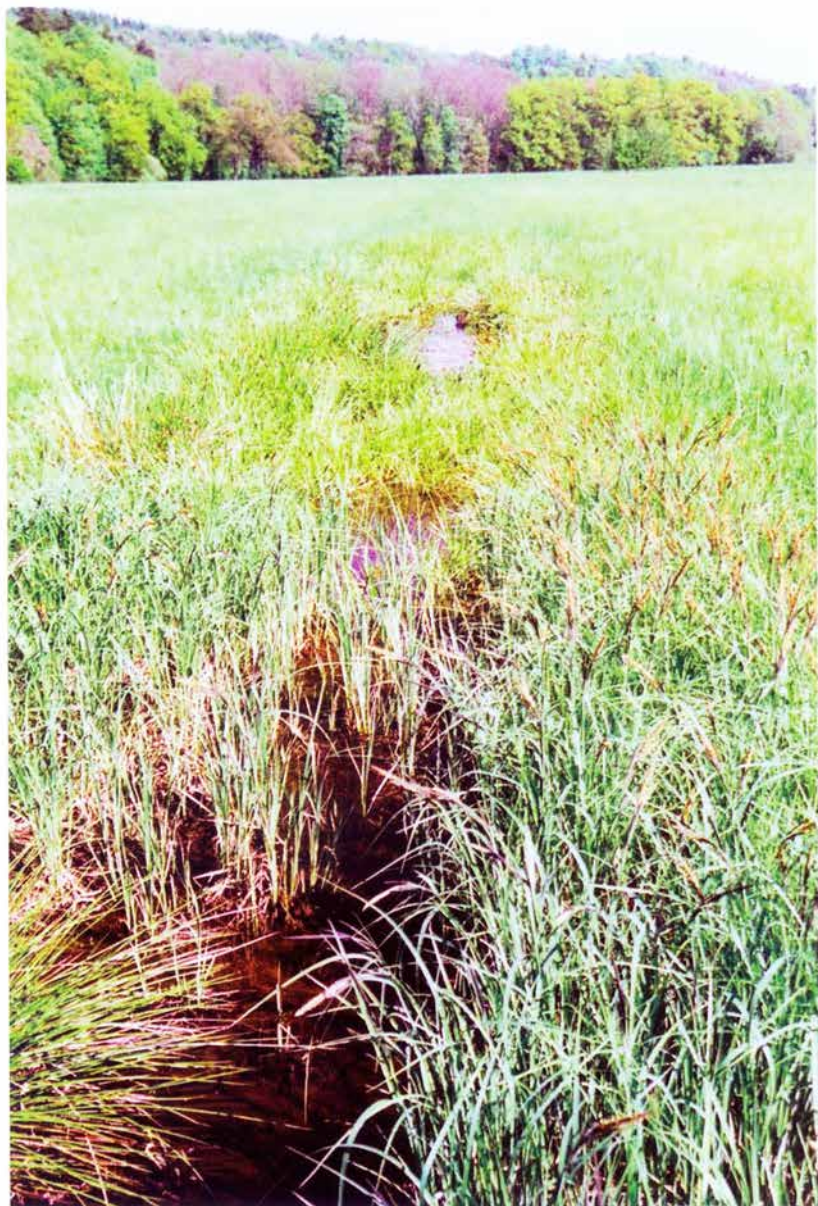
Foto 11: Kanálek v Ratibořické louce (k článku na str. 91).

Photo 11: Channel in meadow Ratibořická louka (see page 91).