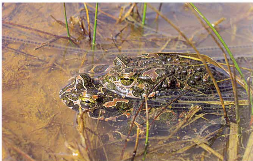
Foto 20: Ropuchy zelené ( Bufo viridis ) při páření v tůňích jihovýchodní strany horního patra lomu u Předhradí (k článku na str. 193).

Photo 19: Eastern part of quarry near Předhradí (see page 193).