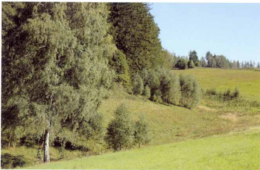
Foto 8: Krskův důl: Pohled na pastvinu (k článku na str. 33).

Photo 8: Krskův důl: View of the pasture of sheep (see page 33).