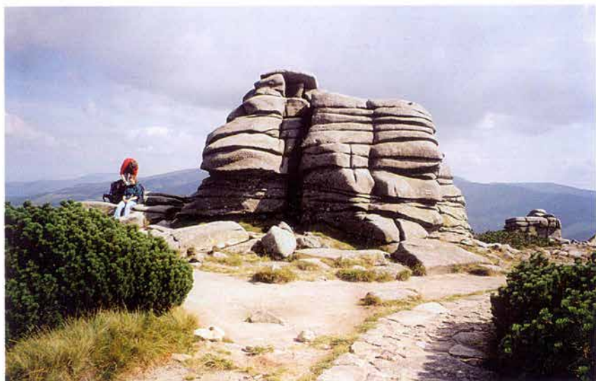
Foto 14: Lokalita Dívčí kameny – destrukce vegetačního krytu (k článku na str. 105).

Photo 14: The locality Dívčí kameny – destruction of vegetation cover (see page 105).