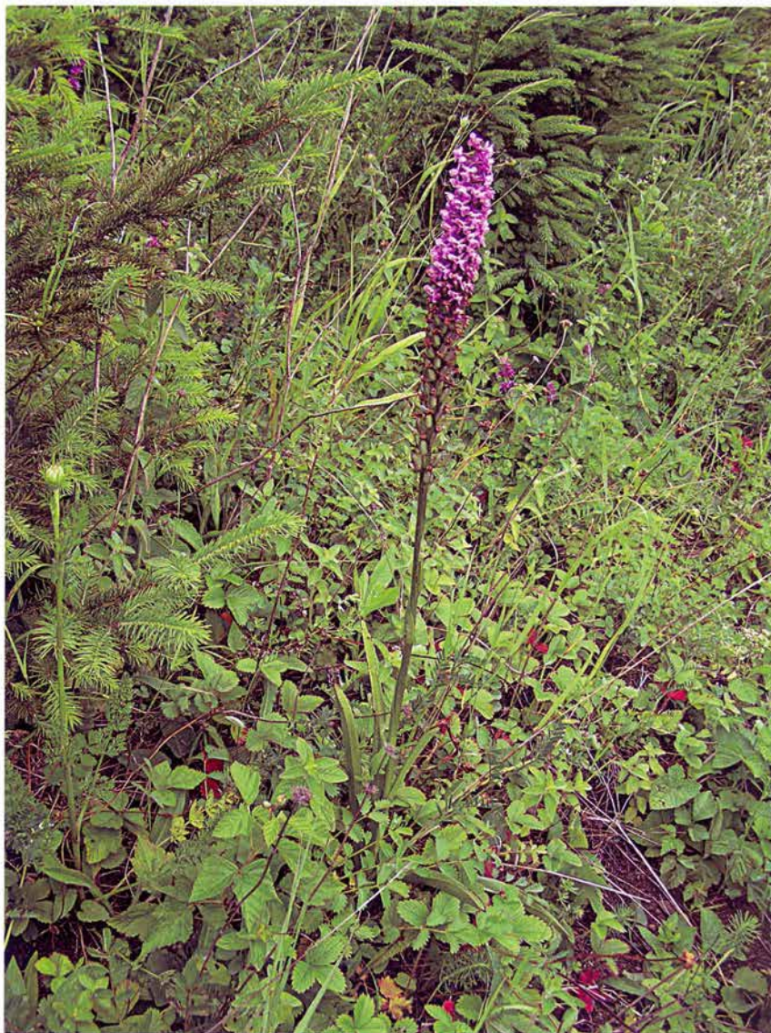
Foto 24: Pětiprstka žežulník ( Gymnadenia conopsea ) na lokalitě u Poříčí 6.7.2005 (k článku na str. 259).