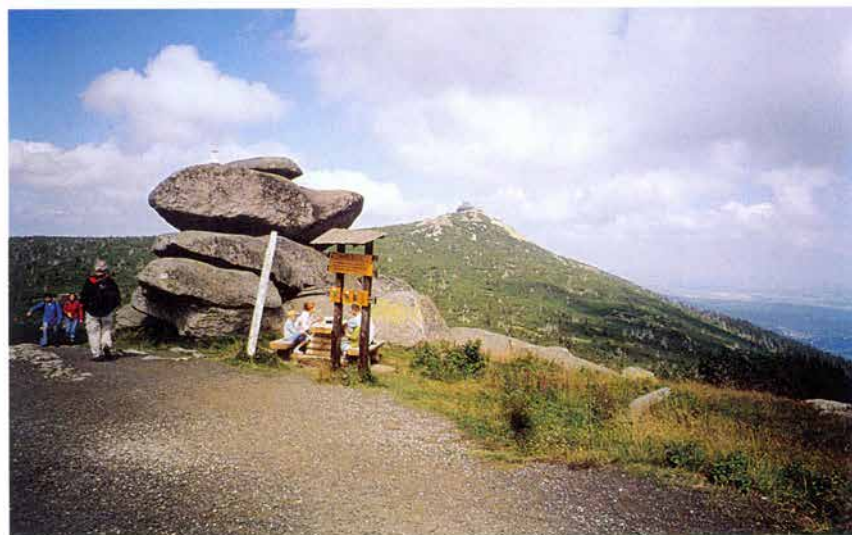
Foto 15: Tvarožník – lokalita ovlivněná turistickým ruchem v západních Krkonoších (k článku na str. 105).

Photo 14: The locality Dívčí kameny – destruction of vegetation cover (see page 105).