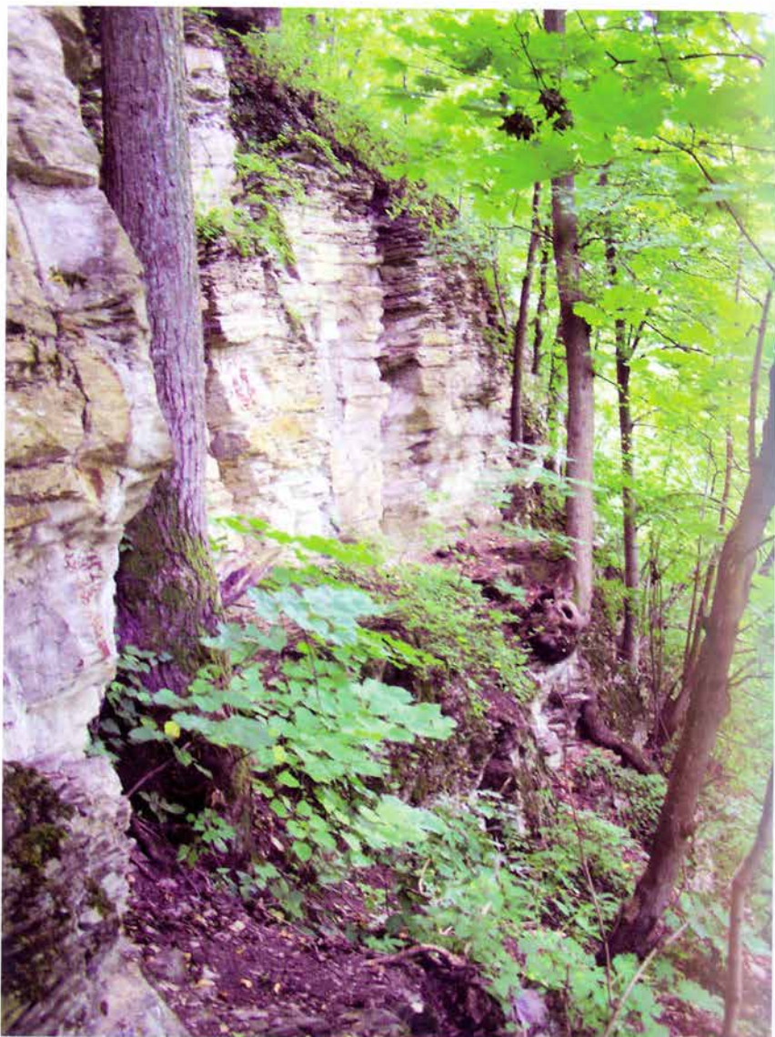
Foto 10: Suťová lipová javořina (k článku na str. 65).

Poto 10: Scree and ravine lime – maple forest (see page 65).