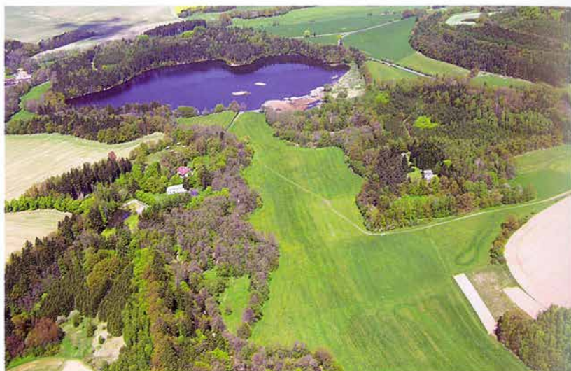
Foto 12: Letecký pohled na navrhovanou PR Svatomariánské údolí (k článku na str. 203).

Photo 12: Aerial view of Svatomariánské údolí (see page 203).