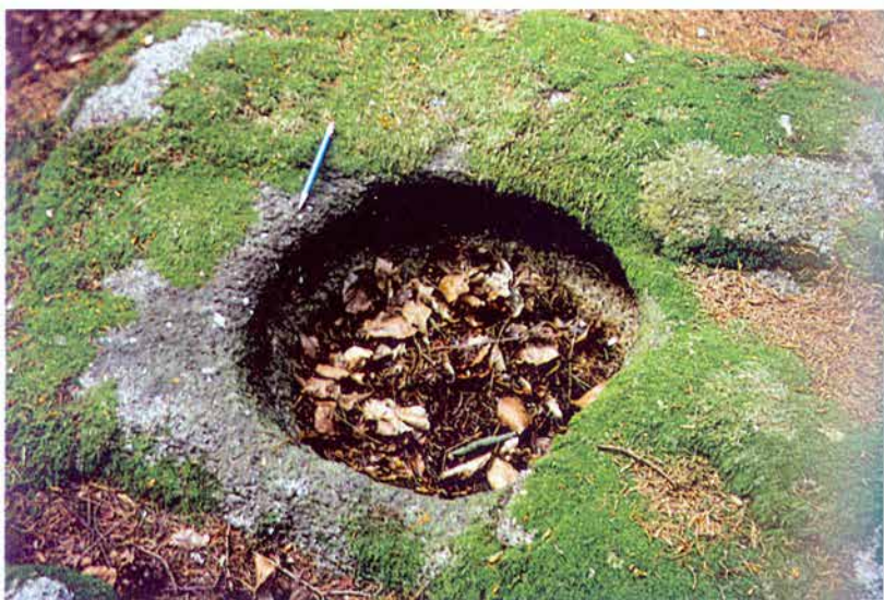
Foto 4: Skalní mísa na žulovém výchozu U skály v severní části melechovského masívu (k článku na str. 3).

Photo 3: Granite rock form (tor) – Čertův kámen (Devil's stone) – on southern slope of the Melechov hill (see page 3).