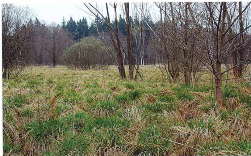
Foto 17: Ostřícové porosty v jádrové části navrhovaného maloplošného chráněného území u rybníka Malý Karlov (k článku na str. 227).

Photo 17: The sedge beds in central part of proposed protected area near Malý Karlov pond (see page 227).