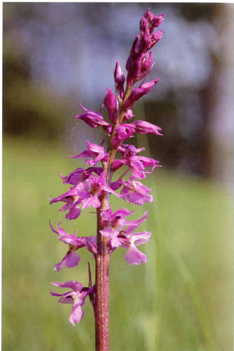
Foto 7: Krskův důl: Orchis mascula subsp. signifera – detail květenství (8 exemplářů na jižním svahu v r. 2005, k článku na str. 33).

Photo 7: Krskův důl: Orchis mascula subsp. signifera – image detail of the flower head (eight specimen on the southern hillside in 2005, see page 33).