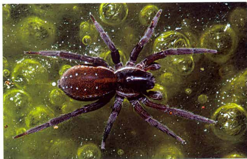
Foto 18: Slíďák potápivý ( Pirata piscatorius ) hojně obývá litorální pásmo i drobné tůňky u rybníka Malý Karlov (k článku na str. 227).

Photo 17: The sedge beds in central part of proposed protected area near Malý Karlov pond (see page 227).