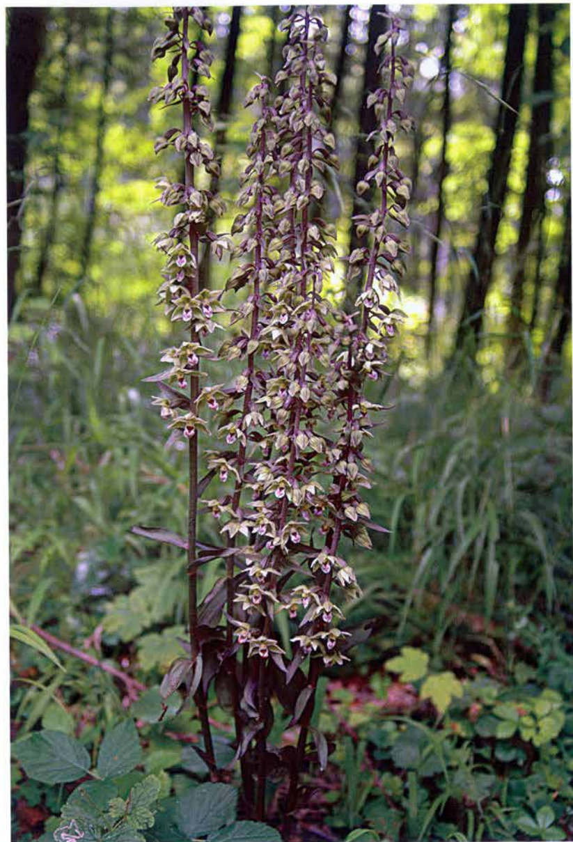
Foto 21: Epipactis purpurata – jeden ze vzrostlých trsů (k článku na str. 253).

Photo 21: Epipactis purpurata – one of full-grown tufts (see page 253).