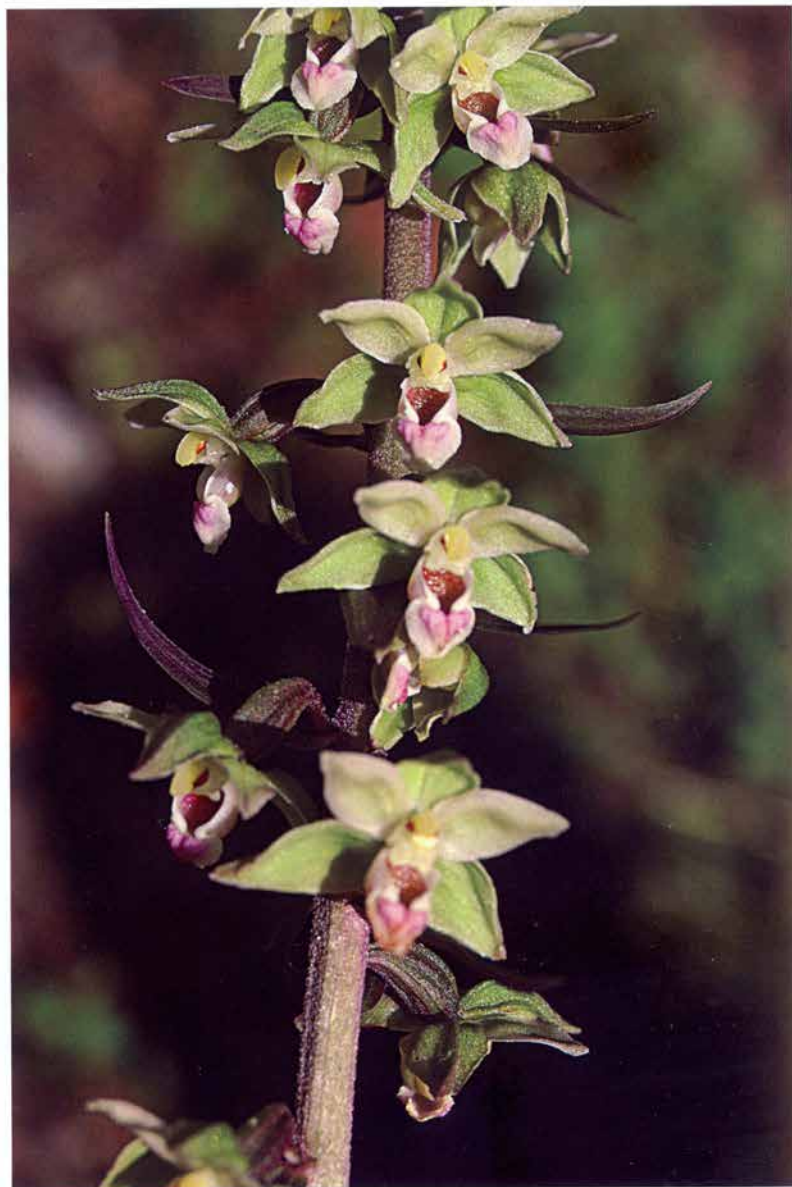
Foto 22: Epipactis purpurata – detail květenství (k článku na str. 253).