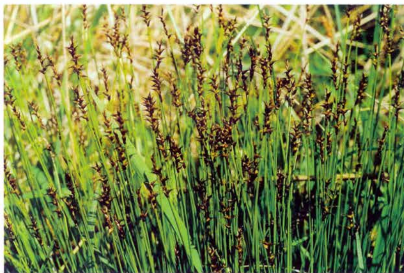
Foto 6: Betlém: Carex davalliana (samiččí exemplář, k článku na str. 33).

Photo 5: Betlém: Trollius altissimus – abundantly in the alder carr and in neighbouring wetland biotopes (see page 33).