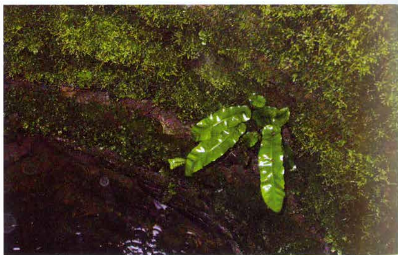
Foto 13: Jelení jazyk ( Phyllitis scolopendrium ) v zámecké studni v Chrasti u Chrudimi 8.7.2005 (k článku na str. 251).

Photo 12: Aerial view of Svatomariánské údolí (see page 203).