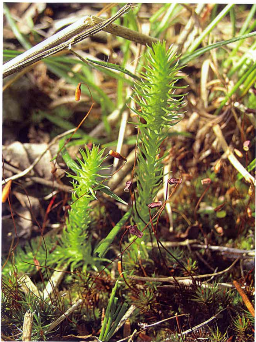
Foto 23: Plavuňka zaplavovaná ( Lycopodiella inundata) na lokalitě u Borohrádku 26.7. 2005 (k článku na str. 257).

Photo 23: Lycopodiella inundata on locality near Borohrádek (see page 257).