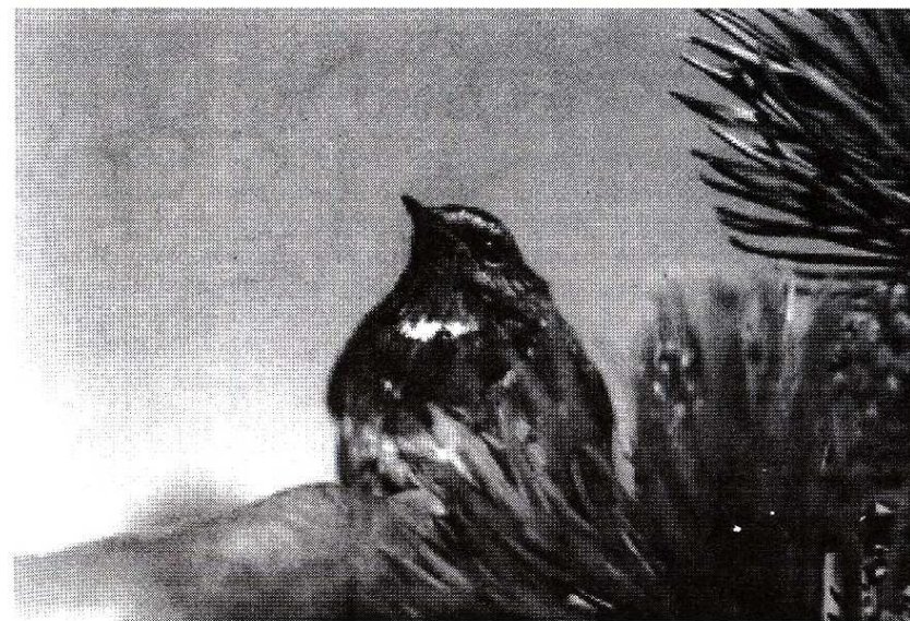
Obrázek: Samec modráčka tundrového ( Luscinia svecica svecica ) s bílou hvězdou. Figure: The male of Red-spotted Bluethroat ( Luscinia svecica svecica ) with white star.