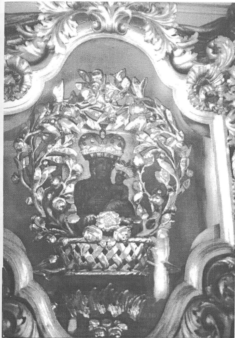
Obraz Panny Marie Přeloučské - originál