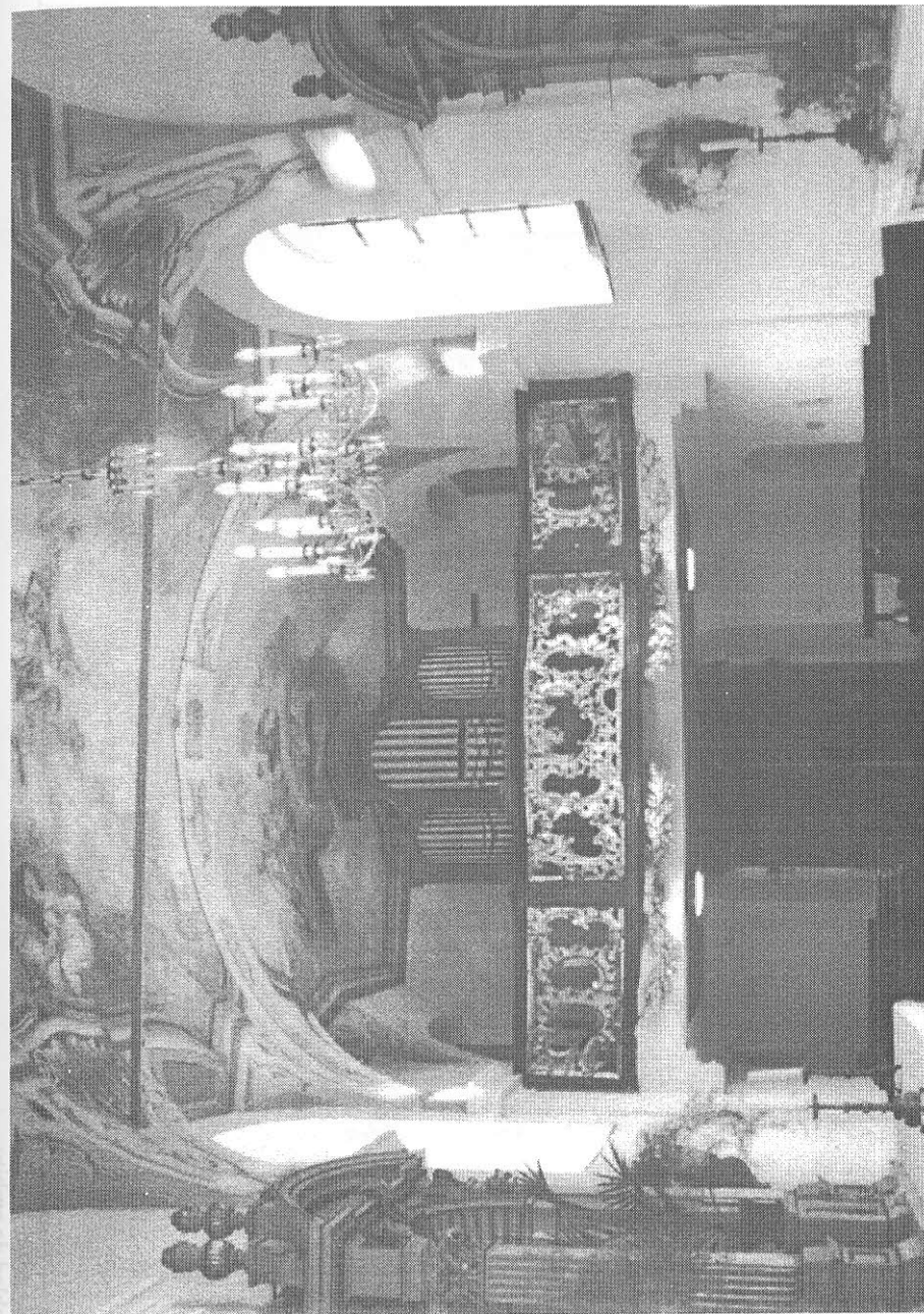
Pohled do západní části kostela