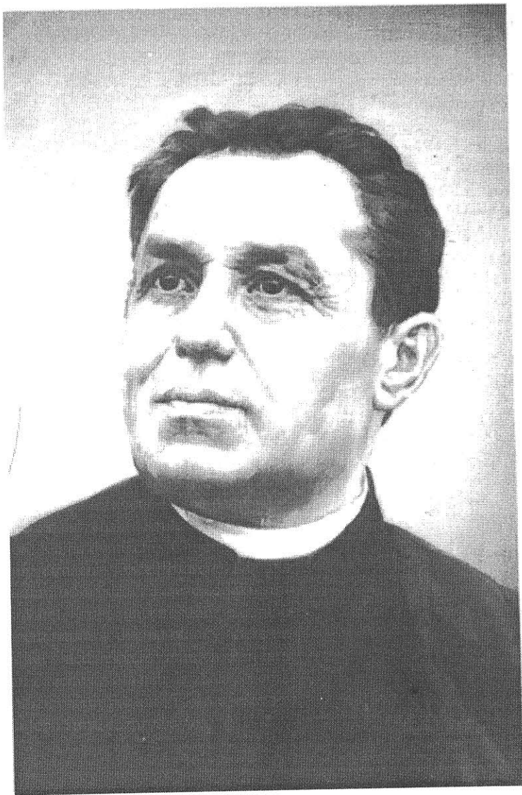
P. Václav Šrám Olej na plátně 54 x 70,5 cm od Karla Medlika z Nové Paky, obraz je uložen na faře ve Smidarech.