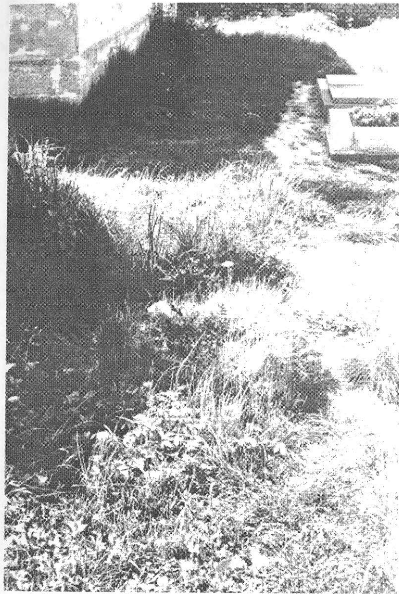
Hrob P. Václava Šráma na hřbitově ve Smidarech.