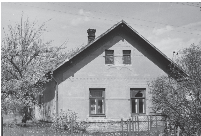
Dubany čp. 19, dům z r. 1921. Stav 2001.