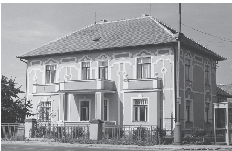
Čepí čp. 22, dům velké zemědělské usedlosti z roku 1909. Stav 2001.