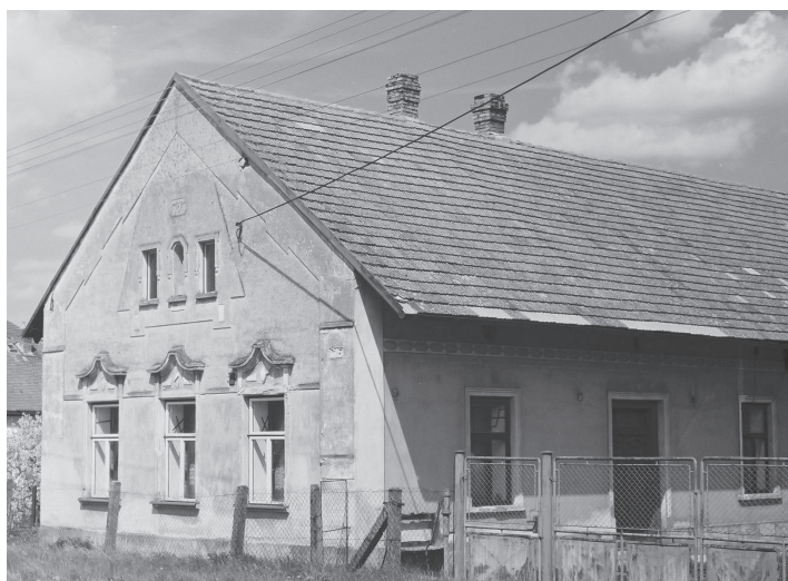
Lány na Důlku čp. 16, dům zemědělské usedlosti, vystavěný v r. 1914 místo dřevěného objektu. Stav 2001.