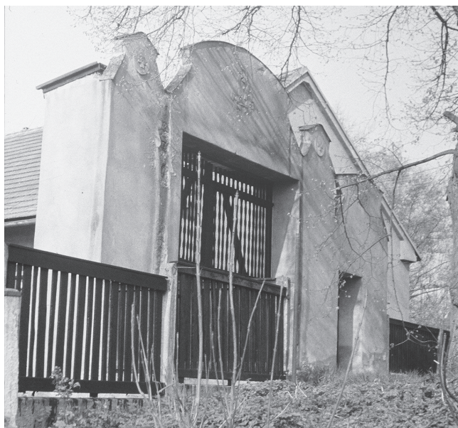
Krchleby čp. 4, vjezdová brána zemědělské usedlosti po úpravě v 1. třetině 20. století. Stav 1989.