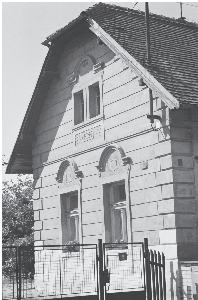
Starý Mateřov čp. 6, dům zemědělské usedlosti, vystavěný v r. 1921 místo dřevěného objektu. Stav 2002.