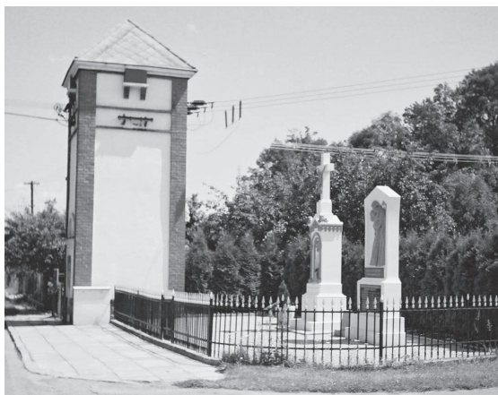
Snojedy, transformátor ze 2. čtvrtiny 20. století u návesního kříže a památníku válečným obětem. Stav 2004.