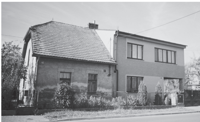
Popkovice čp. 63/64, dvojdomek z r. 1920, přestavba z poslední čtvrtiny 20. století. Stav 2004.