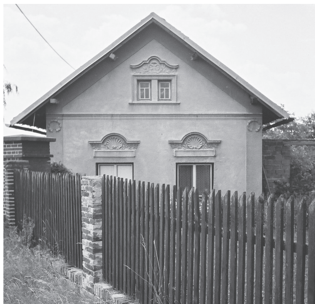
Blato čp. 41, dům z 1. třetiny 20. století. Stav 2003.