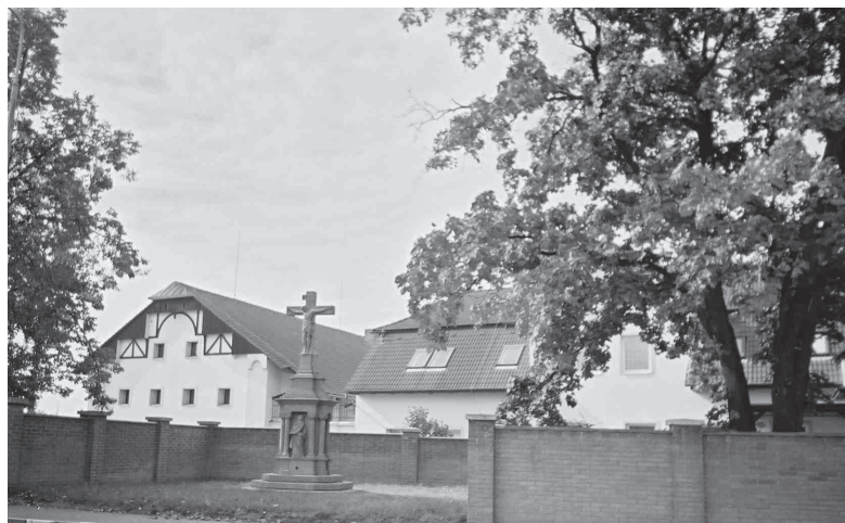
Dražkovice čp. 1, areál velké zemědělské usedlosti s objekty z počátku 20. století, kříž z r. 1898. Stav 2004.