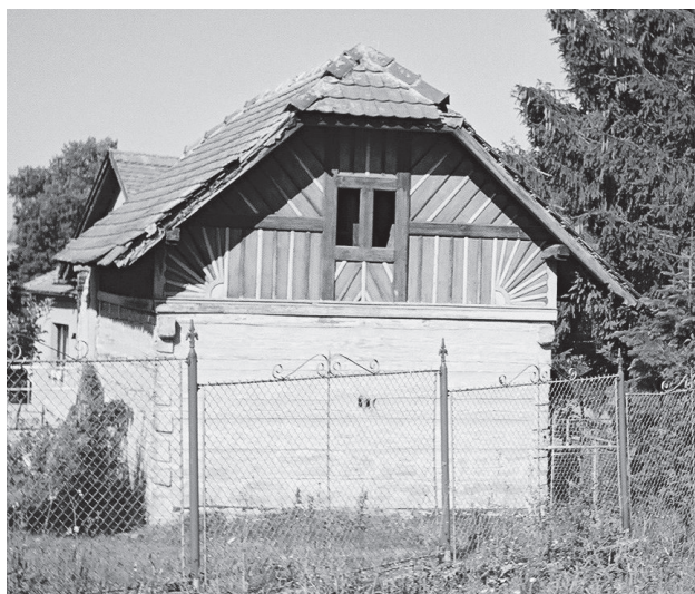
Barchov čp. 28, špýchar z r. 1803 s druhotným krovem a úpravou štítu z 1. čtvrtiny 20. století. V popředí plot z téže doby. Stav 2003.