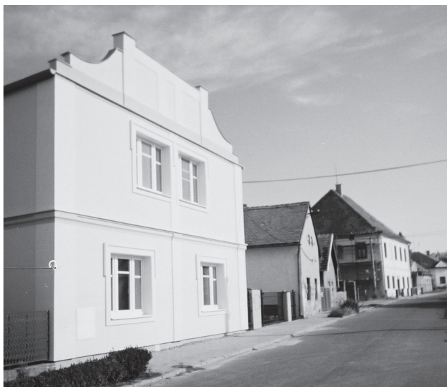
Mikulovice čp. 3, patrový dům s atikovým štítem z 1. třetiny 20. století. Stav 2004.