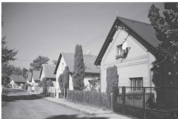
Staré Čívce, zástavba v místní části U pastoušky z 1. třetiny 20. století. Stav 2004.