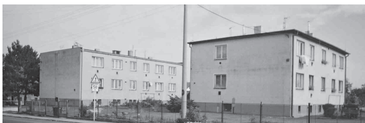
Dražkovice, bytovky v místě zaniklé usedlosti čp. 33. Stav 2004.