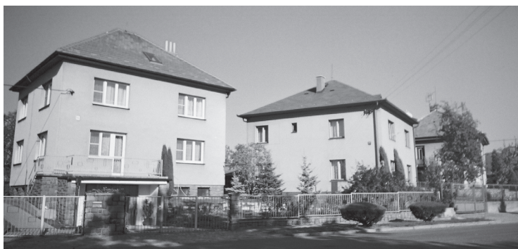
Bezděkov, patrové domy vilového typu ze 70. let 20. století. Stav 2004.