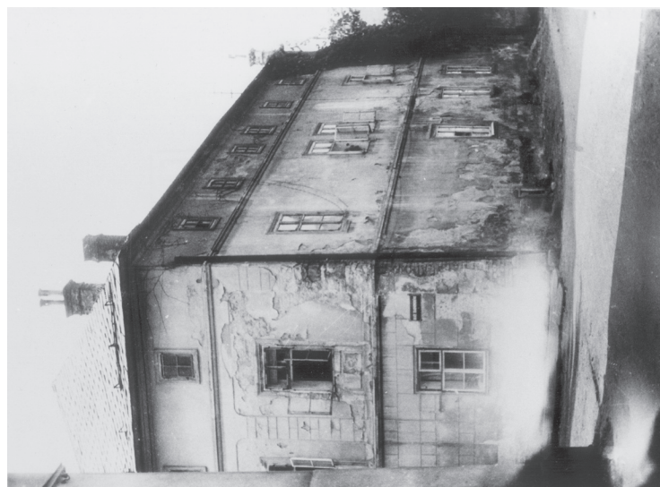
Škorpilovský dům ve Vysokém Mýtě na rohu ulice Bratří Škorpilových a Svatopluka Čecha čp. 46/1.