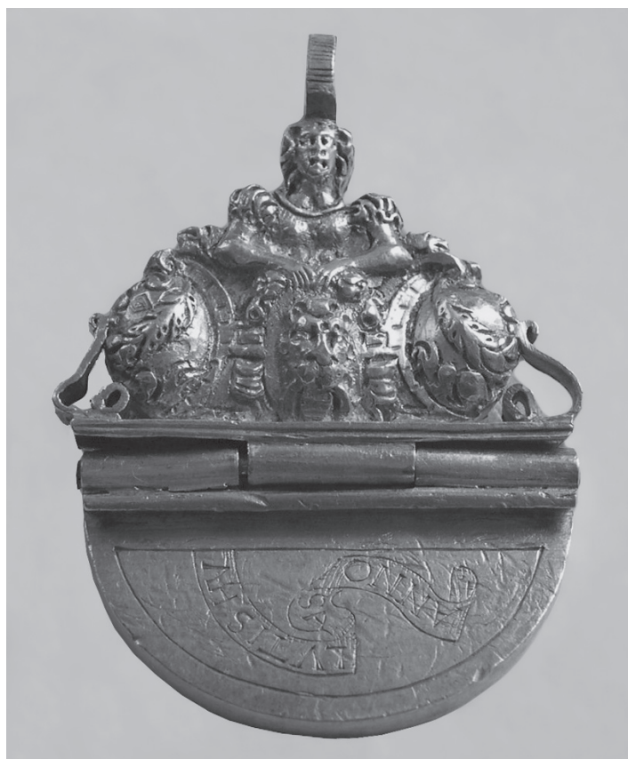
Pečetidlo městečka Bohdanče z roku 1586. 43)