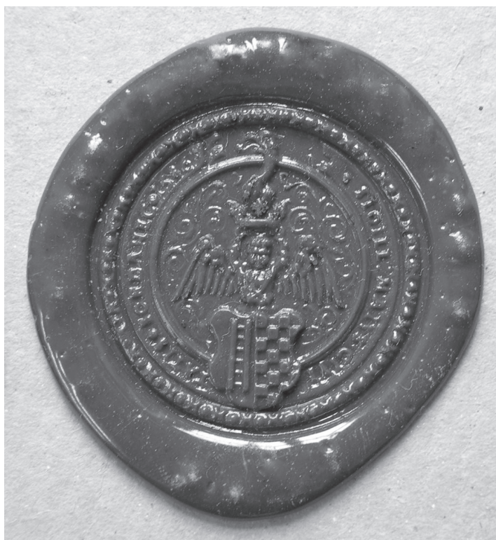
Otisk pečetidla městečka Bohdanče z roku 1586.

považovány výpovědi svědků. Rozsudky městských soudů, tzv. nálezy, obsahovaly zpravidla výrok o vině či nevině obžalovaného a pouze výjimečně výrok o uvěznění a trestu. Dost často byla rozsudkem žalovanému nebo žalobci ukládána povinnost nahradit způsobenou škodu, složit přísahu apod. 26)