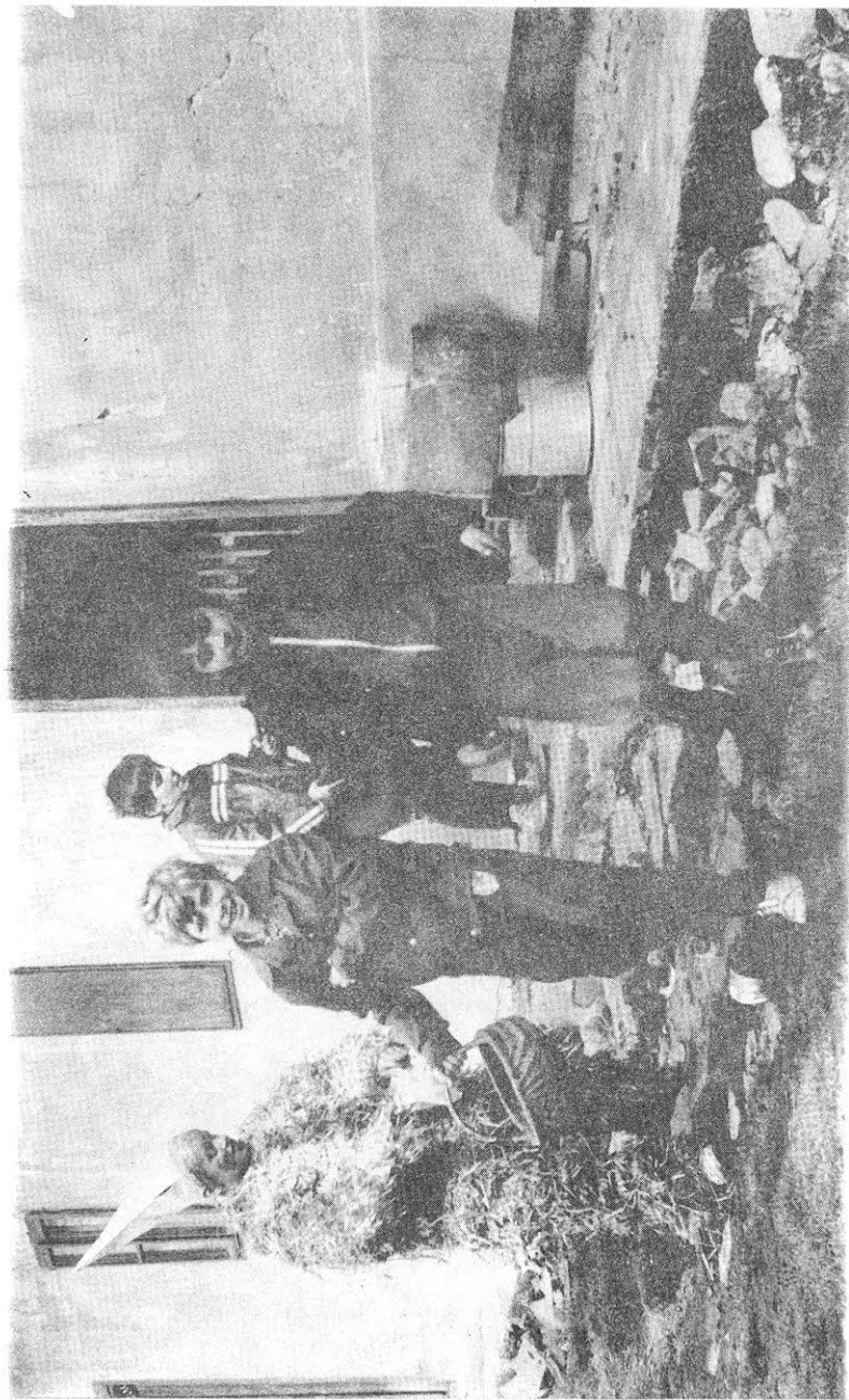
Jaroslav (okr. Pardubice), Jidáš, vodič a páni u domu při obchůzce na Bílou sobotu, 1990.