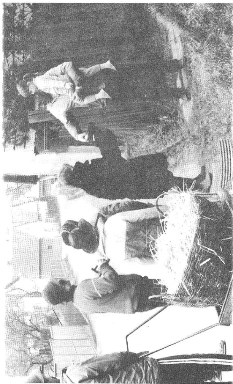
Uhersko (okr. Pardubice), předávání koledy Jidášovi při obchůzce na Vřlou sobotu, 1991.