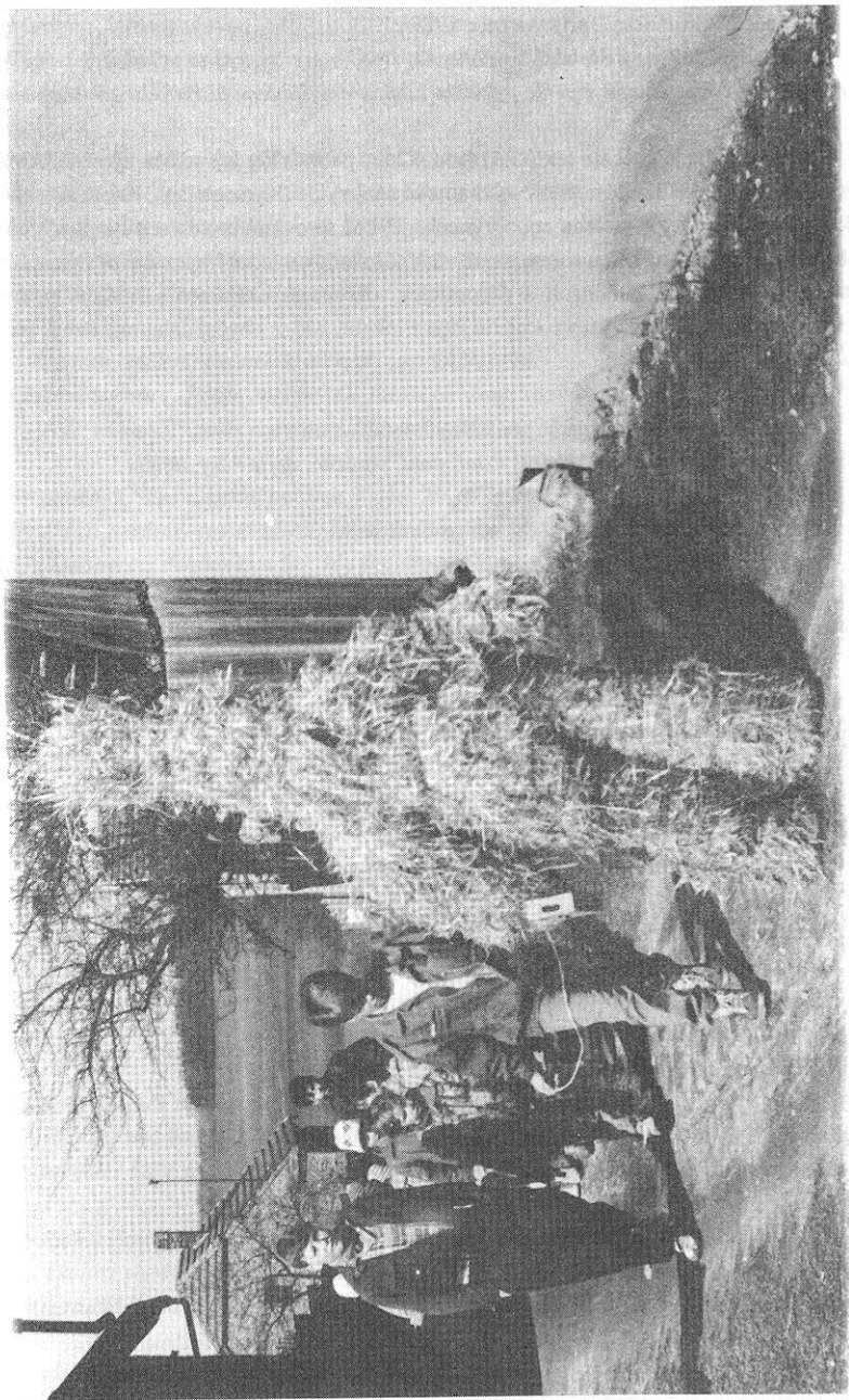
Týnišťko (okr. Pardubice), obchůzka s Jidášem na Bílou sobotu, 1993.