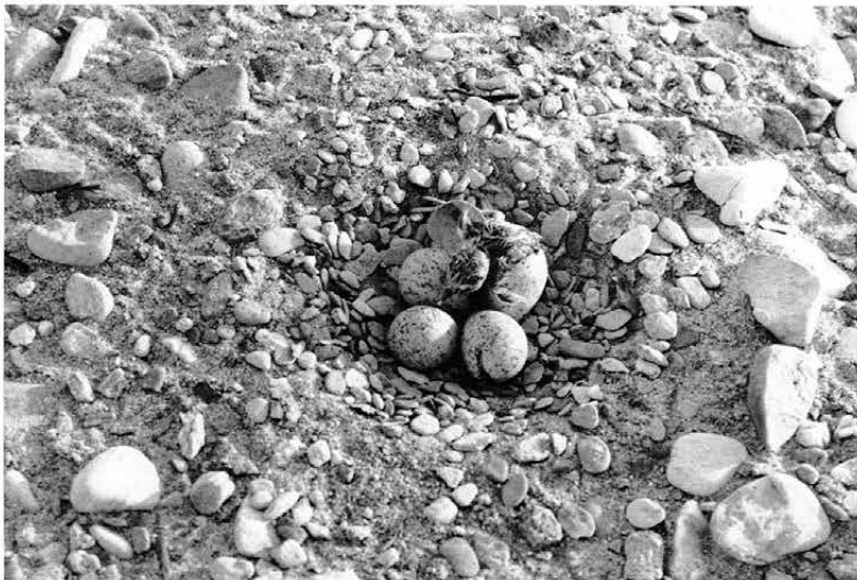
Obr. 4: Hnízdo kulíka říčního ( Charadrius dubius ) s líhnoucím se mládětem (článek na str. 107).

Fig. 3: Nest of the Common Sandpiper ( Actitis hypoleucos ) near Blešno village on the river Orlice (see page 107).