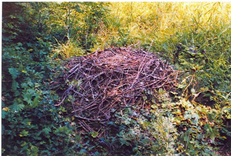
Obr. 7: Náhradní hnízdo čápa černého ( Ciconia nigra ) postavené na pařezu na pasece v lokalitě Halín (článek na str. 131).

Fig. 7: Alternate nest of the Black Stork ( Ciconia nigra ) built on a tree stump on a clearing in Halín wood near Dobruška town (Eastern Bohemia) (see page 131).