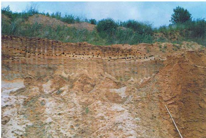
Obr. 1: Hnízdiště břehule říční ( Riparia riparia ) na lokalitě Chotouň - subkolonie č. 3. (článek na str. 3).

Fig. 1: Breeding site of the Sand Martin ( Riparia riparia ) in Chotouň - sub-colony No. 3 (see page 3).