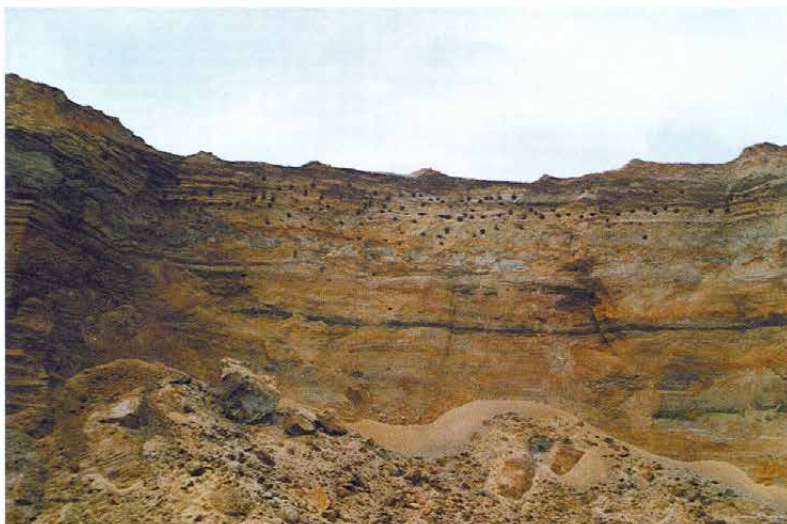
Obr. 2: Hnízdiště břehule říční ( Riparia riparia ) na lokalitě Chotouň - subkolonie č. 5 (článek na str. 3).

Fig. 1: Breeding site of the Sand Martin ( Riparia riparia ) in Chotouň - sub-colony No. 3 (see page 3).