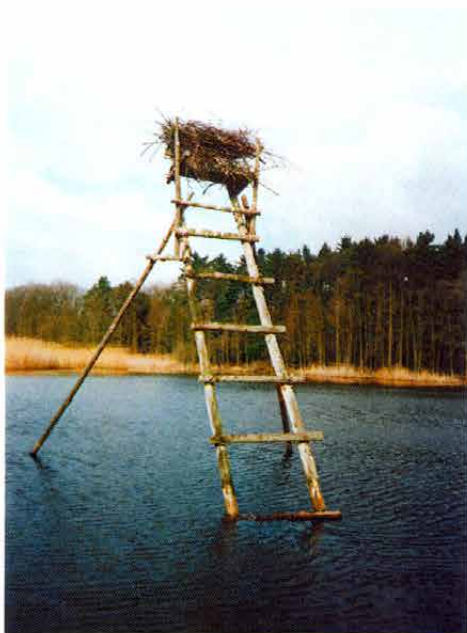
Fig. 5: Nest of the Grey Heron ( Ardea cinerea ) on a seat of a deer-stand in Natural Preserve Baroch Pond (see page 135).

Obr. 5: Hnízdo volavky pope- lavé ( Ardea cinerea ) na mys- liveckém posedu v přírodní rezervaci Baroch (článek na str. 135).