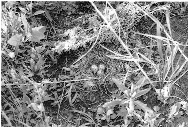
Obr. 3: Hnízdo písíka obecného ( Actitis hypoleucos ) na spojené Orlici u Blešna (článek na str. 107).

Fig. 3: Nest of the Common Sandpiper ( Actitis hypoleucos ) near Blešno village on the river Orlice (see page 107).